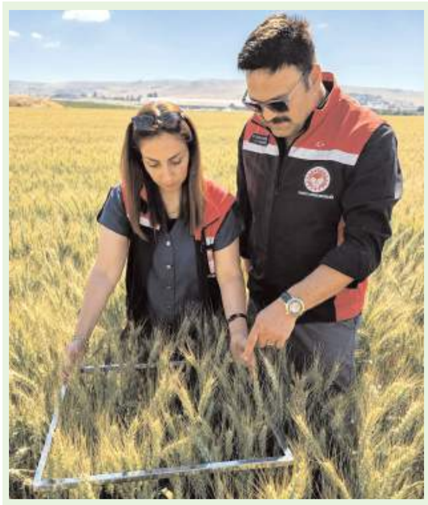
İl Tarım ve Orman Müdürlüğü teknik personelleri sahada gözlem yaptı.