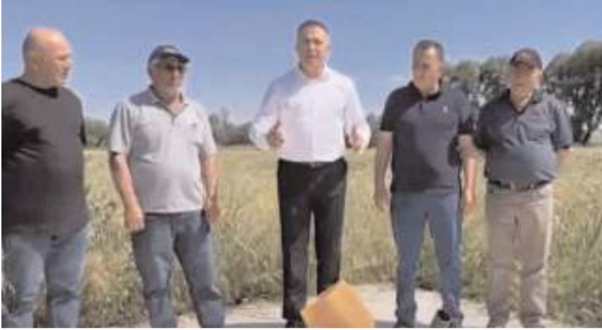
CHP Çorum Milletvekili Mehmet Tahtasız, köyde yaşanan su sorununu dile getirdi.

Tahtasız, "Bugün gelinen noktada bu söz hâlâ yerine getirilmedi. Buradan Sayın Valimize ve DSİ Bölge Müdürümüze sesleniyorum, köylümüz, kendilerine verilen sözün tutulmasını ve mağduriyetin giderilmesini; emekle işlenen topraklarının suya kavuşmasını istiyor" dedi.