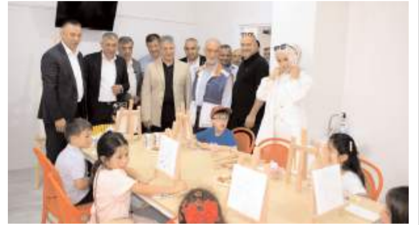
Davetliler işletmeyi gezerek çalışmalar hakkında bilgi aldılar.

Akademide piyano, keman, yan flüt, bağlama, gitar ve resim branşlarında eğitim verilecek. Alanında uzman eğitmenler eşliğinde gerçekleştirilecek derslerde bireysel ve grup eğitimlerinin yanı sıra öğrencilerin yaratıcılıklarını geliştirmeye yönelik çalışmalar da