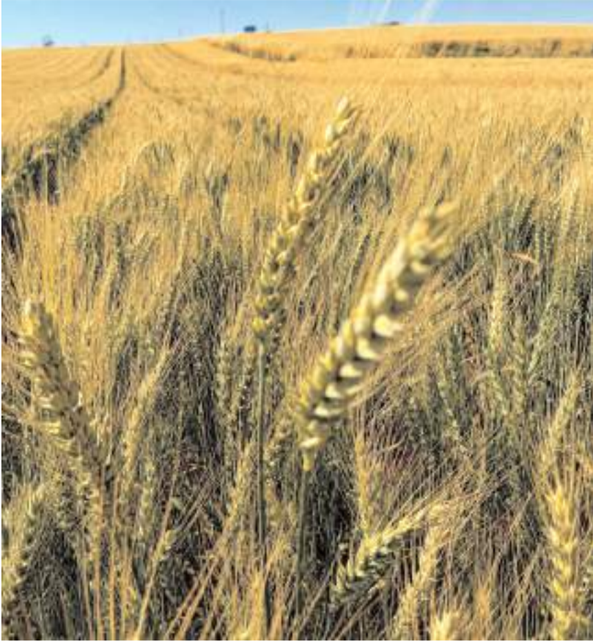
Demonstrasyon çalışması kapsamında, Çorum'da ilk kez ekimi gerçekleştirilen yerli ve milli yazlık buğday çeşidi 'kirve', gelişim performansıyla dikkat çekti.