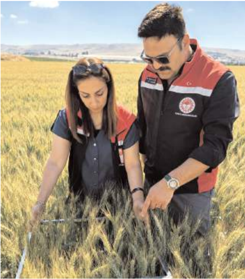
İl Tarım ve Orman Müdürlüğü teknik personelleri sahada gözlem yaptı.