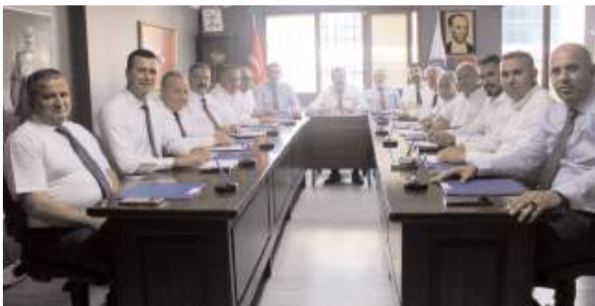
Yeni yönetim ilk toplantısını yaptı.