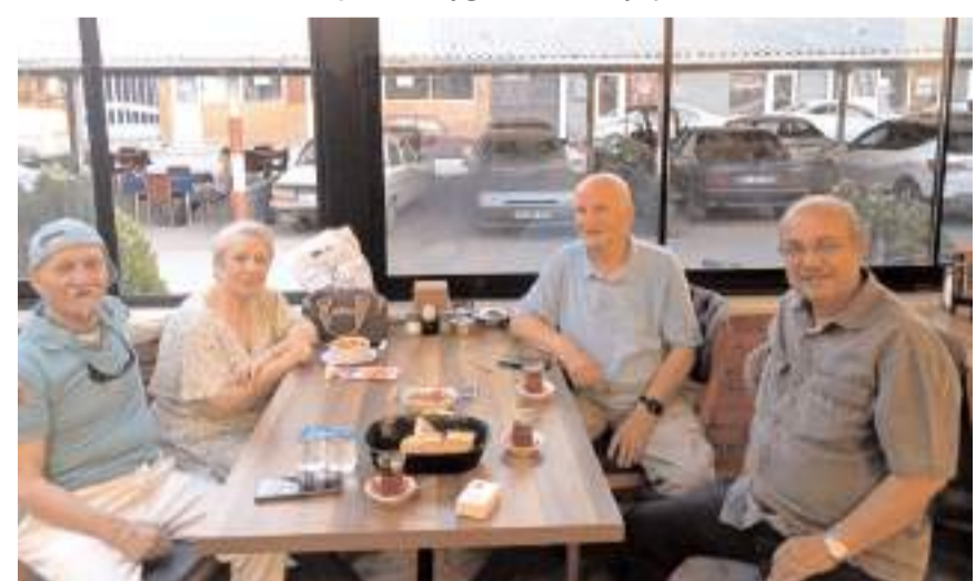
Öztürk çifti, öğrencileriyle hasret giderdi.