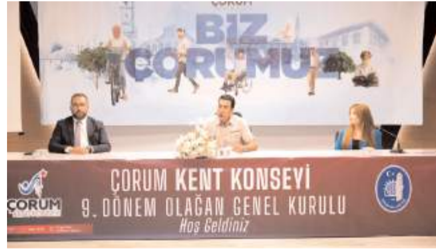
Genel kurulda ilk olarak divan heyeti belirlendi.

vam etmesini temenni ediyorum" diye konuştu.