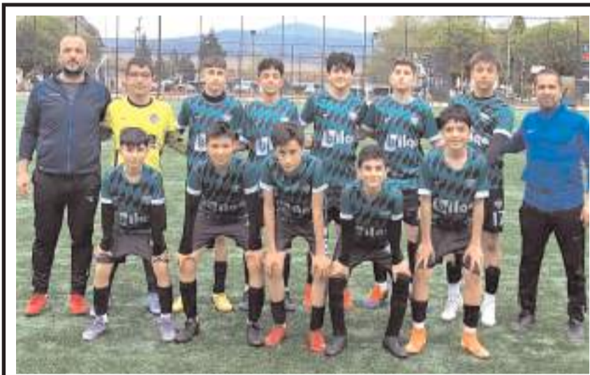
Osmançık Kandiberspor U 14 takımı Gelişim Liginde mücadele etmek için başvurdu

Geçtiğimiz sezon başında bu sezon uygulanacağını duyurduğumuz yabancı futbolcu uygulaması kapsamında, kulüplerin A Takım Listesi'nde yer vereceği 10 yabancı futbolcu için herhangi bir yaş kriteri aranmamaktadır. A Takım Listeleri'ne 14 yabancı futbolcunun yazılması halinde, en az 4'ünün 01.01.2003 veya daha sonraki tarihte doğmuş olması zorunluluğu bulunmaktadır' denildi.