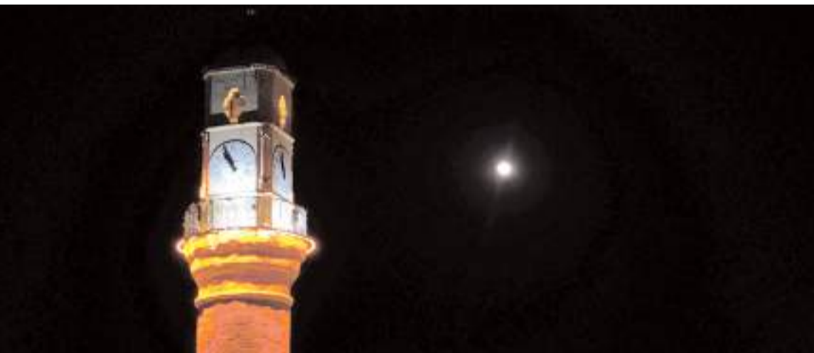
Çilek dolunay görsel bir şölen sundu.