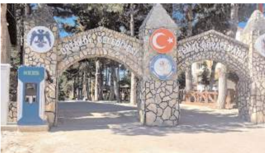
Şarj istasyonu Kent Meydanı Saat Kulesi civarına yerleştirildi.