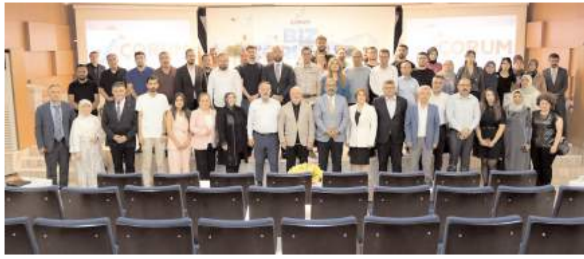
Genel kurulun ardından toplu hatıra fotoğrafı çekildi.