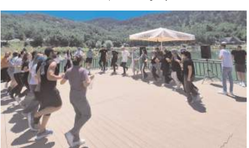
Etkinlikte bol bol halay çekildi.