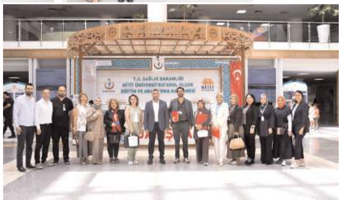
Halk Sağlığı Genel Müdürlüğü denetim ekibi, Erol Olçok Eğitim ve Araştırma Hastanesinde inceleme yaptı.