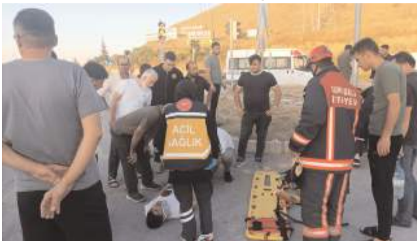
Yaralıları ilk müdahaleyi 112 acil sağlık ekipleri yaptı.

Öte yandan, kaza anı çevredeki bir iş yerinin güvenlik kamerasına yansdı.(AA)