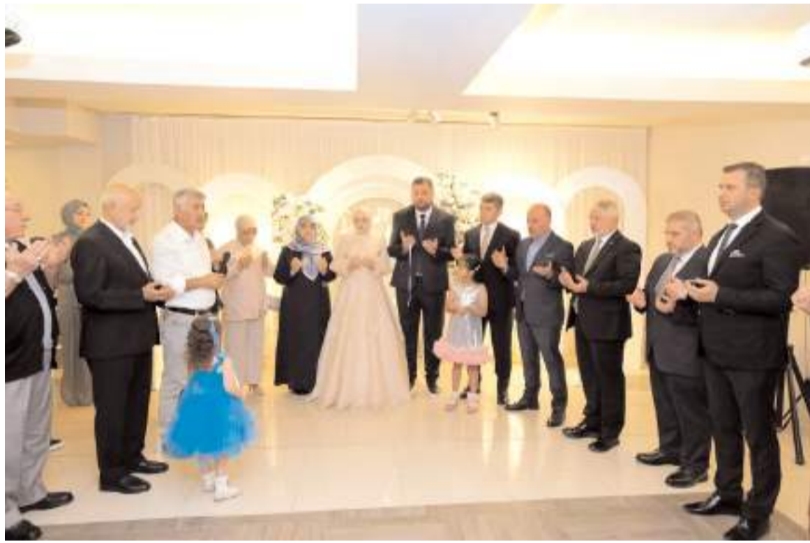
Nişan töreni Amasya'da Muson Davet Evi'nde yapıldı.

Aşgın, nazik ziyaretlerinden dolayı heyete teşekkür ederken, yeni dönemde çalışmalarında başarılar diledi.