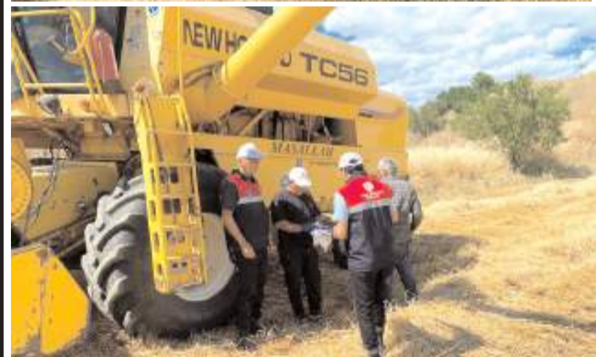
Biçerdöverler hububat hasat döneminde ürün kayıplarının önlenmesi, hasadın daha verimli yürütülmesi ve olası yangın risklerinin azaltılması amacıyla kontrol ediliyor.

Hasat sezonu boyunca denetimlerin devam edeceği belirtildi.