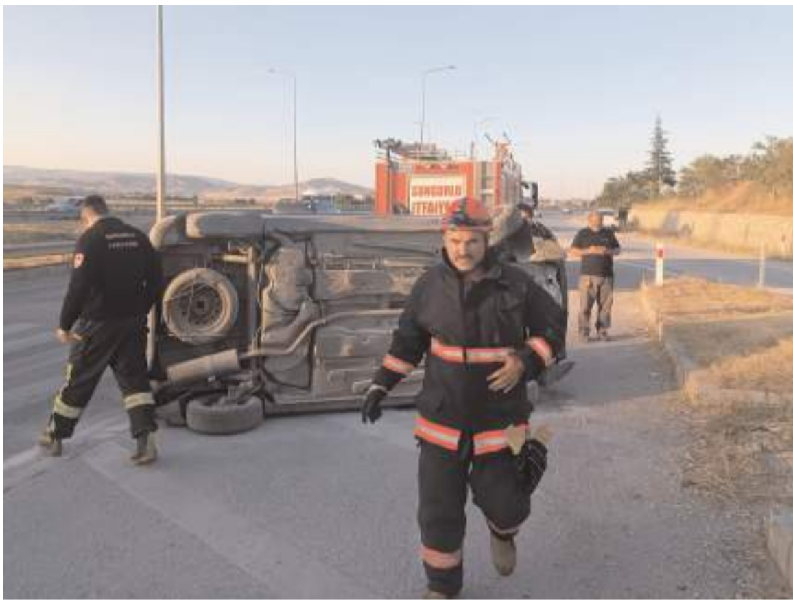
Kaza Sungurlu Kemallı Kavşağı mevkinde meydana geldi.