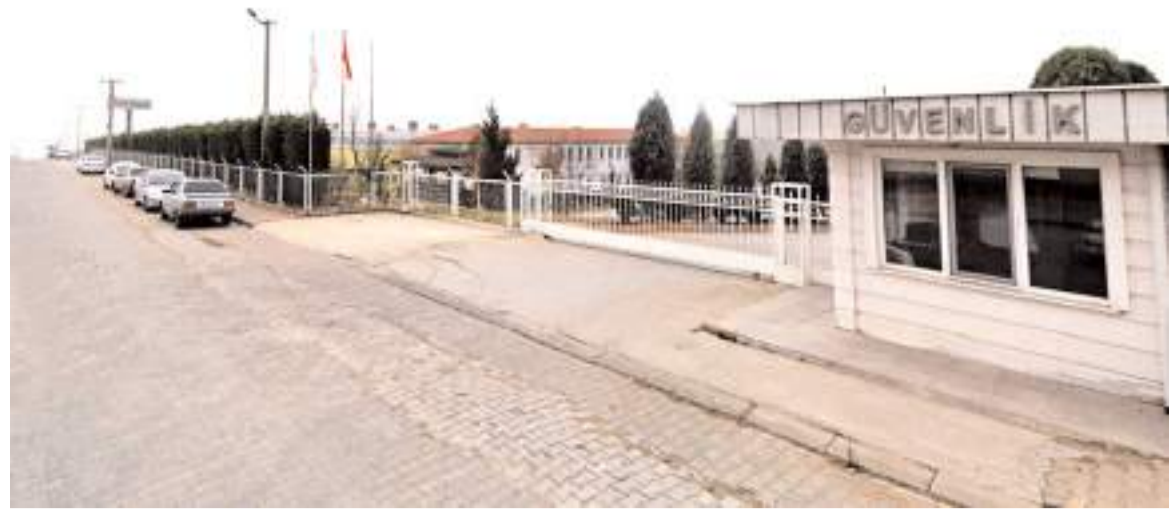
Fabrika Organize Sanayi Bölgesi'nde bulunuyor.

Kulüp üyeleri, organizasyonda emeği geçen Çorum Koşu Kulübü yönetimine teşekkür ederken, bir sonraki etkinliği sabırsızlıkla beklediklerini ifade etti. (Haber Merkezi)