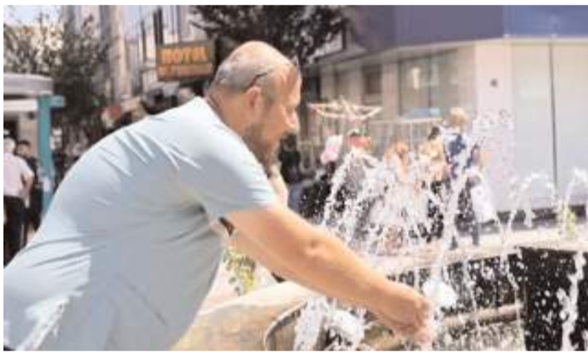
Perşembe günü termometreler 35 dereyi görecek.

Uzmanlar, yüksek sıcaklık nedeniyle özellikle öğle saatlerinde dışarı çıkaracakları uyarırken, hava sıcaklığı Pazar günü normale dönecek.