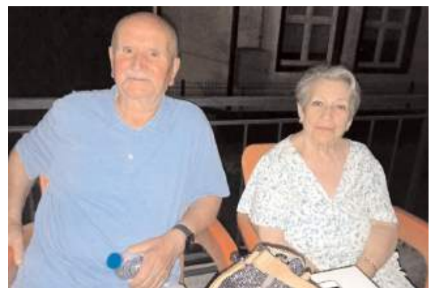
Buluşmada duygulu anılar yaşadı.