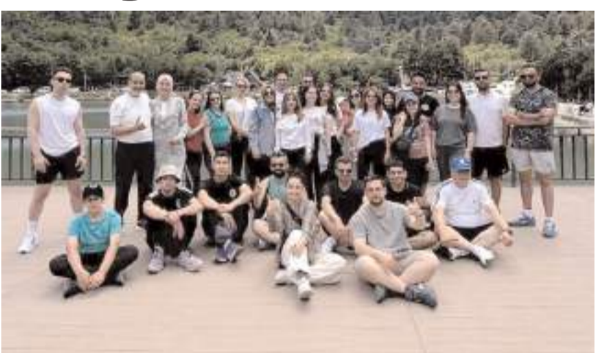
Günün anısına toplu hatıra fotoğrafı çekildi.