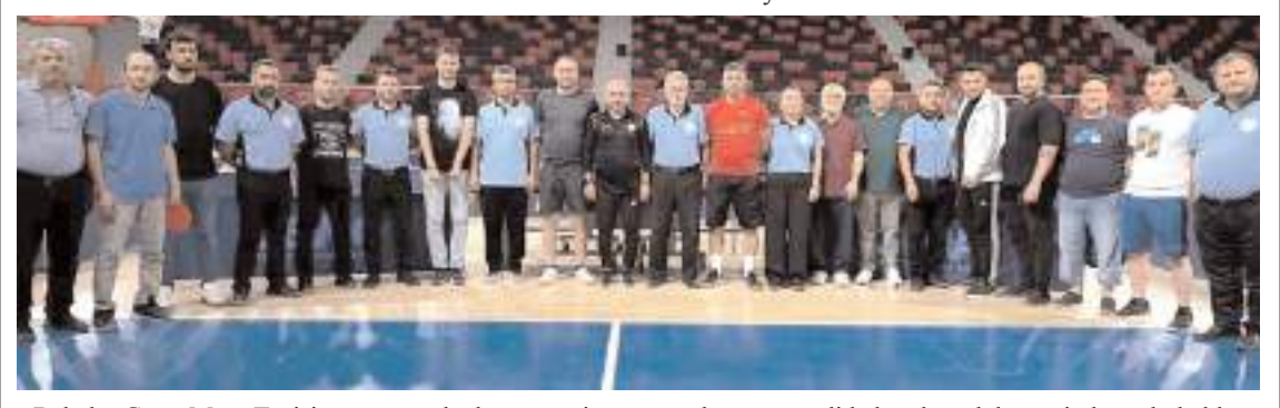
Babalar Günü Masa Tenisi turnuvasında dereceye giren sporcular ve görevli hakemler ödül töreninde toplu halde

Final maçının ardından düzenlenen törenle dereceye girenlere ödülleri İl Temsilcisi ve İl Hakemler Kurulu üyeleri tarafından verildi.