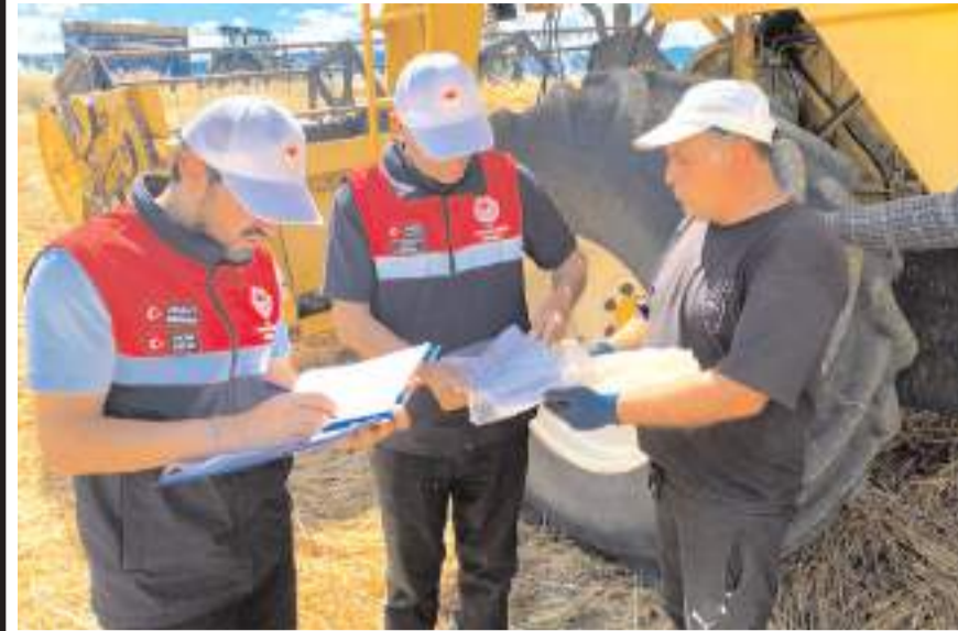
Dodurga İlçe Tarım İl Müdürlüğü teknik personelleri biçerdöverleri kontrol etti.

Çorum'un Dodurga ilçesinde Tarım İl Müdürlüğü teknik personellerince, hububat hasat döneminde ürün kayıplarının önlenmesi, hasadın daha verimli yürütülmesi ve olası yangın risklerinin azaltılması amacıyla biçerdöver kontrolleri aralıksız sürdürülüyor.