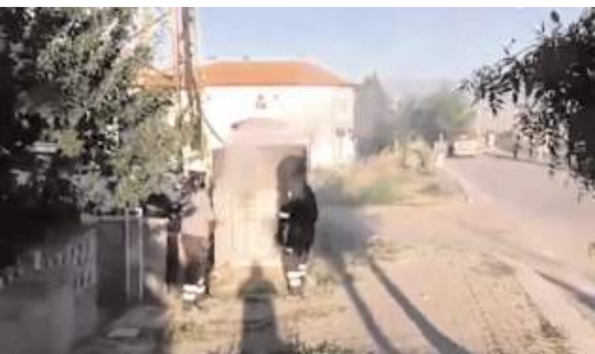
Olay Esentepe Mahallesi Çorum Caddesinde meydana geldi.

Ekipler tarafından söndürülen yangında trafoda hasar oluşurken, bölgede bir süre elektrik kesintisi yaşandı.(AA)