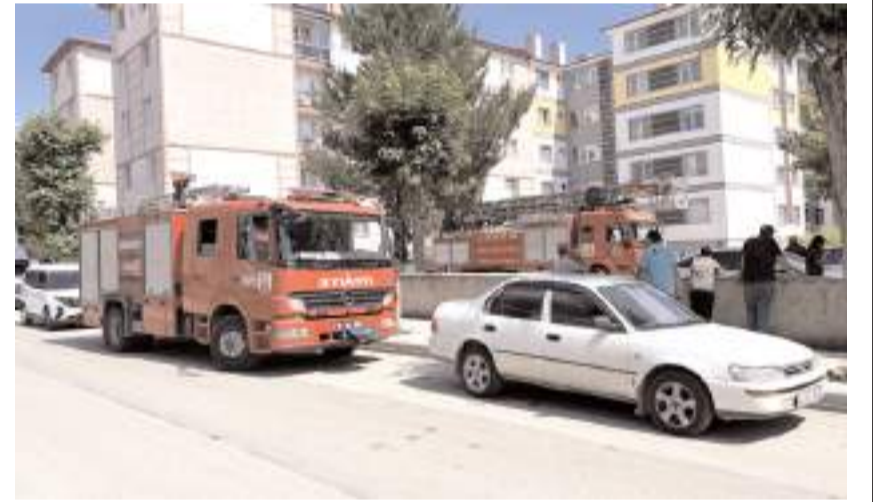
Olay yerine itfaiye ve polis ekipleri intikal etti.