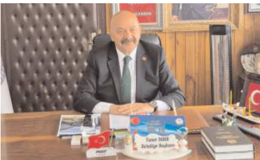
Ortaköy Belediye Başkanı Taner İsbir