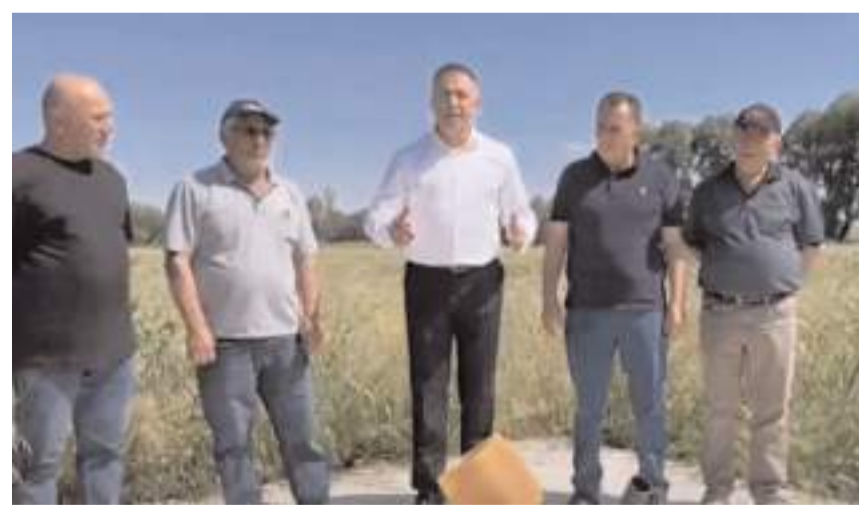
CHP Çorum Milletvekili Mehmet Tahtasız, köyde yaşanan su sorununu dile getirdi.