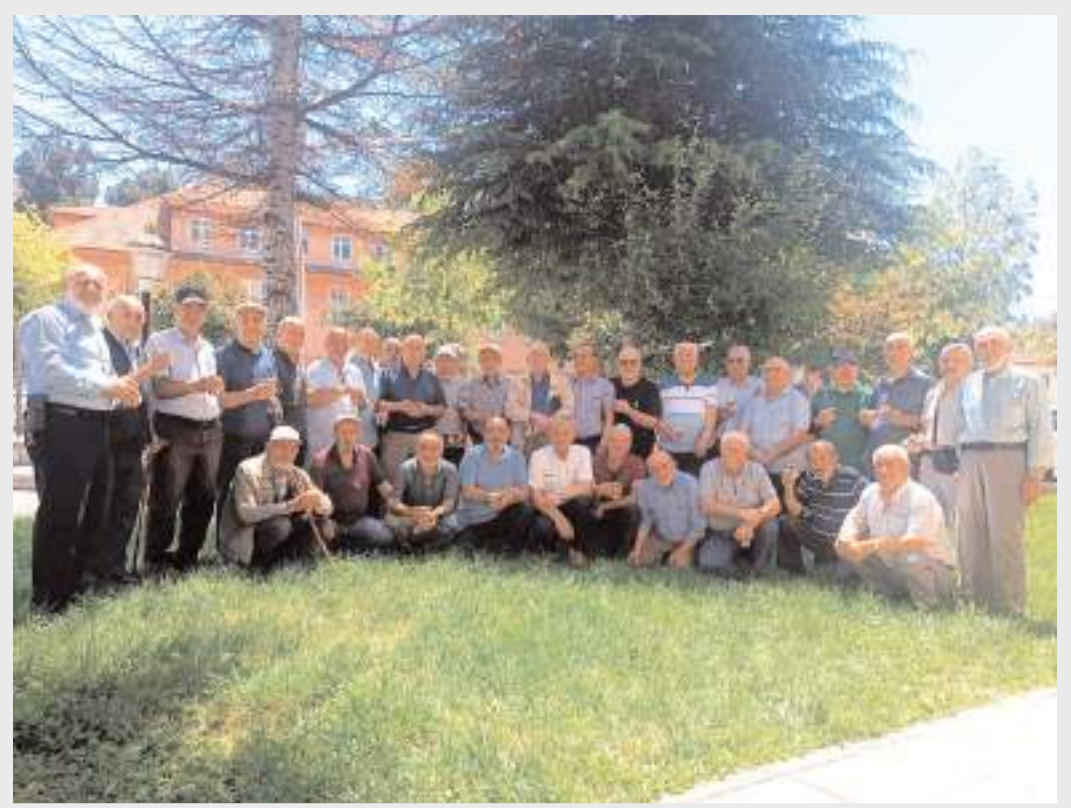
Çimento Fabrikası emektarları anıları tazelediler.