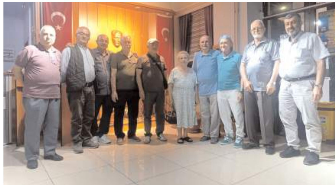
Emekli öğretmen çift, 52 yıl aradan sonra eski öğrencileriyle bir araya gelerek

Muhammen bedeli 93 milyon lira değerindeki fabrikanın satış ihalesi 13 Ağustos tarihinde gerçekleştirilecek.