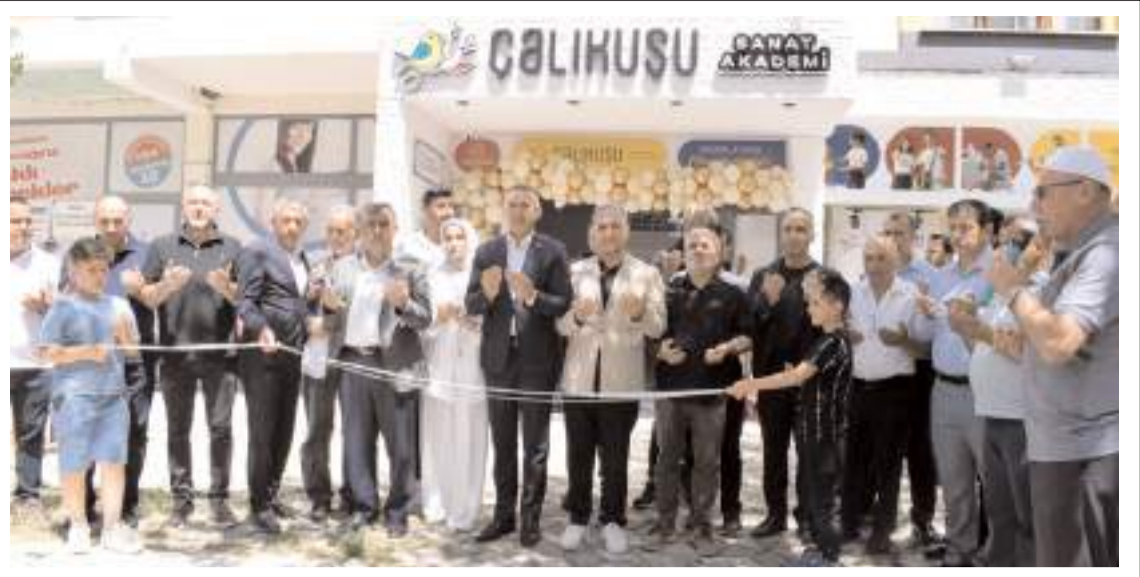
Yapılan duanın ardından açılış kurdelesi kesildi.