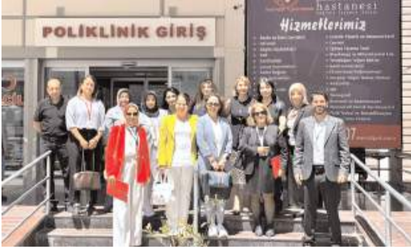
Halk Sağlığı Genel Müdürlüğü denetim ekibi Çorum'da sağlık kuruluşlarında denetim yaptı.

İl Sağlık Müdürlüğü, "Altın Bebek Dostu İl" unvanının gerektirdiği sorumluluk doğrultusunda anne ve bebek sağlığını önceleyen hizmetlerin güçlendirilerek sürdürüleceğini bildirdi. (Haber Merkezi)