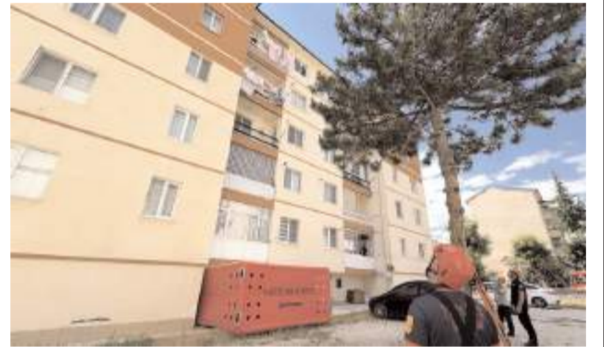
Şahsın atlama ihtimaline karşı zemine hava yastığı kuruldu.

lan kontrolünün ardından ifadesi alınmak üzere polis merkezine götürüldü.(İHA)