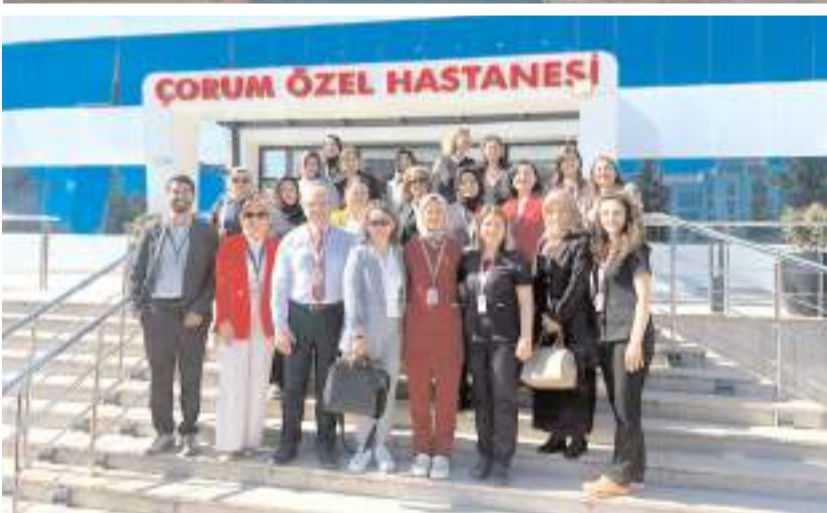
Program anne ve çocuk sağlığının korunması, bebek ölümlerinin azaltılması, emzirmenin desteklenmesi ve anne sütünün teşvik edilmesi amacıyla yürütüldü.