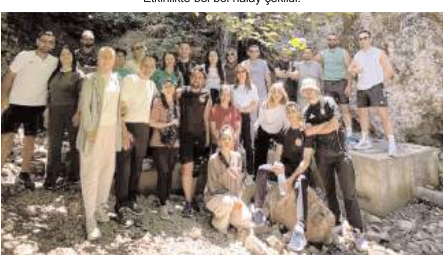
Katılımcılar Yeşil Göl'de bulunan şelaleyi gezdi.

Çorum Koşu Kulübü, hafta sonunu doğayla iç içe keyifli bir etkinlikte değerlendirdi. Kulüp üyeleri bu kez Laçın Yeşil Göl'de bir araya gelerek hem spor yaptı hem de unutulmaz anılar yaşadı.