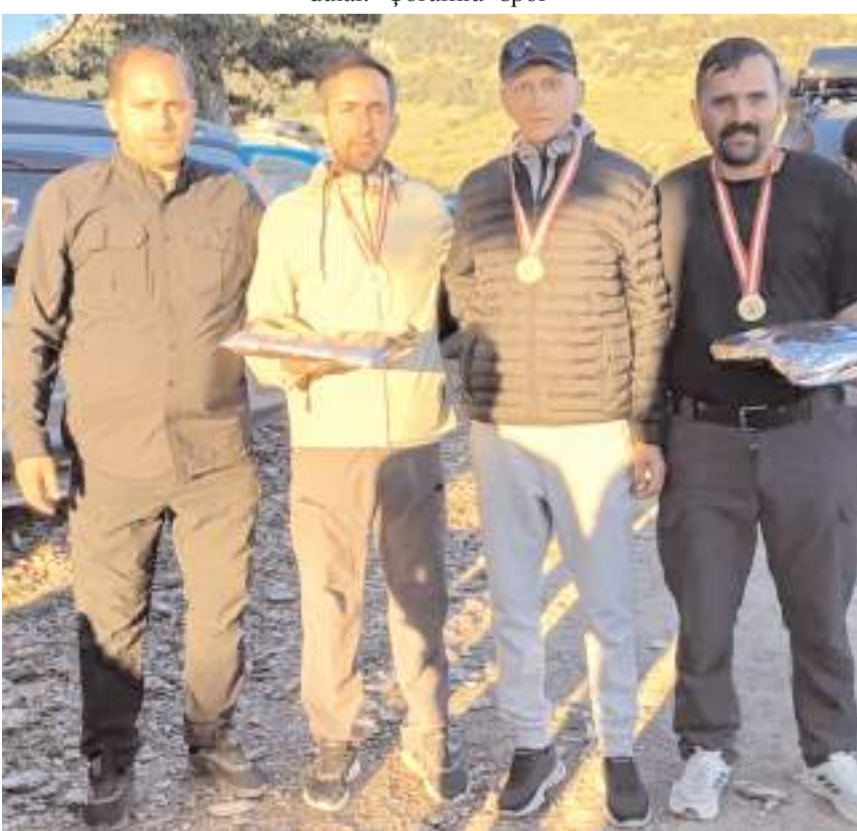
Suluova'da yapılan Tek Kurşun ve Trap yarışmalarında dereceye giren Çorumlu Atıcılar

Çorumlu Atıcılar Suluova'da elde ettikleri bu başarılı dereceleri ile büyük övgü aldılar ve başarılarının artarak devam edeceğine olan inançlarını dile getirdiler.