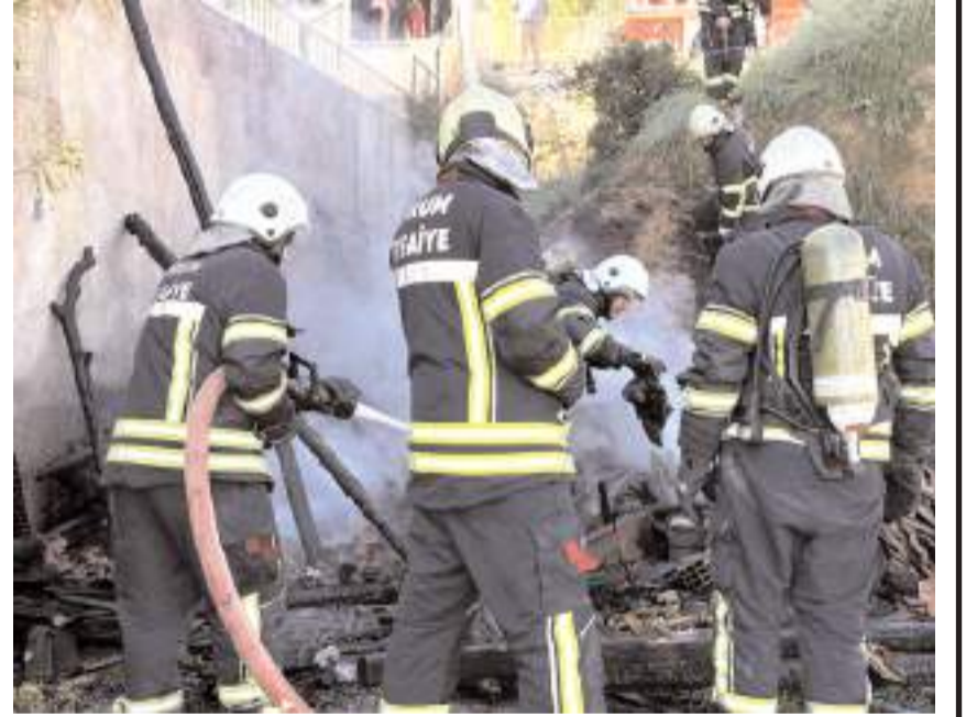
Olay, Mehmet Akif Ersoy 26. Sokak'ta meydana geldi.

Yangınla ilgili inceleme başlatıldı.