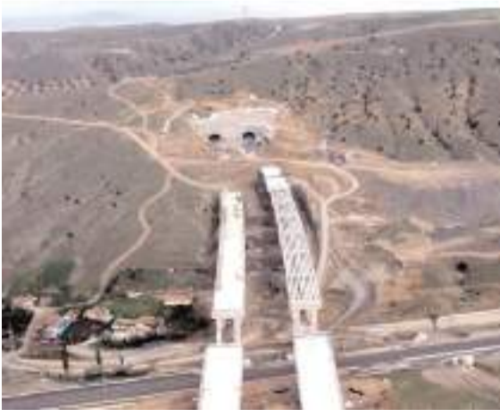
Projede 7 kavşak, 4 tünel, 8 viyadük, 22 kavşak köprüsü, 17 üstgeçit köprüsü ve 63 alt geçidin yer aldı.

Uraloğlu, otoyolun tamamlanmasıyla mevcut güzergahta 80 dakika süren seyahat süresinin 43 dakikaya ineceğine dikkati çekerek, "Proje sayesinde yıllık 6 milyar lirası zamandan, 800 milyon lirası akaryakıttan olmak üzere toplam 6,8 milyar lira tasarruf sağlayacağız. Ayrıca karbon emisyonunu da yıllık 40 bin ton azaltacağız." ifadelerini kullandı.(AA)