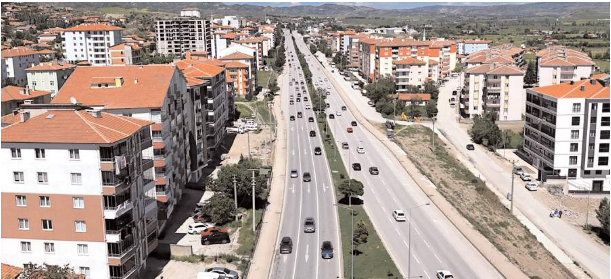
Bölgede trafiğin akışı dronla havadan görüntülendi.

Kurban Bayramı tatili dolayısıyla memleketlerine giden ve dönüş yoluna geçen vatandaşların Karadeniz ile İç Anadolu'yu birbirine bağlayan geçiş güzergahlarından biri olan Çorum'un Sungurlu ilçesinde trafik tedbirleri tatil süresince sürdürüldü. Özellikle D190 Karayolu Çorum-Ankara istikametine trafik akışının kesintiye uğramaması ve sürücülerin mağduriyet yaşamaması amacıyla trafik ışıklarında düzenlemeye gidildi. Bölgede trafiğin akışı dronla havadan görüntülendi. Ekipler tarafından yeşil ışık süresinin uzatılmasıyla birlikte, güzergah üzerinde oluşabilecek uzun araç kuyruklarının önüne geçilirken, araç yoğunluğu da önemli ölçüde azaltıldı. (İHA)