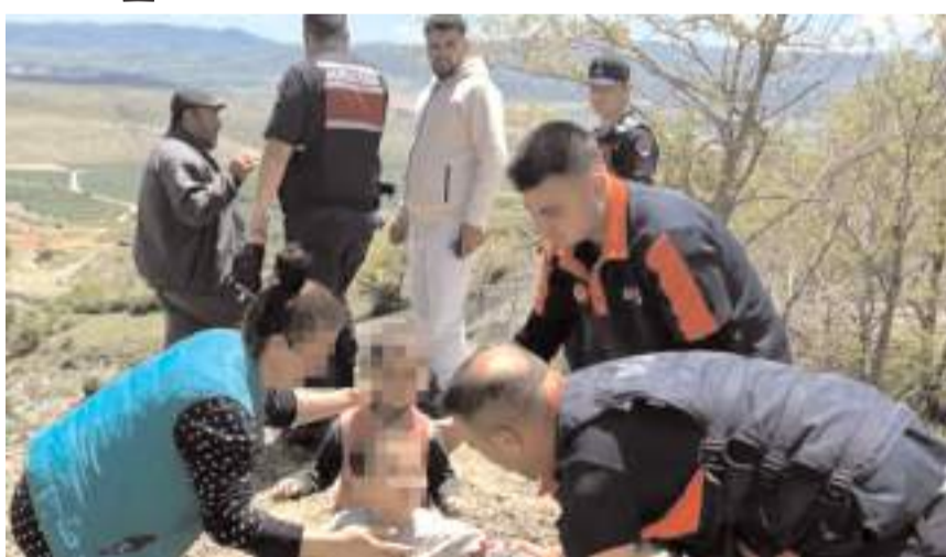
AFAD ekipleri çocukları çamura saplanmış halde buldular.

■ Çorum'un Merkez ilçesine bağlı Karahisar köyünde kaybolduğu bildirilen iki küçük çocuk, yürütülen arama kurtarma çalışmaları sonucunda sağ olarak bulundu.