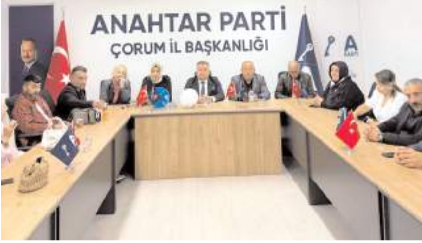
Bayramlaşma programı Anahtar Parti Çorum İl binasında yapıldı.