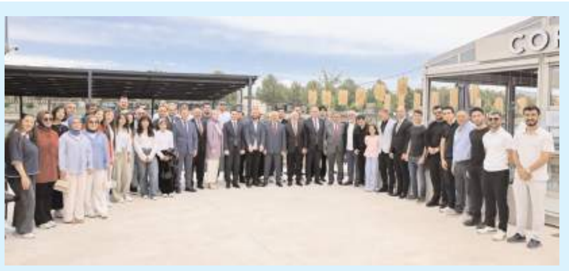
Programın ardından hatıra fotoğrafı çekildi.