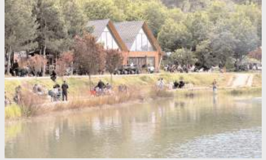
İl dışından ziyaretçilerin Yeşil Göl'e ilgisi artıyor.

Son yağışların etkisiyle göldeki su miktarının arttığı gel çevresinde ziyaretçiler güzel vakit geçirdi.(AA)