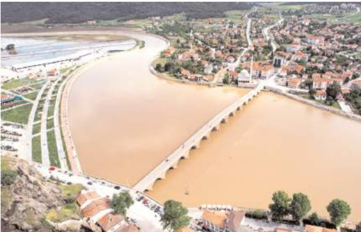
Etkili olan aşırı yağışların ardından Kızılırmak Nehri'nin debisi arttı.