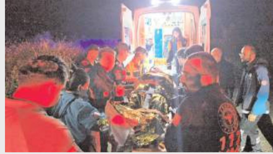
R.A'ya ilk müdahale olay yerinde yapıldı.

Çorum'da yamaç paraşütü yapan sağlık personeli, paraşütünün dolaşması sonucu düştüğü dere yatağından ekiplerin yaklaşık 5 saat süren çalışmasıyla kurtarıldı.