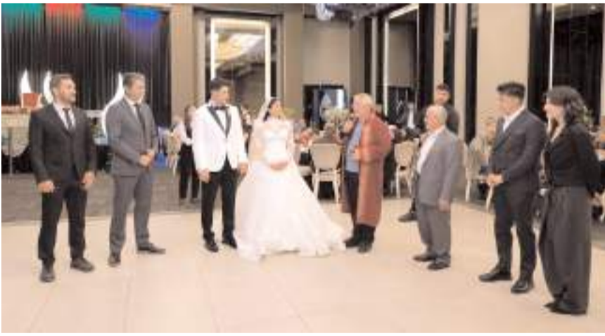
Başkan Aşgın, genç çifte ömür boyu mutluluklar diledi.