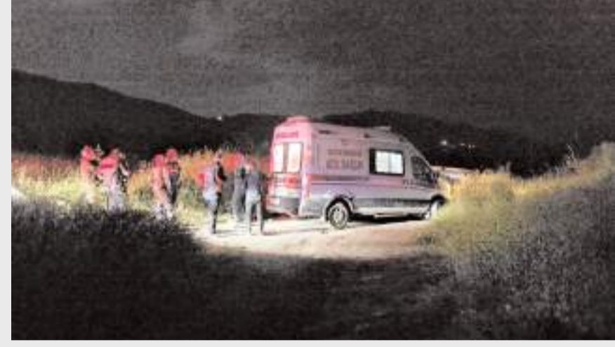
Arama kurtarma çalışmalarına jandarma, AFAD ve UMKE ekipleri katıldı.