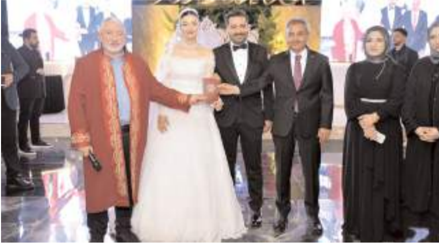
Genç çifte evlilik cüzdanlarını Belediye Başkanı Halil İbrahim Aşgın ile önceki dönem Çorum Belediye Başkanı Muzaffer Kültü verdi.