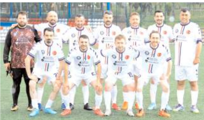
Ata-Ser Yapı turnuvada ikinci maçında bugün CNR Elektrik ile karşılaşacak

Günün ikinci maçında ise ilk haftayı üç puanla kapatan CNR Elektrik ile ilk maçından 1-1 beraberlik ve bir puanla aydılar Ata-Ser Yapı arasında. Saat 20'de başlayacak maçta iki takımda kazanarak iddialarını devam ettirmek amacıyla.