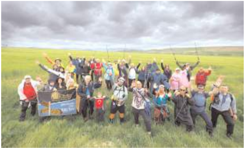
Yürüyüş toplam 46 km sürdü.