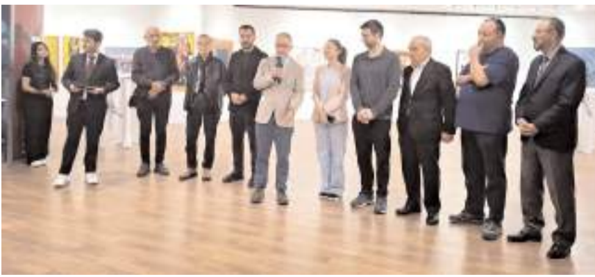
Sergi Gelişim Sanat Galerisi'nde açıldı.