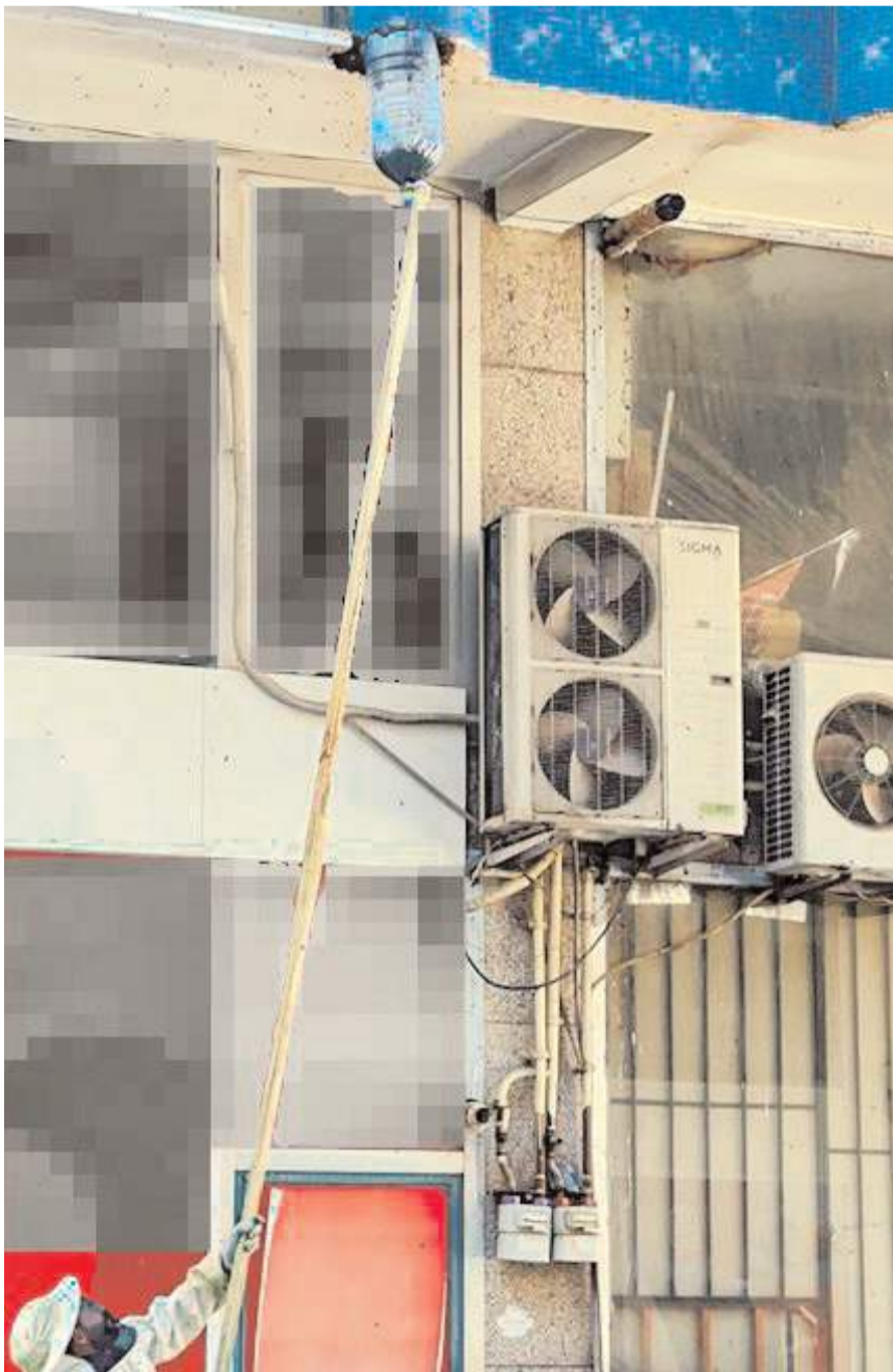
Arılar yuvadan alınarak daha güvenli bir yere götürüldü.