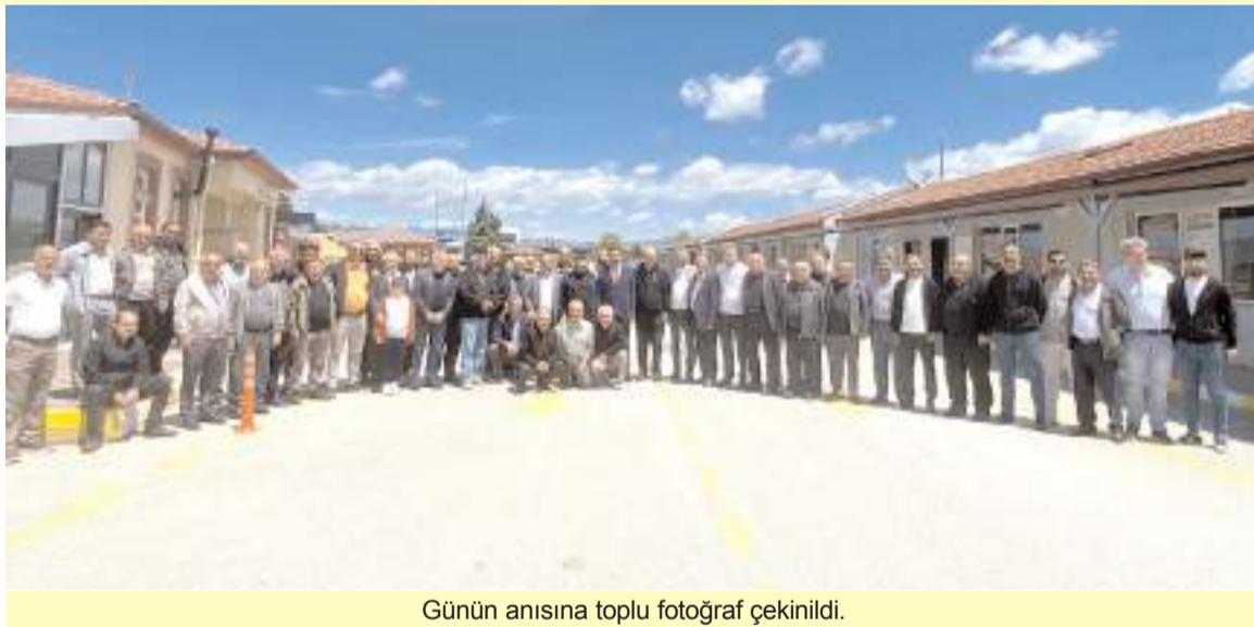
Günün anısına toplu fotoğraf çekildi.