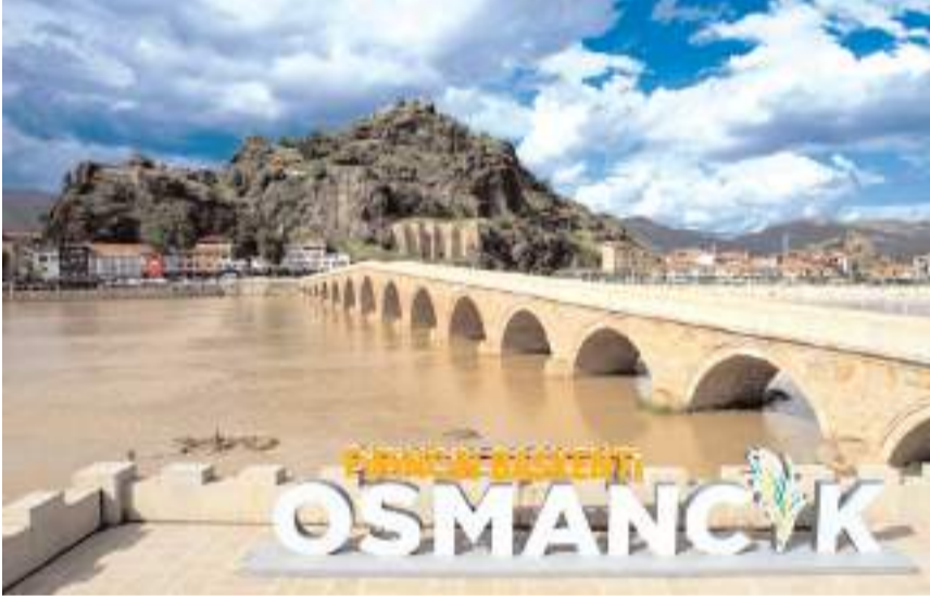
Kızılırmak Nehri'nin rengi kahverengiye döndü.

Osmanlı'daki tarihi Koyunbaba Köprüsü ve Kandiber Kalesi ile birlikte görüntülenen nehir, dronla havadan kaydedildi.(AA)