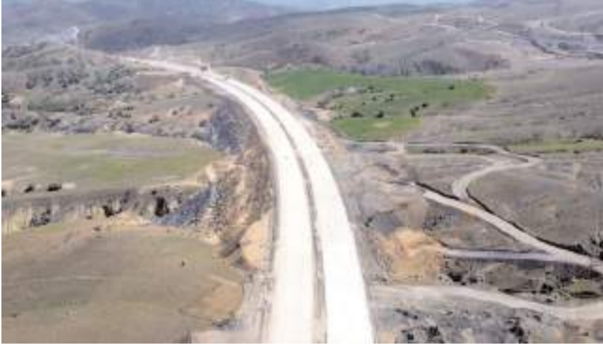
120 kilometre olarak projelendirilen otoyolun 101 kilometresinin ana gövde, 19 kilometresinin ise bağlantı yollarından oluşuyor.

Ulaştırma ve Alt yapı Bakanı Abdulkadir Uraloğlu, Ankara-Kırıkkale-Delice Otoyolu Projesi'nde çalışmaların yoğun şekilde sürdüğünü belirterek, projenin Kafkasya ve Orta Doğu'ya ulaşımı güçlendireceğini bildirdi.