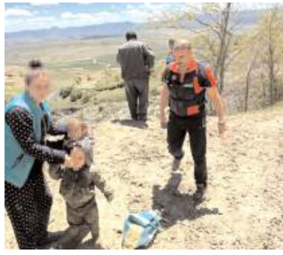
AFAD ekipleri çocukları çamura saplanmış halde buldular.