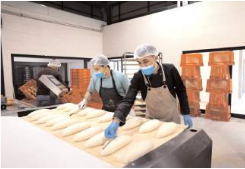
Tesis günlük 40 bin ekmeği üretim kapasitesine sahip.