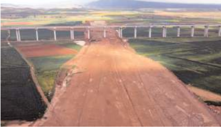
Projede çalışmalar hızla devam ediyor.