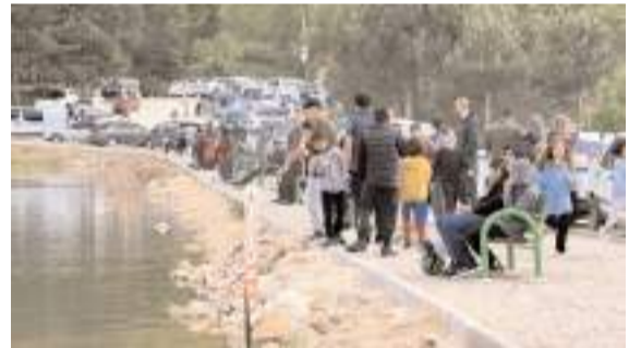
Yeşil Göl Mesire Alanı, hafta sonu çok sayıda ziyaretçiyi ağırladı.