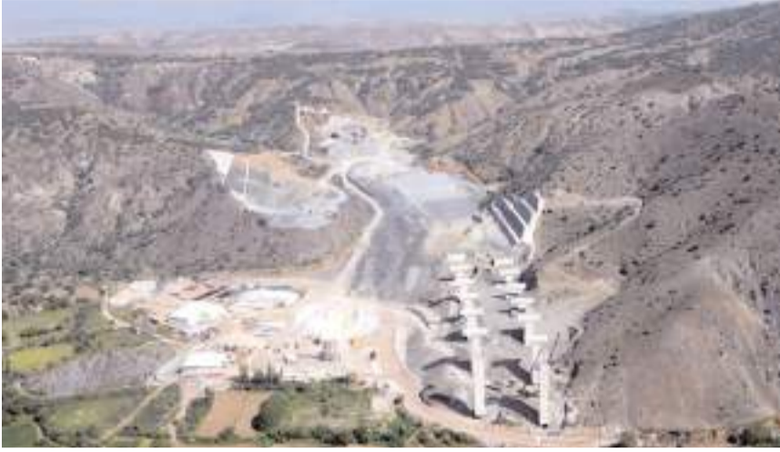
Proje 42 ili birbirine bağlayacak.