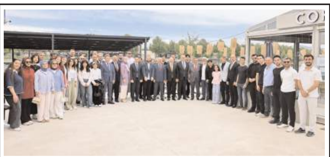
Programın ardından hatıra fotoğrafı çekildi.

HAKİMİYET, merhuma Allah'tan rahmet, ailesi, yakınları ve sevenlerine başsağlığı diler. (Haber Merkezi)