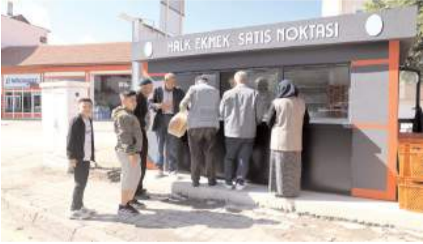
Vatandaşların halk ekmeği ürünlerine ilgisi yüksek oldu.

Sungurlu Belediyesi tarafından kurulan Şehit Süleyman Özmen Halk Ekmeği Fabrikası üretime başladı.