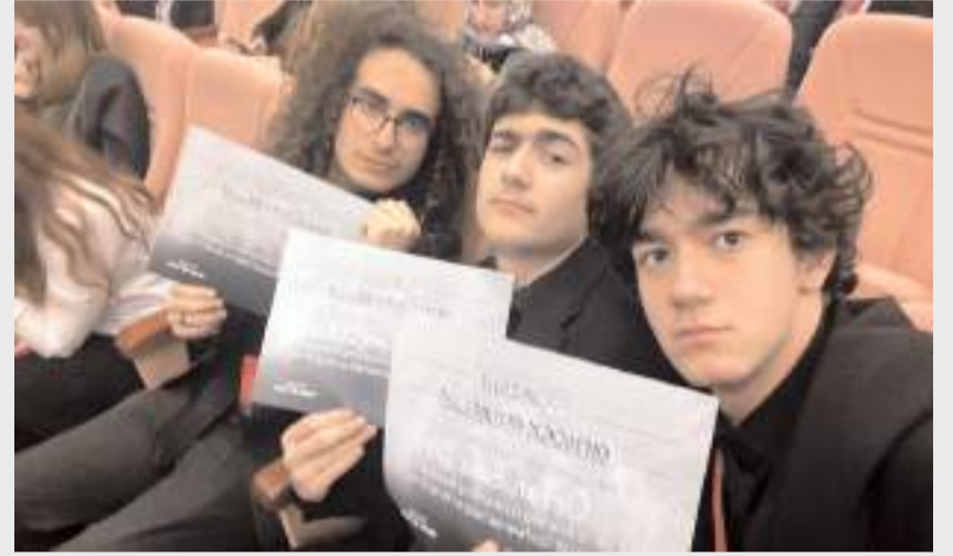
Yarışmada dört öğrenci ödül kazandı.

Türkiye'nin dört bir yanından gelen en tecrübeli okulları geride bırakan Mehmetçik Anadolu Lisesinin 6 kişilik ekibi, turnuvada 4 büyük ödül birden kazanarak Çorum'un gururu oldu.