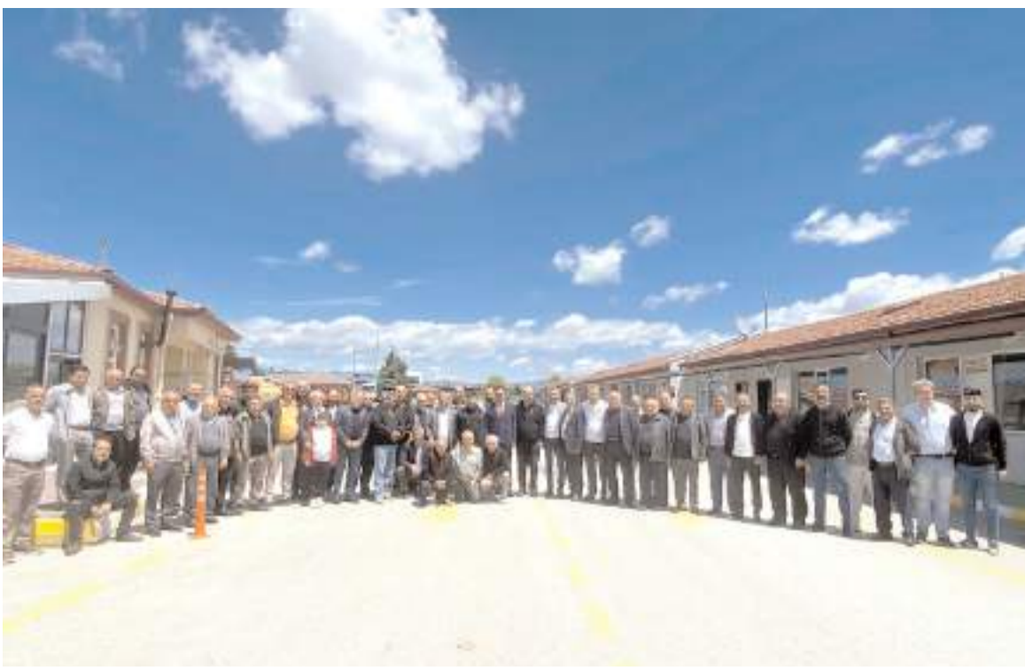
Günün anısına toplu fotoğraf çekildi.