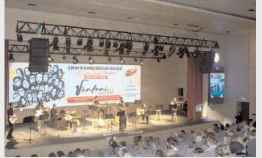
Programda öğrencilerden oluşan gruplar birbirinden güzel eserleri seslendirdiler.

Programın sonunda, orkestrada görev alan, bu yıl mezun olacak son sınıf öğrencilerine ve programı organize eden müzik ve resim öğretmenlerine günün anısına çeşitli ödülleri ve çiçek verildi.