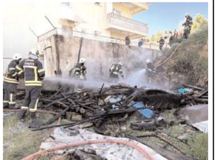
Yangın çevre binalara sıçramadan söndürüldü.