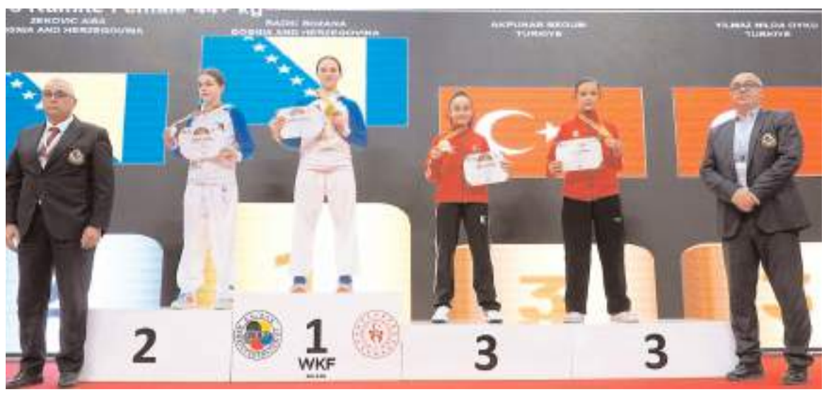
Balkan Şampiyonasında Çorum Belediyespor'un milli sporcusu ödül töreninde kürsüde diğer rakipleri ile birlikte