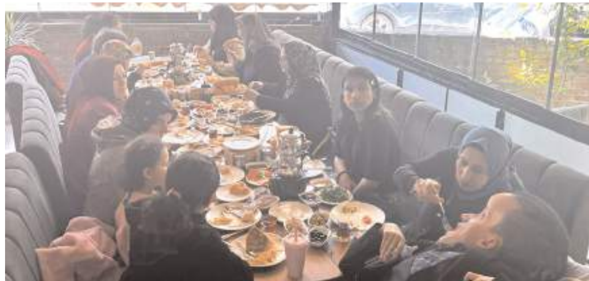
Bayramlaşmaya partililer katıldı.