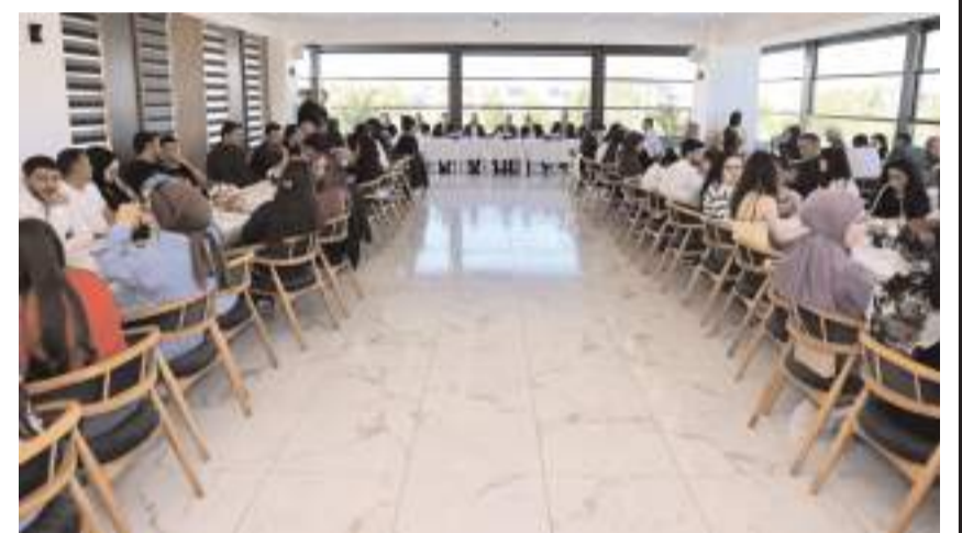
Kahvaltıya çok sayıda davetli katıldı.