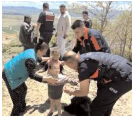
Çocukların sağlık durumlarının iyi olduğu belirtildi.