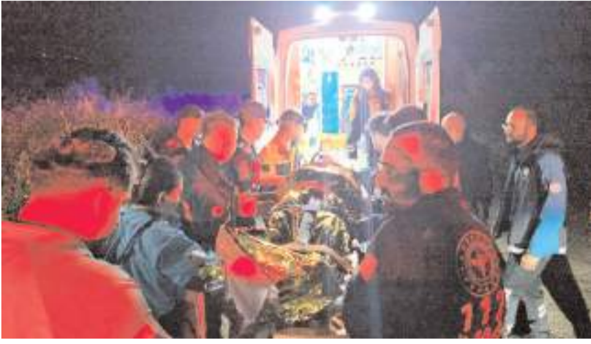
R.A'ya ilk müdahale olay yerinde yapıldı.

■ Çorum'da yamaç paraşütü yapan sağlık personeli, paraşütünün dolaşması sonucu düştüğü dere yatağından 5 saat sonra kurtarıldı.