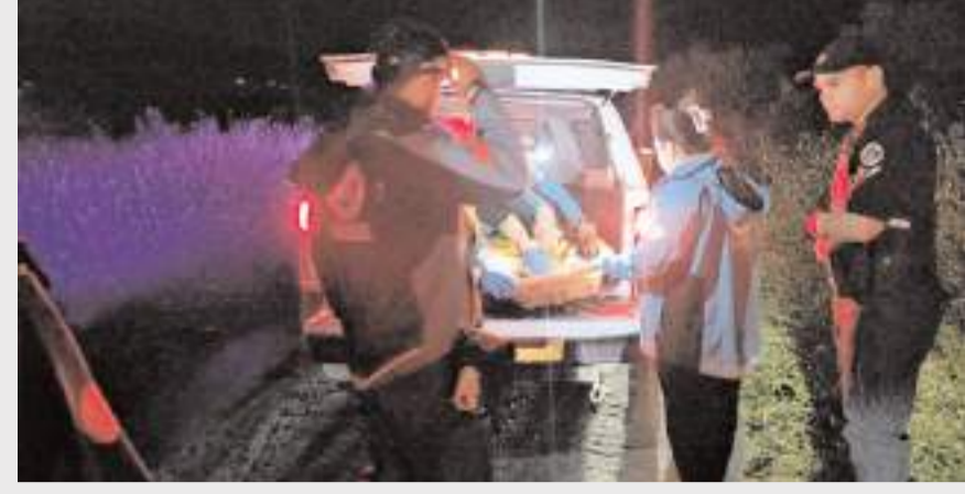
Kurtarma çalışması Çalyayla köyü Koparan ceviz mevkisindeki dere yatağında yapıldı.