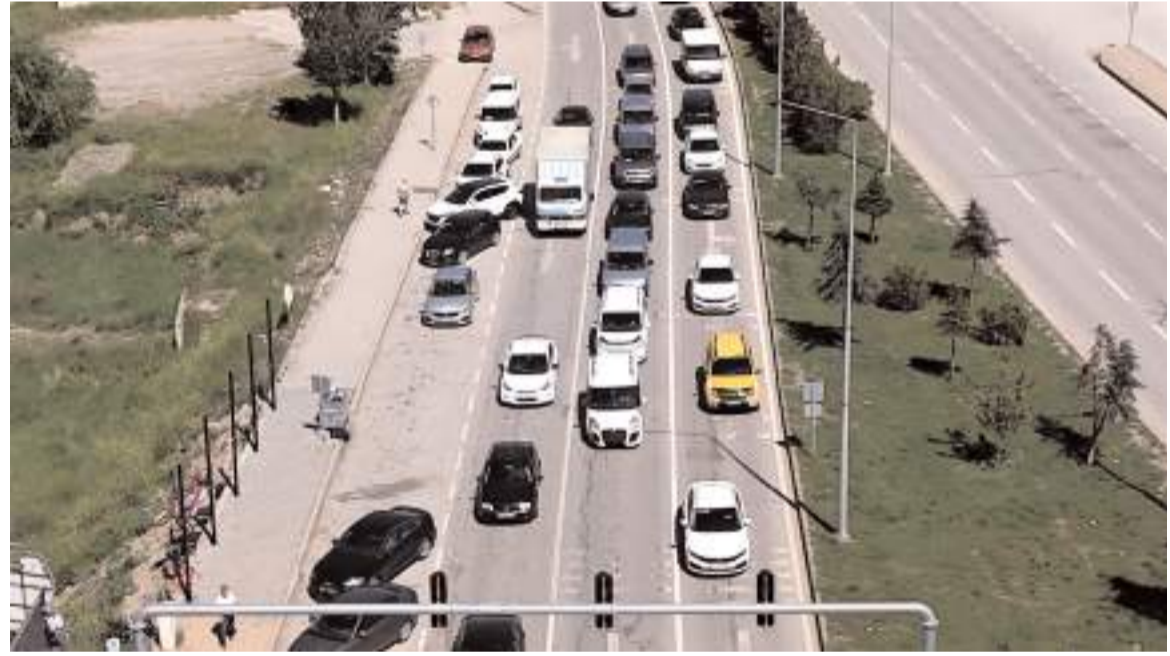
D190 Karayolu'nda yeşil ışık sürelerinin uzatılması trafik akışını büyük ölçüde rahatlatmıştı.