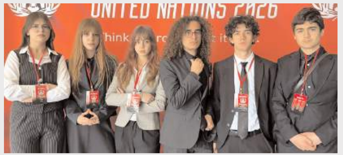
Yarışmaya katılan Mehmetçik Anadolu Lisesi ekibi.