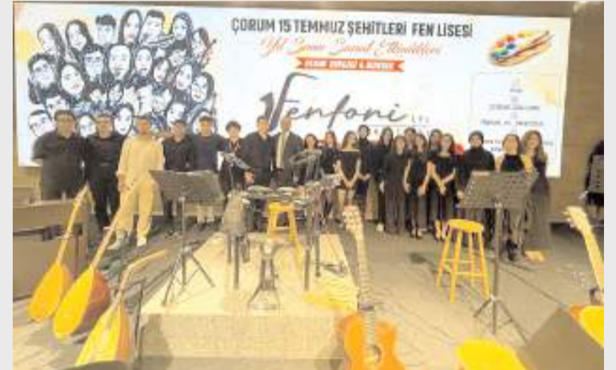
Program Çorum Ticaret ve Sanayi Odası Konferans Salonunda gerçekleştirildi.