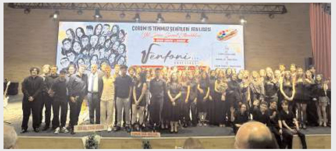
Günün anısına toplu fotoğraf çekildi.