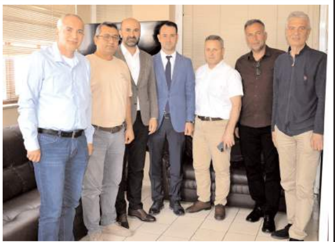
Ziyaretin sonunda hatıra fotoğrafı çekildi.