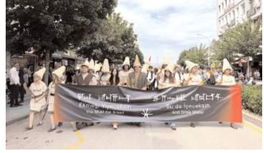
Saat Kulesinde başlayan yürüyüş Bedesten'de sona erdi.