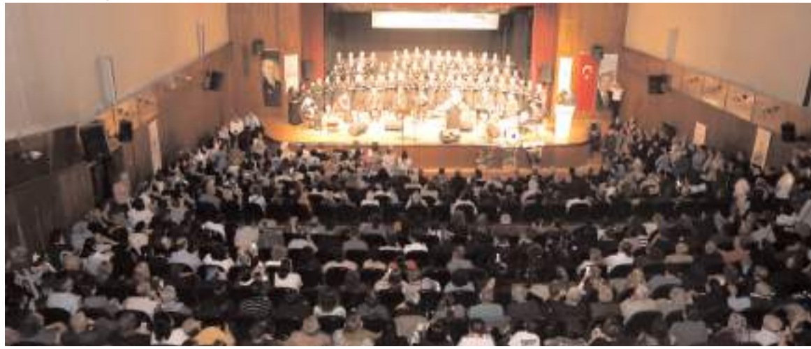
Her iki koroda konserde birbirinden güzel eserleri seslendirdi.