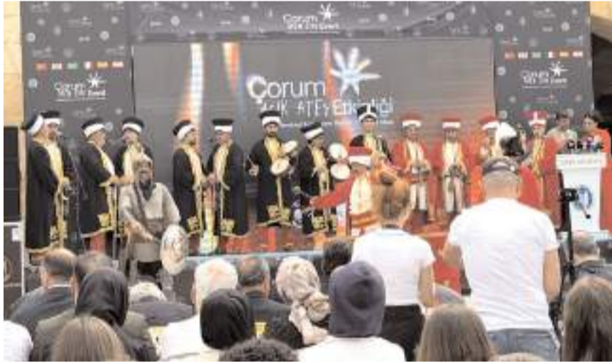
Çorum Belediyesi mehteran takımı gösteri yaptı.