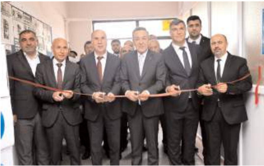
Açılış kurdelesini protokol üyeleri kesti.