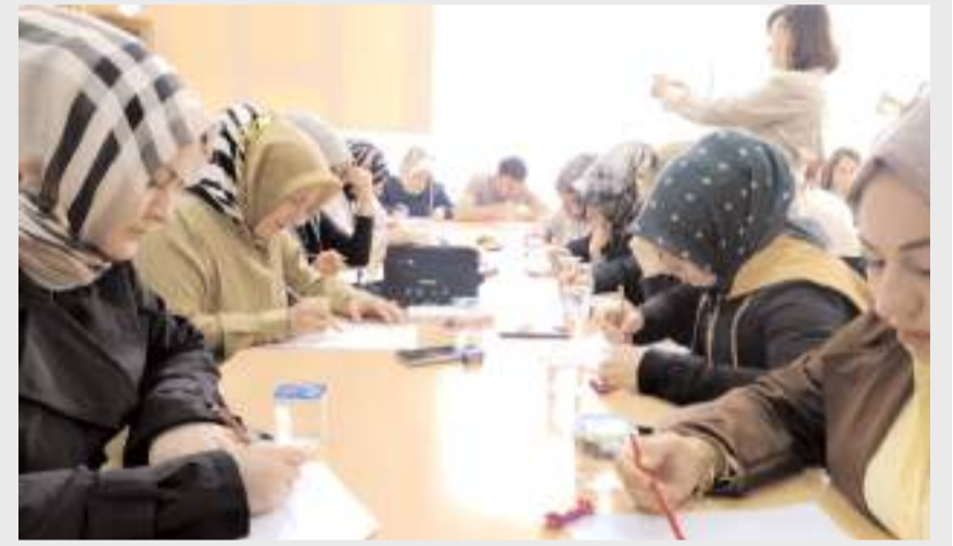
"Velilerle Kitap Okuma Sınavı" etkinliği gerçekleştirildi.

Çorum'da 75. Yıl Cumhuriyet İlkokulu tarafından yürütülen 'Geleceğin Tohumları' eT-winning projesi kapsamında "Velilerle Kitap Okuma Sınavı" etkinliği gerçekleştirildi. Öğrencilerin eğitim yolculuğundaki en önemli paydaşları olan veliler, bu kez sınav heyecanını kendileri yaşadı. "Okuyan aile, öğrenen toplum" sloganı ile hayata geçirilen proje kapsamında veliler, kendileri için belirlenen "Sevmek Yetmez" adlı kitabı okuyarak okulda düzenlenen sınava katıldı. Farkındalık oluşturmak amacıyla gerçekleştirilen etkinlikte anne ve babalar hem nitelikli bir eserle buluşma imkanı yakaladı hem de çocuklarının sınav sürecini ve stresini yakından tecrübe etti. Etkinliğin ardından ailelere teşekkür belgesi takdim edildi.(İHA)