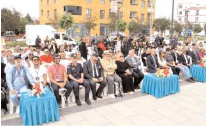
Açık Ateş Gastronomi Etkinliklerinin açılış töreni Bedesten'de yapıldı.