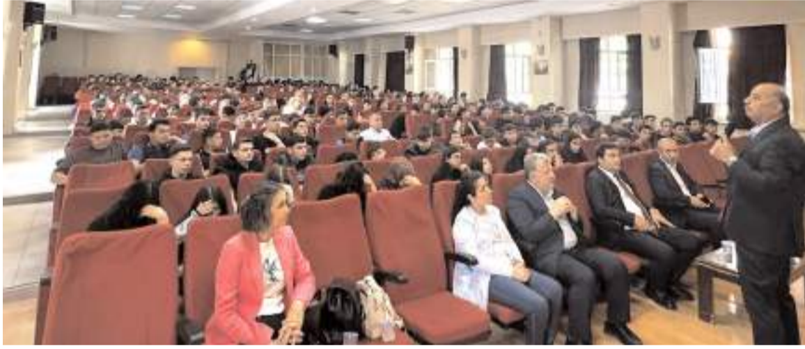
Seminer İl Millî Eğitim Müdürlüğü tarafından düzenlendi.