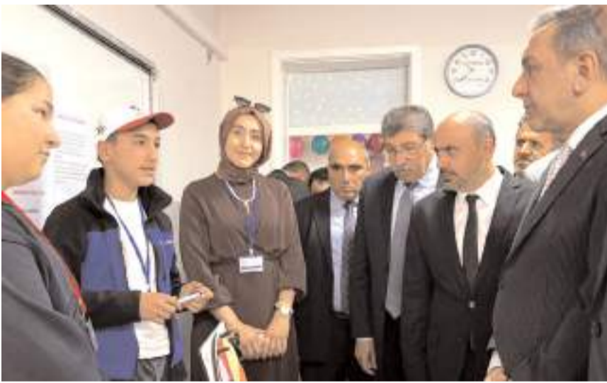
Protokol üyeleri stantları gezerek projeler hakkında bilgi aldılar.