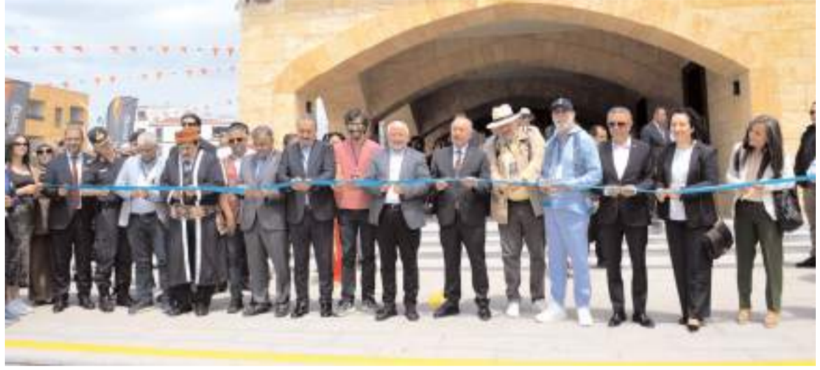
Törende "İlkerin Coğrafyası" konulu resim sergisi açıldı.

Ayrıca Bedesten'de, açık ateş pişirme teknikleri, şefler ile yerel ustaların birlikte gerçekleştirdiği workshoplar yapıldı. Burada Çorum'un yöresel yemekleri tanıtıldı.