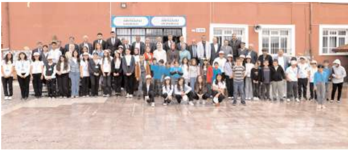
Programın sonunda günün anısına toplu fotoğraf çekildi.