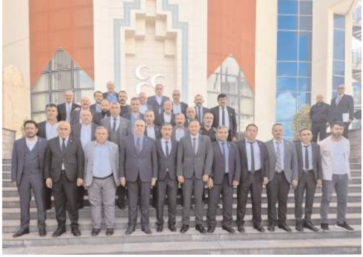
MHP Genel Merkezi önünde hatıra fotoğrafı çekildi.

karşısında çiftçilerin daha yüksek bir fiyat beklentisi içerisinde olduğunu belirterek, üreticilerin taleplerinin ve yaşadığı sıkıntıları aktardıklarını ifade etti.