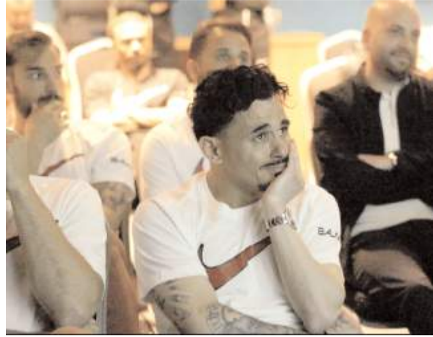
Ailelerinden gelen mesajları dinleyen futbolcular göz yaşlarına hakim olamadılar