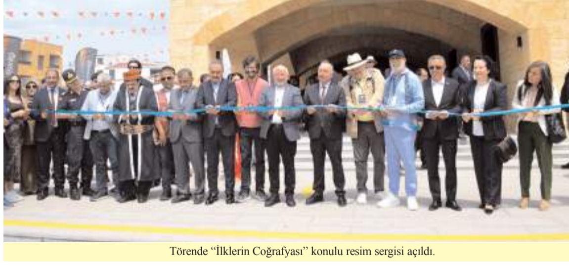
Törende "İlklerin Coğrafyası" konulu resim sergisi açıldı.

■ UNESCO Yaratıcı Şehirler Ağı'na (UCCN) gastronomi alanında dahil olmak için Çorum Belediyesi tarafından başlatılan çalışmalar kapsamında organize edilen Açık Ateş Gastronomi Etkinlikleri için Bedesten'de açılış programı yapıldı. * HABERİ6'DA