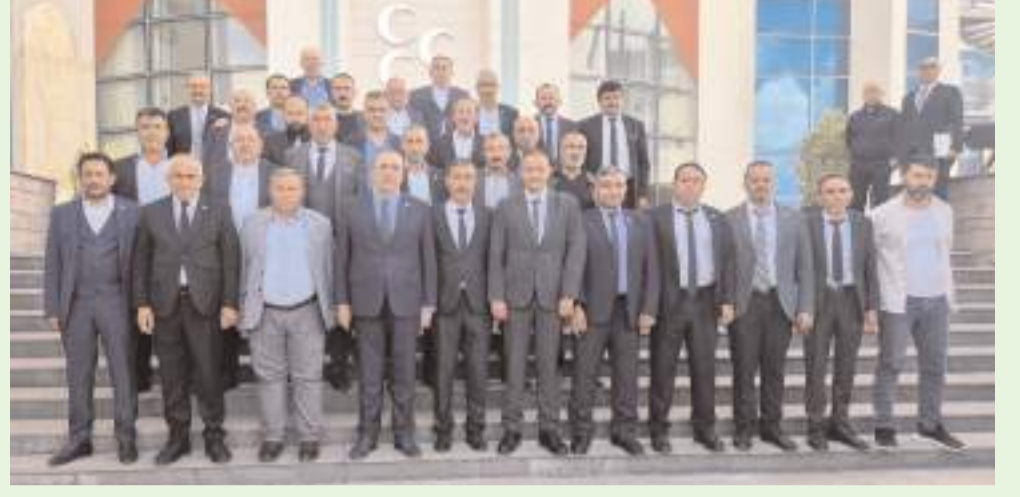
MHP Genel Merkezi önünde hatıra fotoğrafı çekildi.