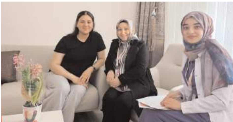
Koordinatör ebeler ve halk sağlığı uzmanları anne adaylarını evlerinde ziyaret ediyorlar.

Yürütülen çalışmalarla, anne adaylarının fiziksel, ruhsal ve sosyal açıdan doğuma bilinçli şekilde hazırlanması hedefleniyor. (Haber Merkezi)