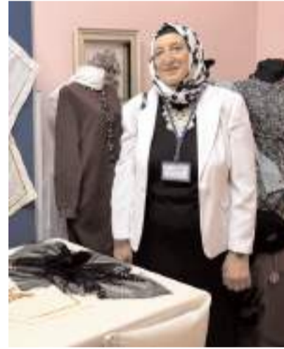
Kursiyerler ürünleri hakkında bilgi verdiler.

Çorum'un Alaca ilçesinde, Hayat Boyu Öğrenme Haftası etkinlikleri kapsamında karma sergi düzenlendi.