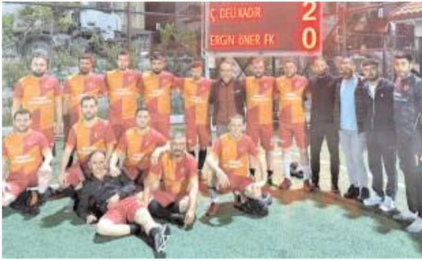
Çoprasıklı Deli Kadirspor ikinci maçında üç puan alarak iddiasını devam ettirdi