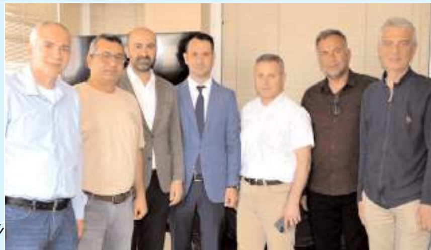
Ziyaretin sonunda hatıra fotoğrafı çekildi.