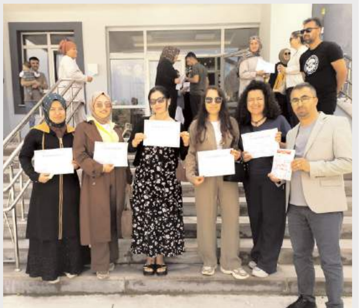
Velilere teşekkür belgesi takdim edildi.