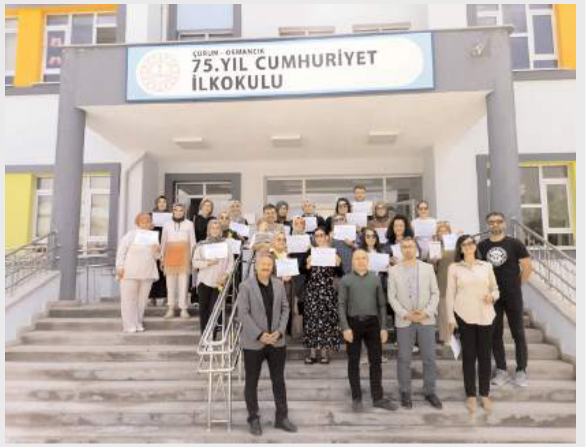
Etkinlik 75. Yıl Cumhuriyet İlkokulunda yapıldı.

Türk Medeni Kanunu'nun "yoksulluk nafakası" başlıklı 175. maddesi, "Boşanma yüzünden yoksulluğa düşecek taraf, kusuru daha ağır olmamak koşuluyla geçimi için diğer taraftan mali gücü oranında süresiz olarak nafaka isteyebilir. Nafaka yükümlüsünün kusuru aranmaz" hükmünü içeriyor. (AA)