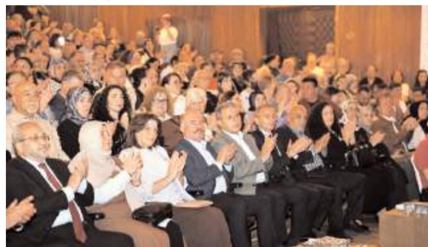
Konserde ilgi yüksek oldu.