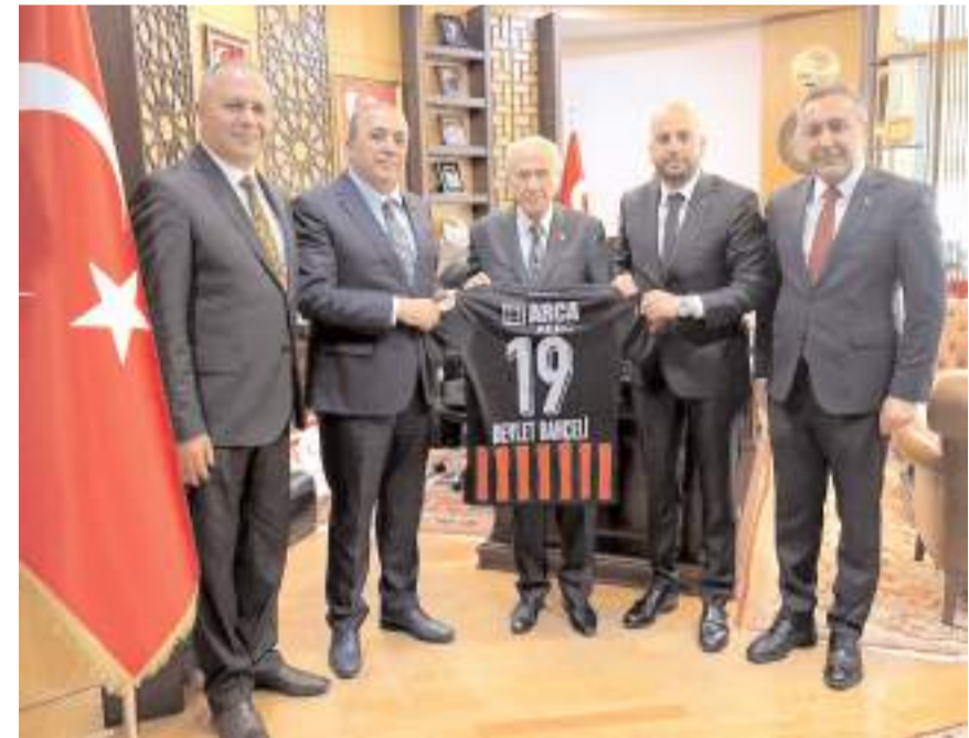
MHP Genel Başkanı Devlet Bahçeli'ye Arca Çorum FK forması hediye edildi

Öğretmen Mukadder Akayın İlkokulu, Kargı, Bahçelievler, Hürriyet, Yavuz Sultan Selim İlkokulu, Sakarya İlkokulu, Yahya Kemal Bayatlı, Mehmet Akif Ersoy, Ertuğrul Gazi, Alaca Cumhuriyet, Atatürk, Fatih Sultan Mehmet, Yunus Emre İlkokulu, osmançık, İstiklal İlkokulu, Ubeydi Gazi, Adnan Mendereb, İsmail Kakaç, Ziya Gökalp, Dumlupınar, Yumurta, 80. Yıl Cumhuriyet, Albayrak, Şehit Onur Bakbak, 169 Mayıs ve Başöğretmen Atatürk İlkokulları.