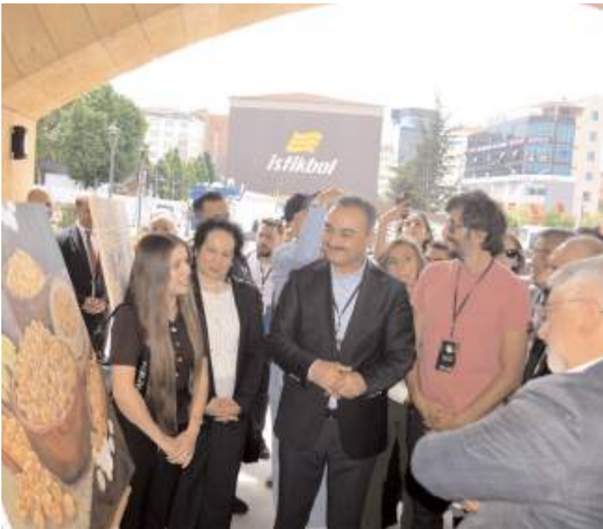
Davetliler resim sergisini gezerek eserler hakkında bilgi aldılar.