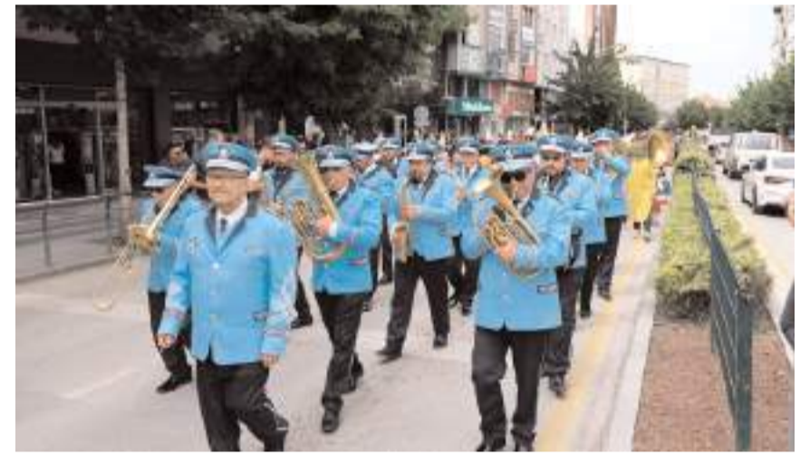
Yürüyüş Çorum Belediyesi Bandosu eşliğinde yapıldı.

Etkinliklerin ikinci ve üçüncü günü, görselliği ile dikkat çeken lezzet şölenlerine dönüşecek.