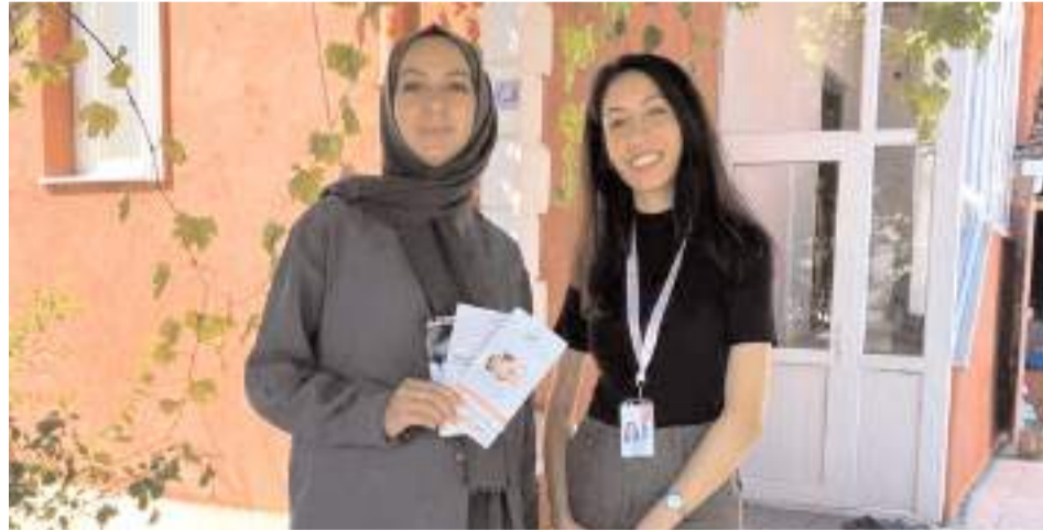
Anne ve bebek sağlığının korunmasına yönelik bilgilendirme ve danışmanlık hizmeti verildi.