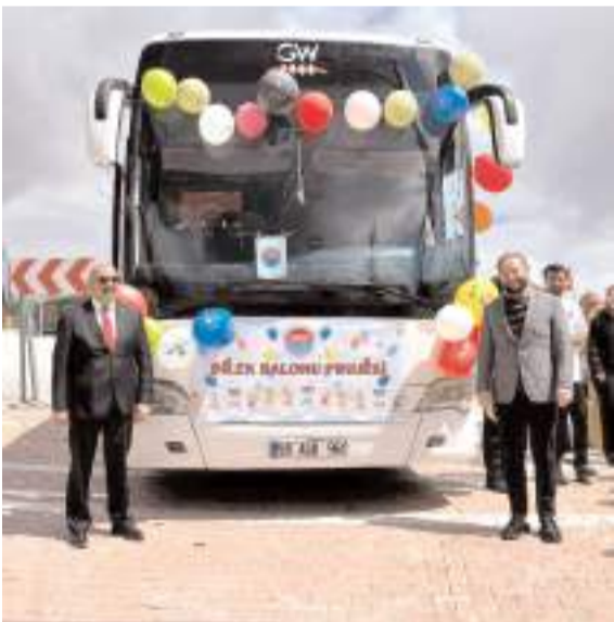
Proje kapsamında 106 öğrencinin hayalleri gerçeğe dönüştürüldü.