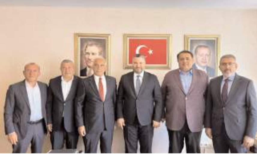
Milletvekili Av. Oğuzhan Kaya ve İskilip Belediye Başkanı İsmail Çizikçi başkanlığındaki heyeti, Sanayi ve Teknoloji Bakan Yardımcısı Oruç Baba İnan'ı makamında ziyaret etti.