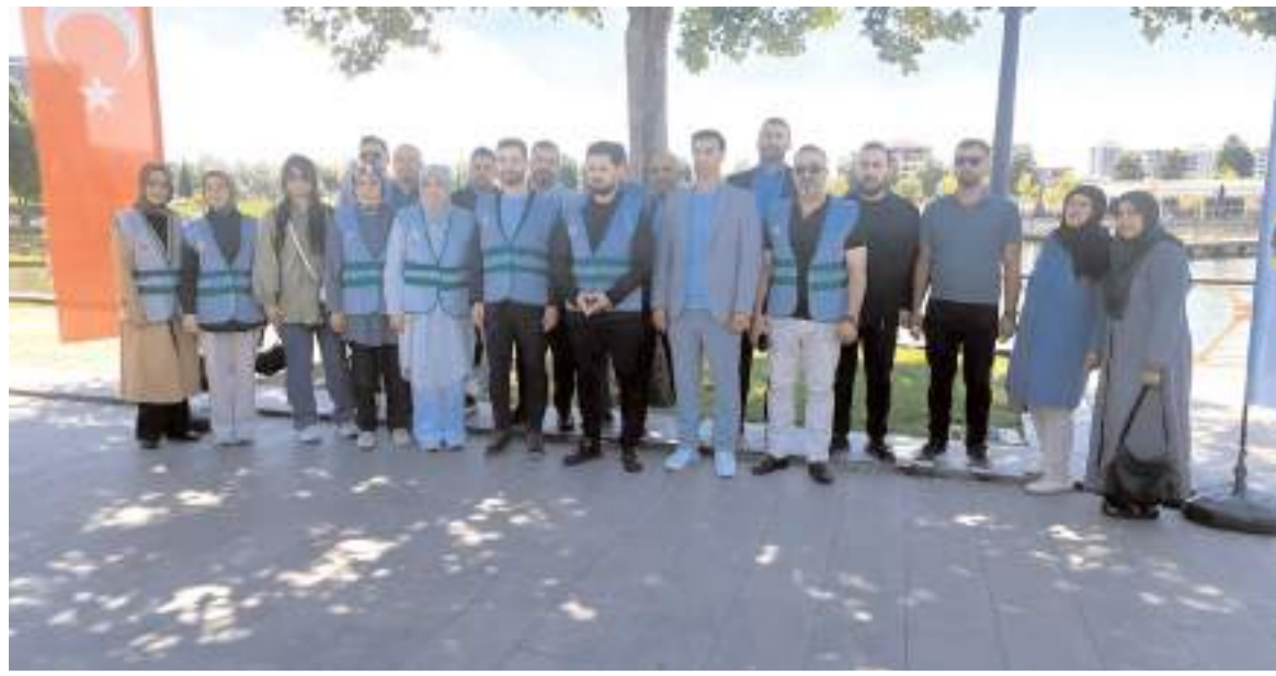
Basın açıklamasına partilerde katıldı.