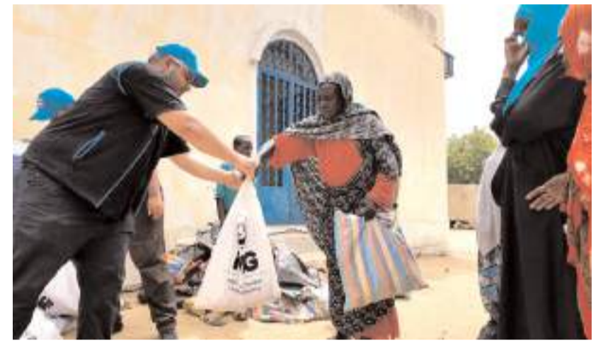
Kurbanlar İslami usullere uygun şekilde kesilerek ihtiyaç sahiplerine ulaştırıldı.

Ziyaret edilen ülkelerde ülkemizi temsil eden büyükelçilik ve konsoloslukların yanı sıra TİKA, Türkiye Maarif Vakfı ve Yunus Emre Enstitüsü gibi kurumlarla da görüşmeler gerçekleştirildi. Yapılan temaslarda hem mevcut çalışmalar değerlendirildi hem de gelecekte gerçekleştirilebilecek ortak projeler üzerine istişarelerde bulunuldu.