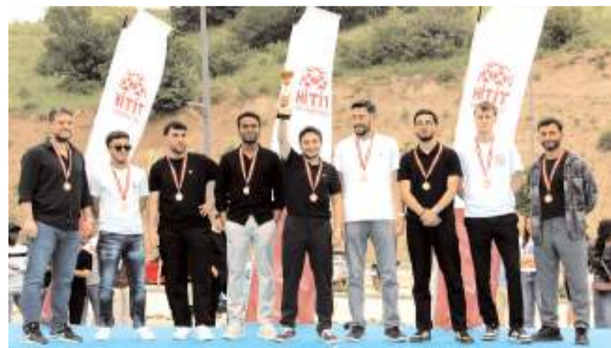
Yarışmalarda dereceye girmeyi başaran öğrenci ve takımlara ödülleri takdim edildi.