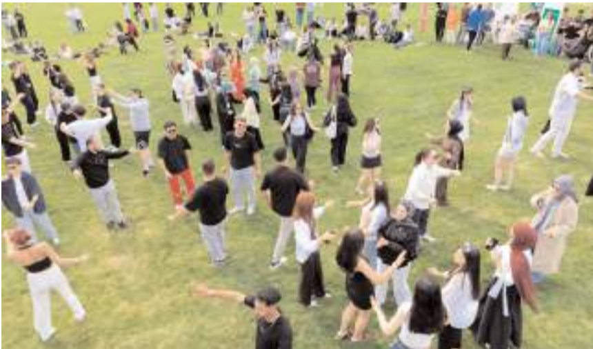
Öğrenciler gönüllü olarak eğlendiler.