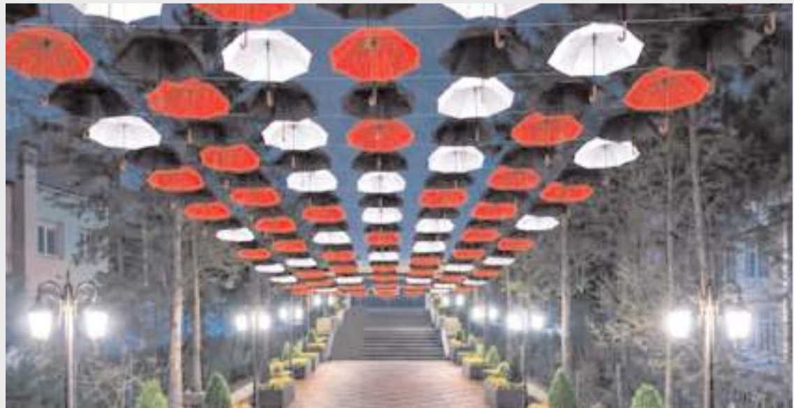
Sungurlu'da yapılacak olan sokakta Çorum FK ve Sungurlu Belediyespor renkleri hakim olacak