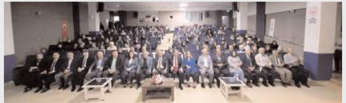
Program Çorum Belediyesi Buhara Kültür Merkezinde yapıldı.