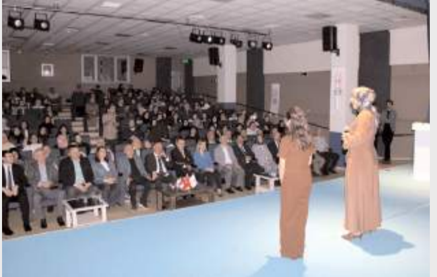
Çocuklar "Yedi Güzel Adam" şairlerinin şiirlerini okudu.