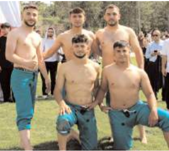
Çeşitli sportif müsabakalar yapıldı.

ketbol, atletizm gibi çeşitli kategorilerde dereceye girmeyi başaran öğrenci ve takımlara ödülleri takdim edildi. Üniversite öğrencilerinin doyasıyla eğlendiği ve spor müsabakalarında elde ettikleri başarıların ödüllendirildiği festival, fotoğraf çekimiyle devam etti.(İHA)