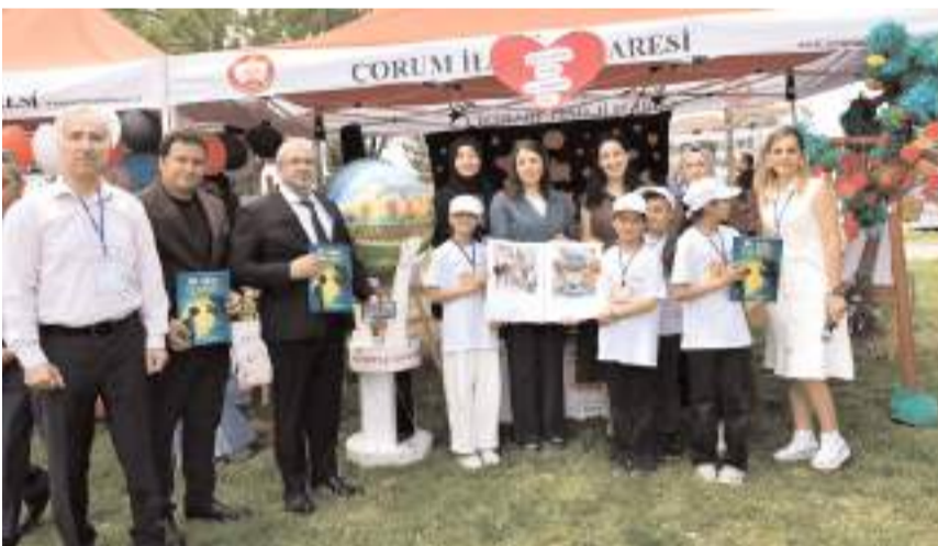
Şenlikte öğrenciler tarafından yapılan projeler sergilendi.