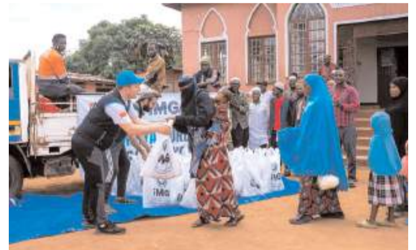
Kurbanlar İslami usullere uygun şekilde kesilerek ihtiyaç sahiplerine ulaştırıldı.

Bölge halkının samimiyeti, misafirperverliği ve yardım faaliyetlerine gösterdiği destek ekiplerimiz üzerinde derin izler bıraktı. Özellikle eğitim, yetim destekleri ve su kuyusu projelerine yönelik önemli görüşmeler gerçekleştirildi. Zambiya'da kurulan kardeşlik sofralarında kurban çocuklara ikram edilen Afyonkarahisar sucuğu ve ekmeği, hem çocukların neşesine vesile oldu hem de sosyal medyada büyük ilgi gördü. Farklı coğrafyalarda kurulan bu gönül köprüleri organizasyonun unutulmaz hatıraları arasında yer aldı. Yemen'in Hadramut ve Marib bölgelerinde gerçekleştirilen çalışmalar kapsamında kurban dağıtımlarının yanı sıra zekât yardımları, bayramlık kıyafetler, kırtasiye destekleri ve temiz su yardımları ulaştırıldı. Özellikle mülteci kamplarında yapılan ziyaretlerde bölgenin temel ihtiyaçları yerinde tespit edilerek uzun vadeli yardım projeleri için değerlendirmelerde bulunuldu.