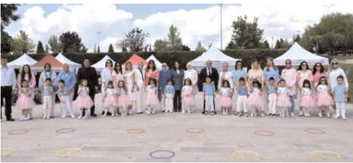
Programın sonunda hatıra fotoğrafı çekildi.