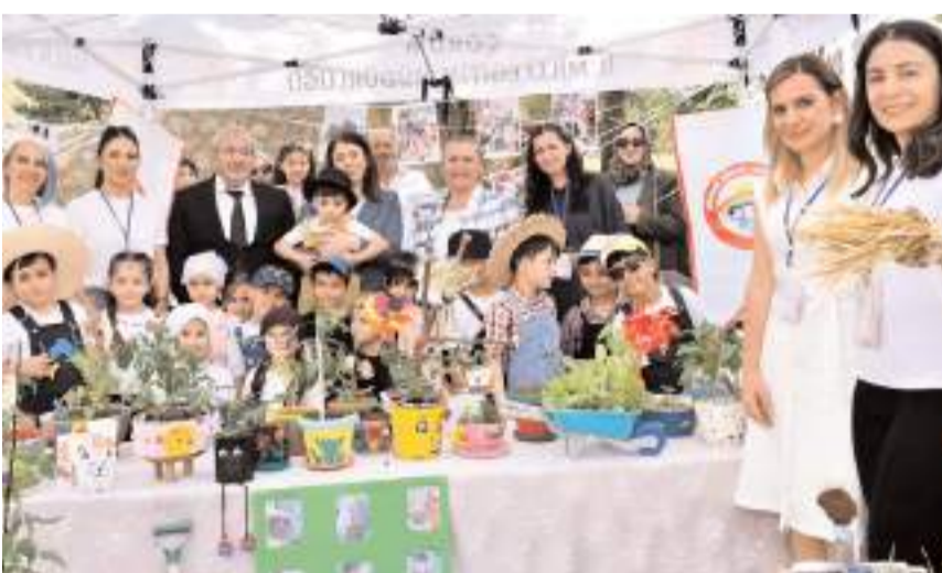
Sergilenen projelerle öğrenciler takım çalışması, eleştirel düşünme ve üretim becerilerini ortaya koydu.