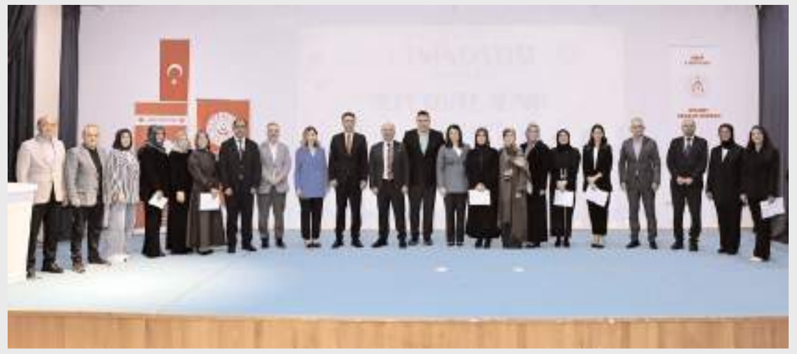
Projeye katkı sağlayan gönüllü gençlere, çocuklara ve personele katılım belgeleri verildi.