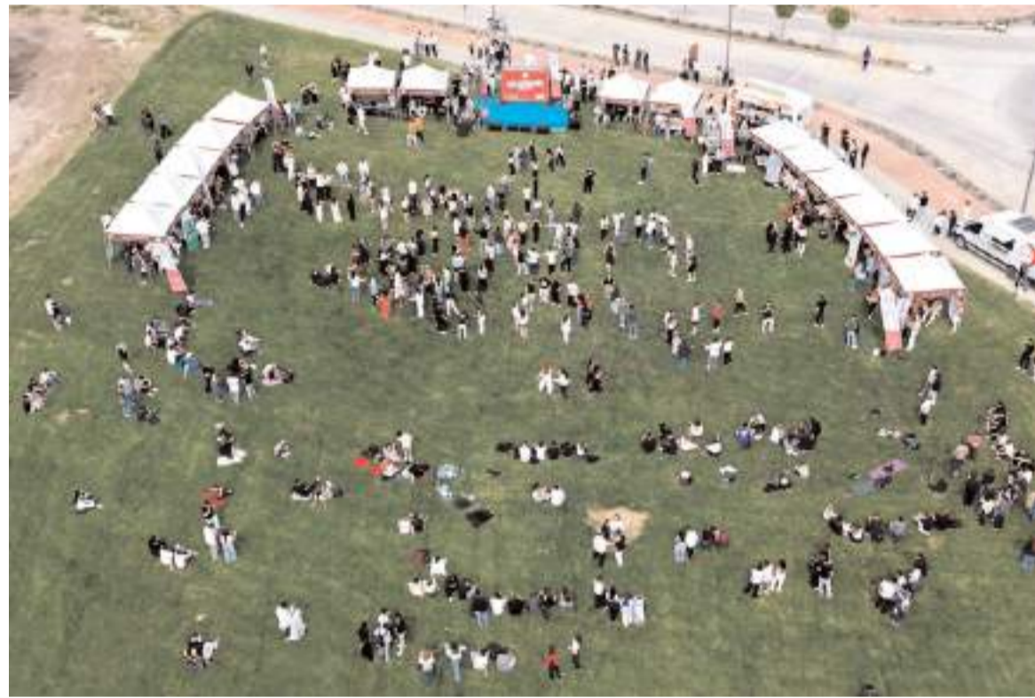
Etkinlikler Hitit Üniversitesi Kuzey Kampüsü Yeşil Meydan'da yapıldı.

Hitit Üniversitesi Sağlık, Kültür ve Spor Daire Başkanlığı tarafından düzenlenen Sağlık, Kültür ve Spor Fest '26, üniversite öğrencileri, akademisyenler ve idari personeli, eğlence, spor ve sosyal etkinliklerle dolu bir programda bir araya getirdi. Hitit Üniversitesi Kuzey Kampüsü Yeşil Meydan'da gerçekleştirilen festivalde, kamu kurumları ve öğrenci kulüpleri tarafından çalışmalarının anlatıldığı stanlar açıldı. Öğrenciler, yoğun ilgi gösterdikleri festivalde çeşitli sahne gösterileriyle do-