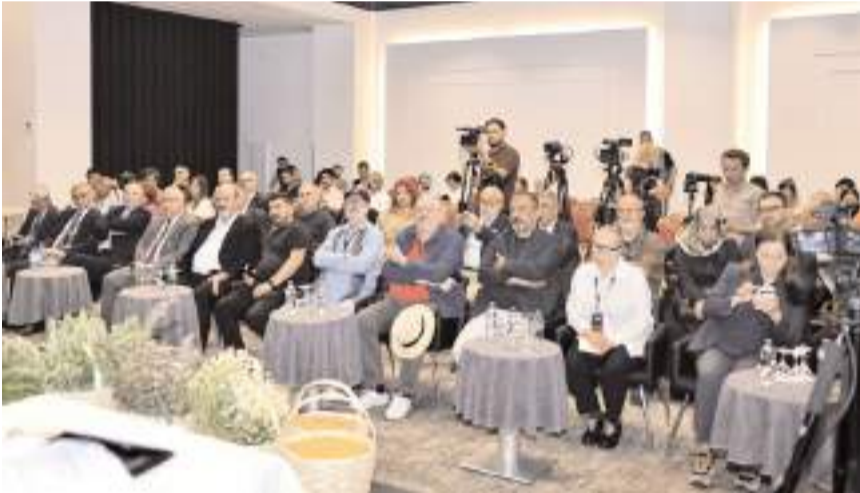
Söyleşi programı Anitta Otelde yapıldı.