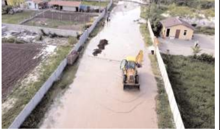
Sel nedeniyle bazı yollar kapandı.

açıldı. Selin etkili olduğu bölge ve ekiplerin çalışması havadan görüntü alındı.(İHA)