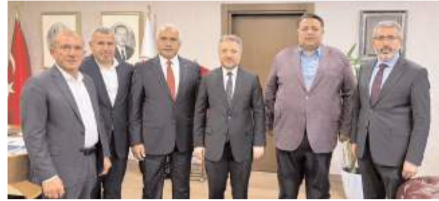
Milletvekili Av. Oğuzhan Kaya ve İskilip Belediye Başkanı İsmail Çizikci başkanlığındaki heyet, Sanayi ve Teknoloji Bakan Yardımcısı hemşehrimiz Zekeriya Coştu'yu makamında ziyaret etti.