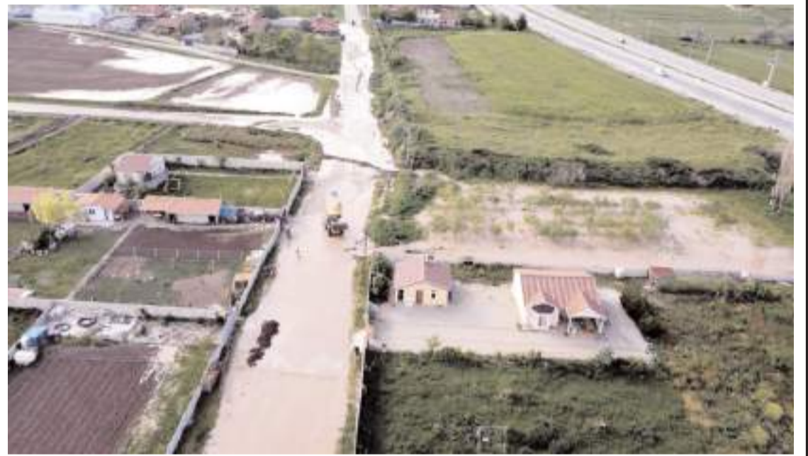
Ekipler yolda biriken suyu tahliye etmek için çalışma başlattı.