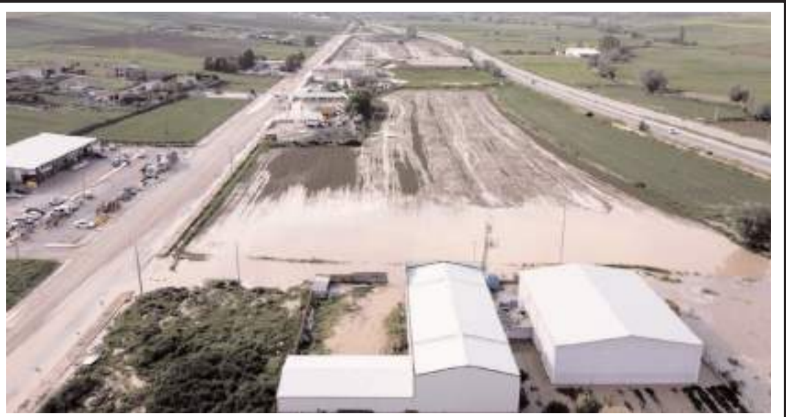
Alaca ilçesinde etkili olan sağanak yağışın ardından sel meydana geldi.

Satışa ilişkin detaylara, "www.toki.gov.tr" ile "muzayede.emlakyonetim.com.tr" internet adreslerinden ve "444 84 34" numaralı telefondan ulaşılabilecek.(AA)