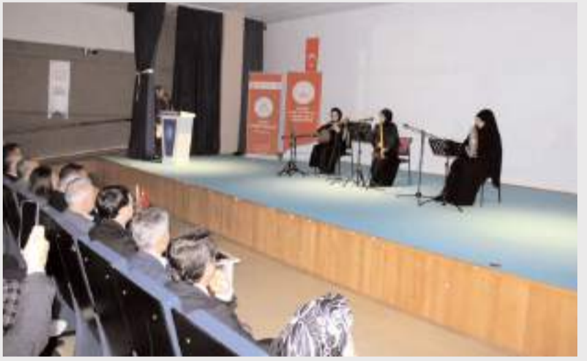
İlahiyat Fakültesi öğrencilerinden oluşan musiki grubu mini konser verdi.