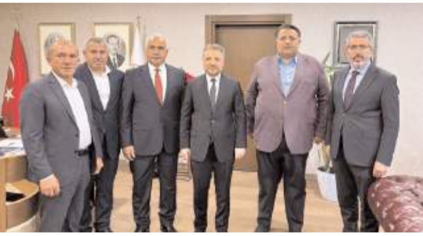
Milletvekili Av. Oğuzhan Kaya ve İskilip Belediye Başkanı İsmail Çizikçi başkanlığındaki heyet, Sanayi ve Teknoloji Bakan Yardımcısı hemşerimiz Zekeriya Coştu'yu makamında ziyaret etti.