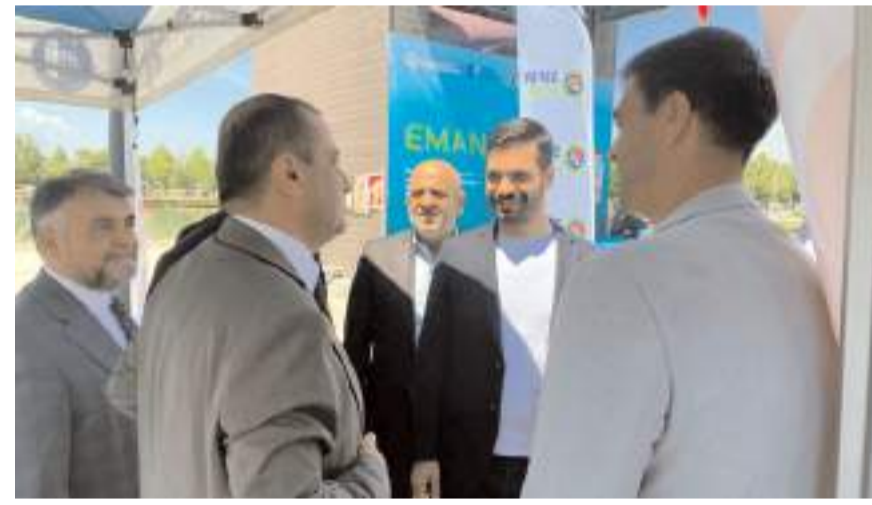
AK Partililer Çevre Şehircilik ve İklim Değişikliği İl Müdürlüğü tarafından Kentpark'ta yapılan Çevre Günü etkinliklerine katıldı.