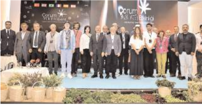
Açık Ateş Etkinlikleri kapsamında söyleşi programı yapıldı.