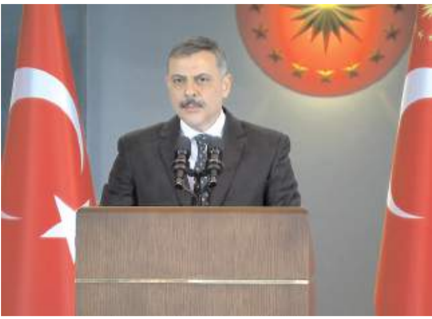
İçişleri Bakanı Mustafa Çiftçi

İçişleri Bakanı Mustafa Çiftçi, bugün Çorum'a gelecek. İçişleri Bakanı Mustafa Çiftçi bir dizi programa katılmak üzere bugün Çorum'a gelecek.