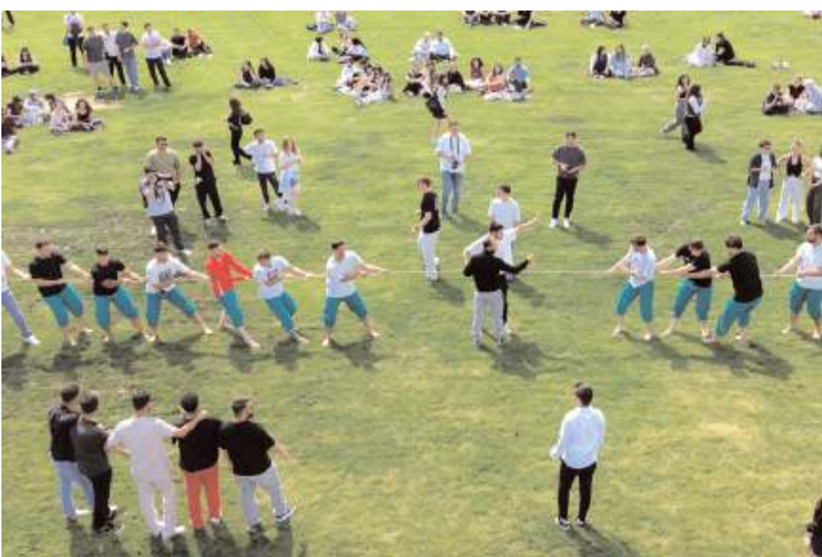
Festivalde geleneksel oyunlar ve yarışmalar renkli anlara sahne oldu.