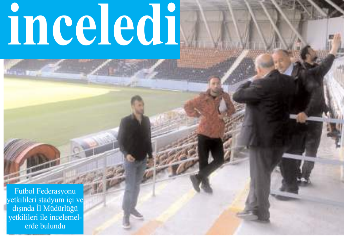
Futbol Federasyonu yetkilileri stadyum içi ve dışında İl Müdürlüğü yetkilileri ile incelemelerde bulundu