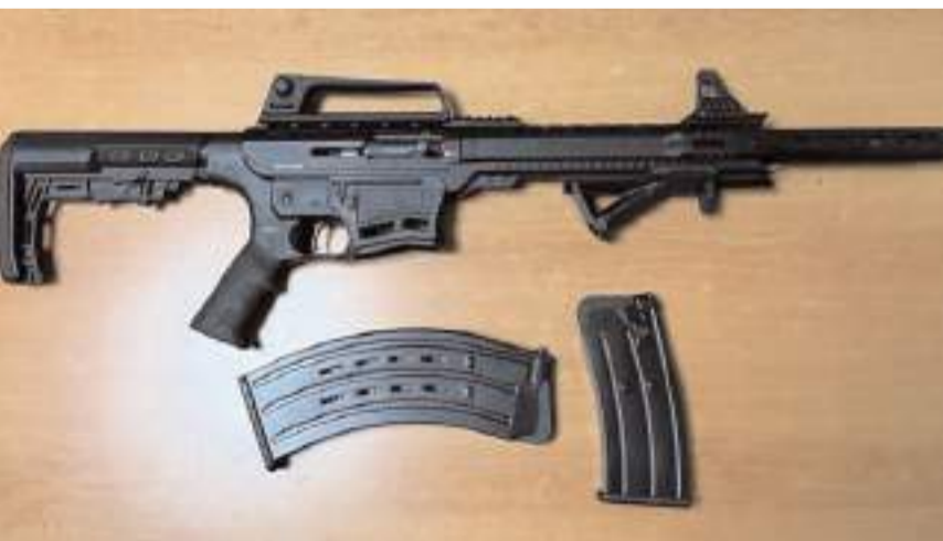
Operasyonlarda 3 tabanca, 3 av tüfeği ele geçirildi.

21 adet sentetik ecza, 30.00 gr sentetik kannobionoid ele geçirildi. Ayrıca 2 bin 387 araç kontrol edildi. (Haber Merkezi)