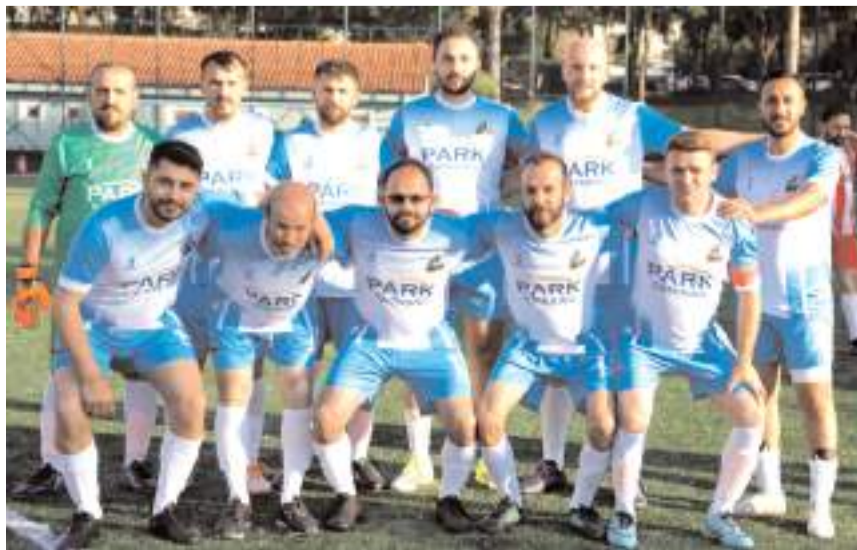
İki maçından puansız ayrılan Park Catering Düvenci üçüncü maçında sifhat yapmak istiyor

Yarın Mimar Sinan sahasında saat 17.30'da oynanacak ilk maçta ilk iki maçtan puansız ayrılan Vizyon Tarım ile 1 puanla Atasır Yapı takımları arasında oynanacak. Saat 19.00'daki maçta ise Bolat Harita ile Manchester Dil Okulları takımları mücadele edecekler. İlk iki maç öncesinde Bolat Harita takımı 3 puanla onuncu sırada yer alırken Manchester Dil Okulları ise aynı puanla yedinci sırada bulunuyor. Üçüncü haftanın son maçında ise 4 puanla dördüncü sırada bulunan Çopraşıklı Deli Kadir takımı ile puanı bulunmayan Park Catering Düvenci takımları puan mücadelesi verecekler,