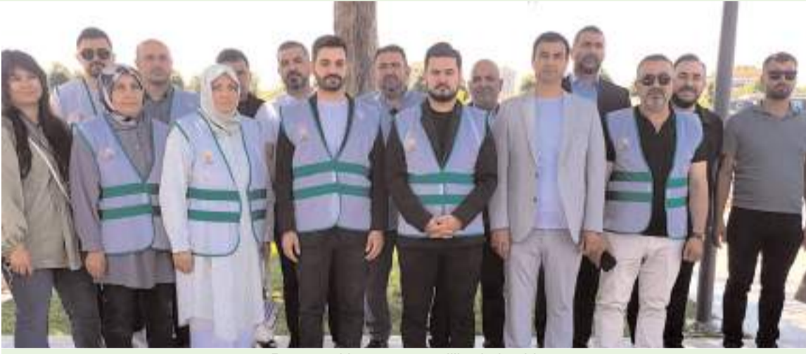
Basın açıklamasına partililerde katıldı.