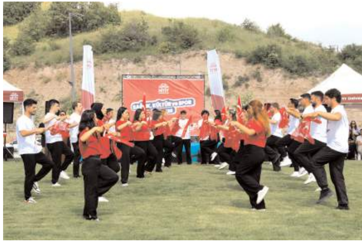
Festivali Hitit Üniversitesi Sağlık, Kültür ve Spor Daire Başkanlığı düzenledi.