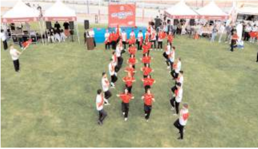
Öğrenciler tarafından dans gösterileri sahnelendi.