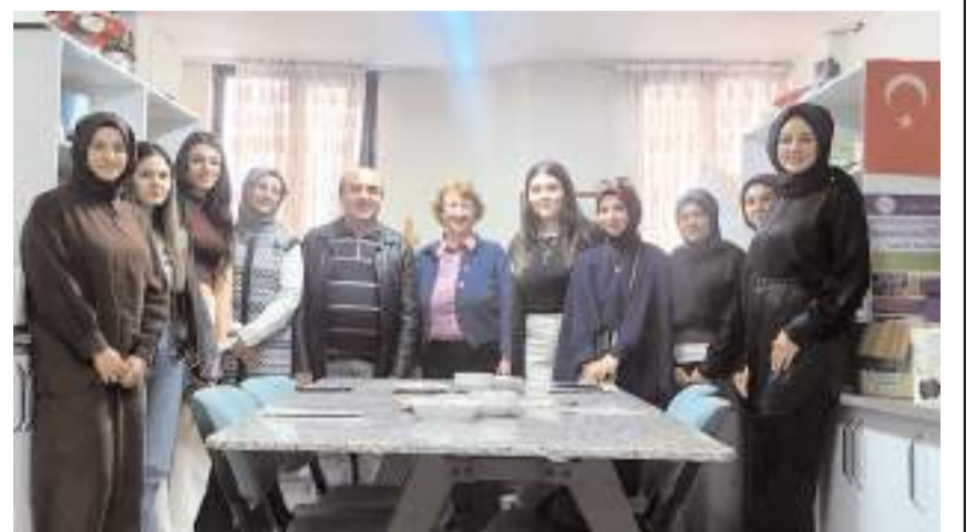
Öğrenciler ziyarette Çölyak Derneğinin faaliyetleri hakkında bilgi aldı.