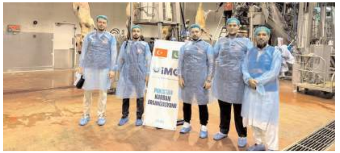
IMG, 2026 yılı Kurban Organizasyonu kapsamında Afrika, Asya, Türkiye, Güney Amerika ve Balkanlar'da çalışmalar yaptı.