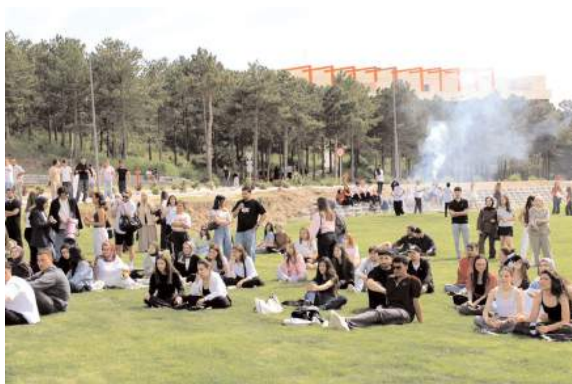
Öğrenciler yarışmaları büyük bir dikkatle izledi.