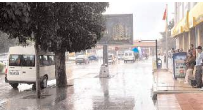
Sağanak yağışa hazırlıksız yakalanan vatandaşlar zor anlar yaşadı.

Çorum'da kuvvetli sağanak etkili. Aniden bastıran sağanak yağışa hazırlıksız yakalanan vatandaşlar, tente ve saçakların altına sığındı. Sağanak yağışlar sebebiyle bazı sokaklarda ise su birikintileri oluştu. Yağış kısa süre sonra sonra etkisini yitirdi. (İHA)