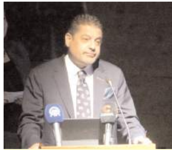
TÜRKNKFED Başkanı Süleyman Sönmez