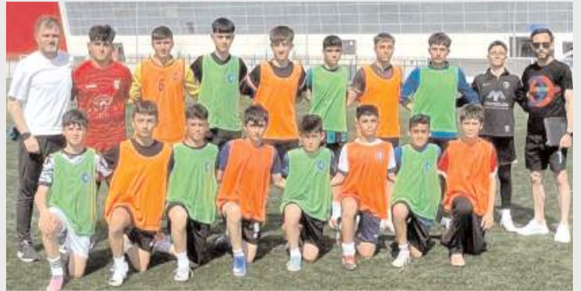
Analgig futbol bölge birinciliğinde ilimizi temsil edecek sporcular ve antrenörler toplu halde