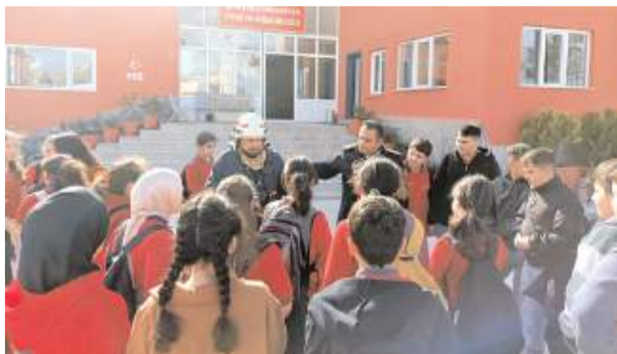
Öğrencilere yangınlarda nasıl hareket etmeleri gerektiği anlatıldı.

Sungurlu Belediyesi İtfaiye Müdürlüğü yetkilileri, bu tür eğitim ve ziyaretlerin çocuklarda farkındalık oluşturmak adına büyük önem taşıdığını belirterek, eğitim faaliyetlerinin devam edeceğini ifade etti. (İHA)