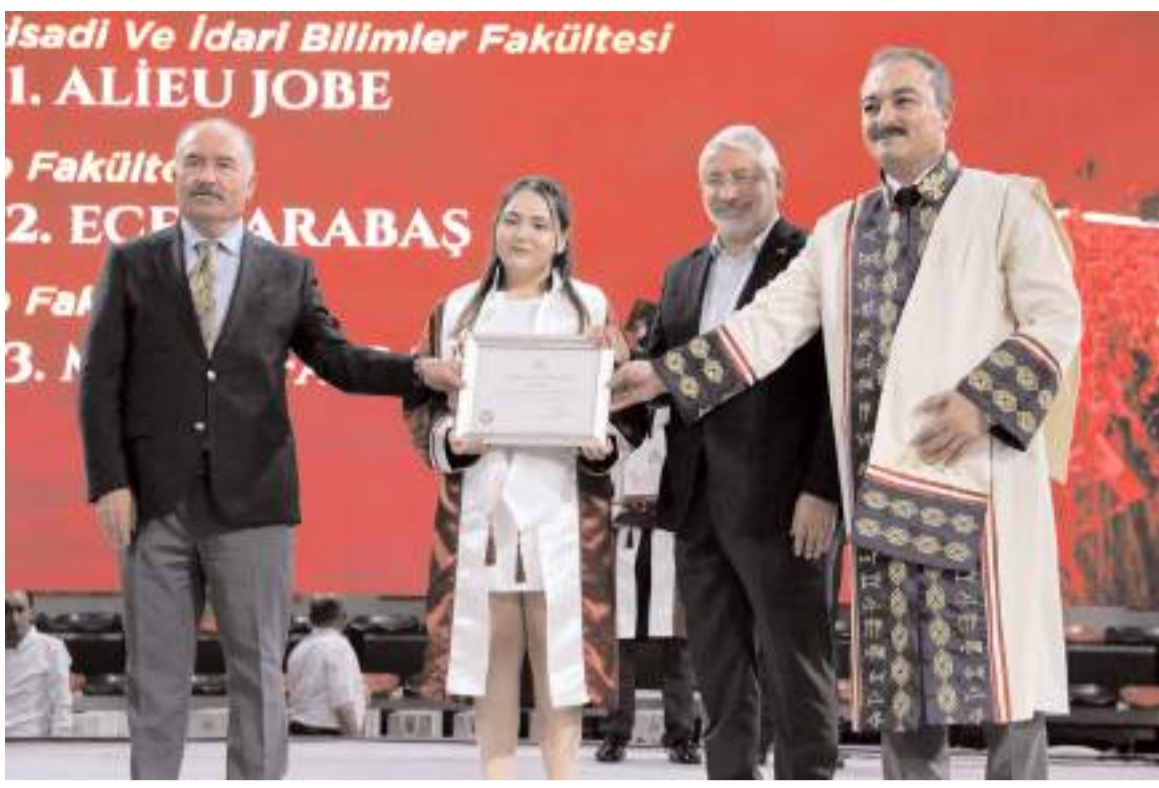
Bölemlerinde derece elde eden öđrencilere diplomalarını protokol üyeleri verdi.