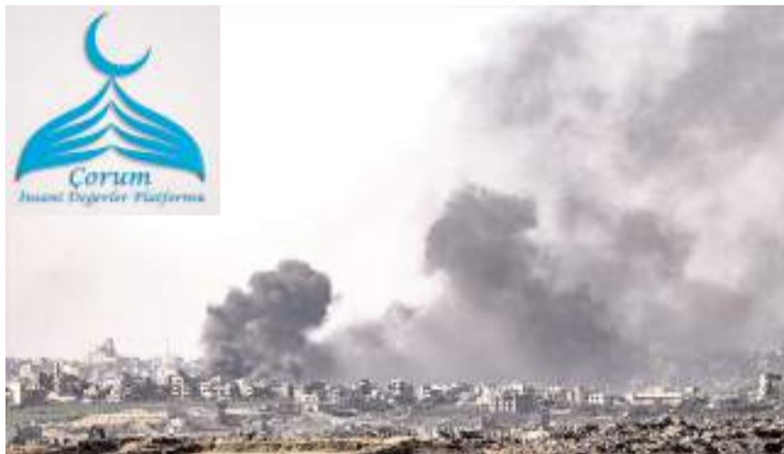
İsrail, Gazze'de binlerce Filistinliyi kattetti.

■ Çorum İnsani Değerler Platformundan yapılan açıklamada Gazze'de yapılan ateşkeslerin soykırımcılığı artık küresel kabul gören siyonist çete için stratejik birer molaya dönüştüğü belirtildi. * HABERİ 2'DE