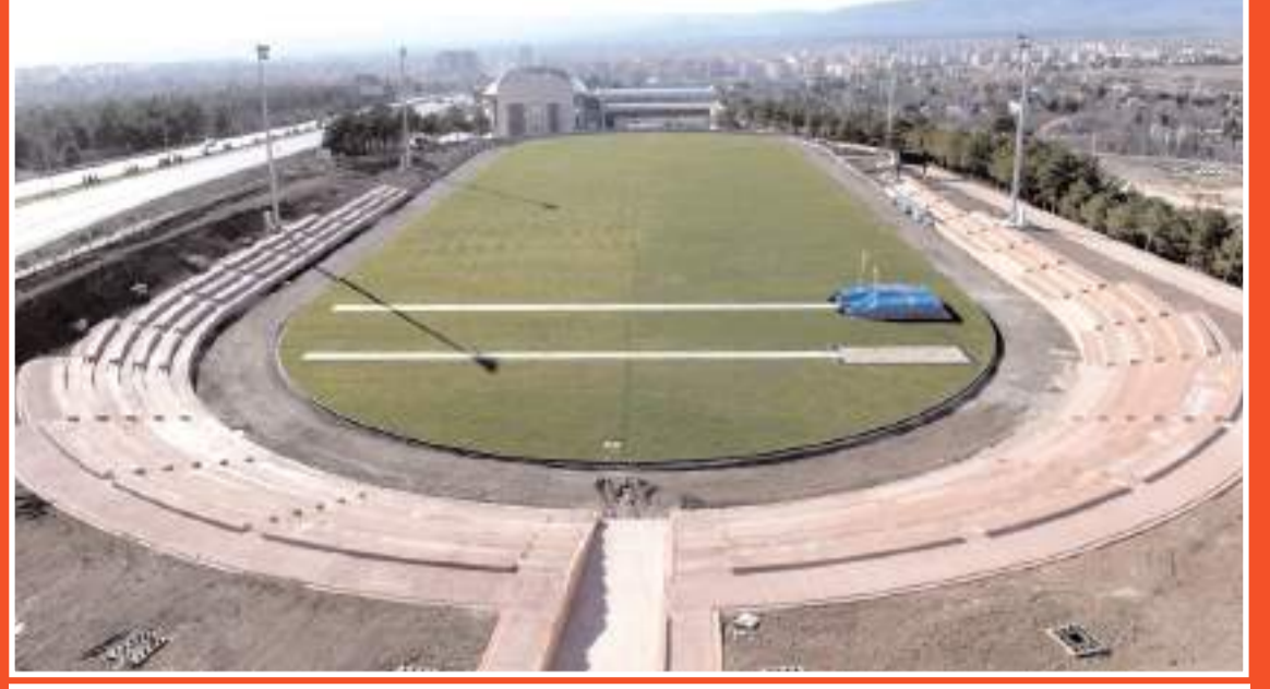
Maçlar için eldeki tel alternatif Hitit Üniversitesi Muhsin Yazıcıoğlu Stadi için çalışma yapılması gerekiyor

Şu anda tüm gözler Süper Lige odaklı ancak U 19 PAF Liginde A takımla aynı tarihte başlayacak olması nedeni ile Yönetimin bu konuya acil bir çözüm bulması gerekiyor. Alt yapı tesisi olmayan Süper Lig takımı olmaya çağına göre geçtiğimiz sezon başı tabelası asılan yere biran önce yapımına başlanmalı. Bu süre içinde de maçları oynamak zorunda