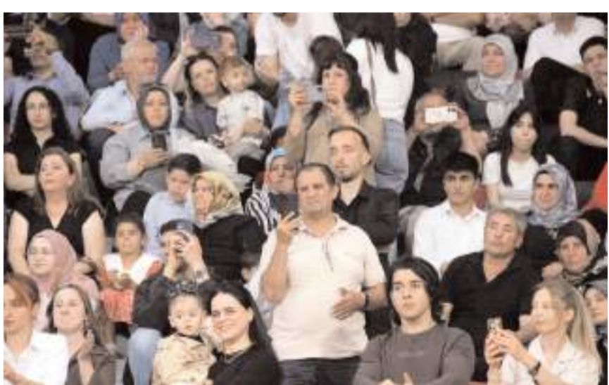
Bu mutlu günlerinde öğrencileri aileleri yalnız bırakmadı.