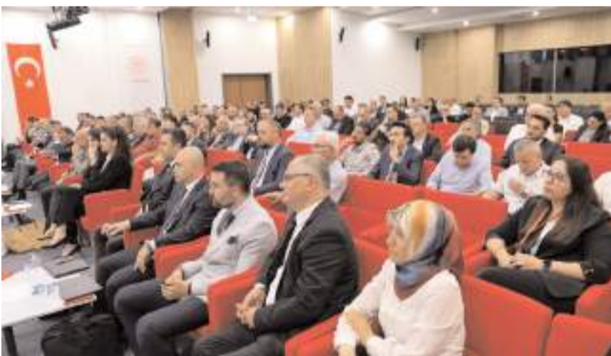
Katılımcılara sistemin işleyişine ilişkin kapsamlı sunumlar gerçekleştirildi.