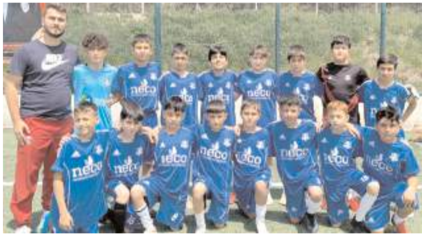
Vefaspor zorlu grupta ilk yarı maçları sonunda averajla liderlik koltuğunda

U 12 liginde ilk yarı sonunda A grubunda Vefaspor, B grubunda İskilipgücüspor, C grubunda Gençlerbirliği D grubunda ise Osmancık Kandiberspor takımları liderlik koltuğuna oturdular. Gruplarda şampiyonluk iddiası üç grupta oldukça zorlu geçmeye aday.