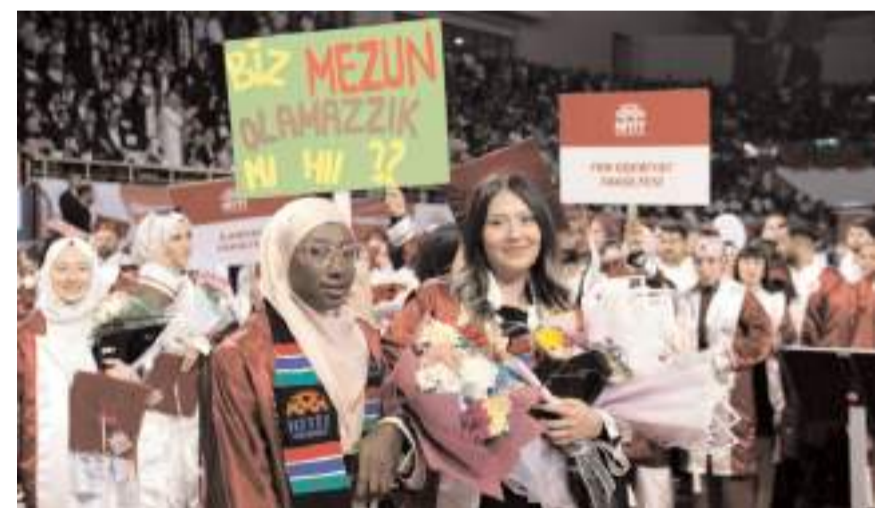
Yabancı öğrencilerde mezun olmanın sevincini yaşadılar.