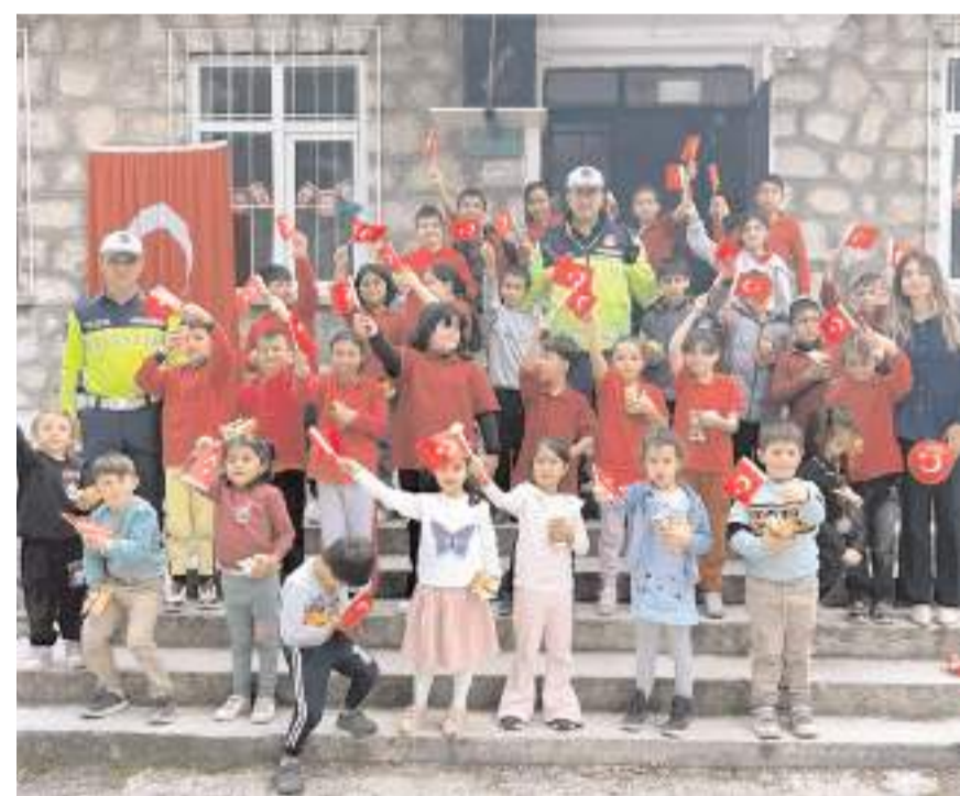
Günün anısına toplu fotoğraf çekildi.

28 öğrencinin katıldığı eğitimin ardından öğrencilere Türk bayrağı, ay yıldızlı balon hediye edildi. (AA)