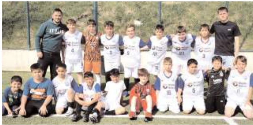
İskilipgücüspor takımı grupta ilk yarıda tüm maçları kazanarak lider tamamladı