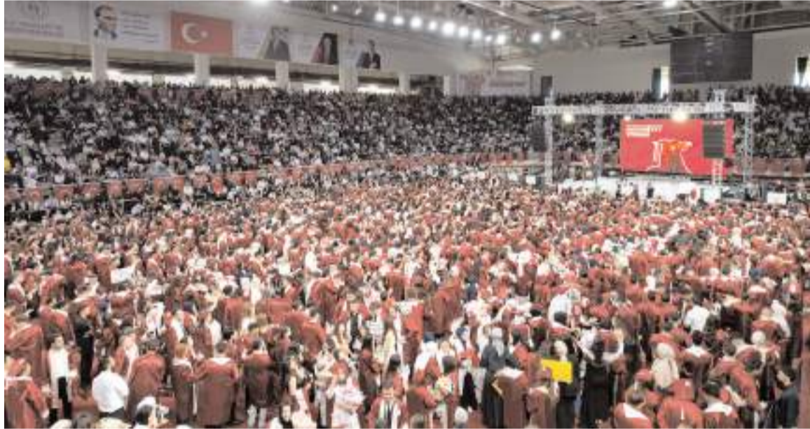
Çorum Spor Salonunda düzenlenen törene katılım yüksek oldu.