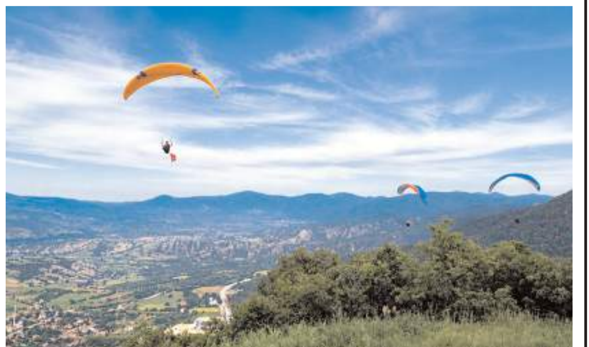
Gökyüzünde süzülen yamaç paraşütleri renkli görüntüler oluşturdu.