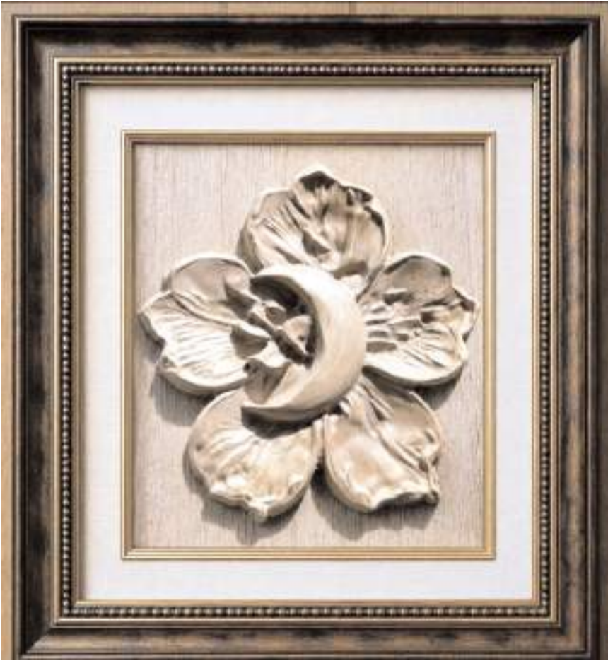
Sergi 11 Haziran'da açılacak.