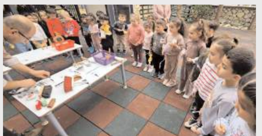
Hitit Üniversitesi Arkeoloji Bölümü öğretim üyeleri ve öğrencileri miniklere ilk olarak arkeologların kullandığı ekipmanları tanıttı.

Çorum'un Kargı ilçesinde ana sınıfı öğrencileri arkeoloji bilimiyle tanıştı.