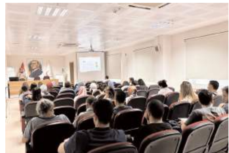
Eğitimde hipertansiyon ve astım konularında kapsamlı sunumlar yapıldı.