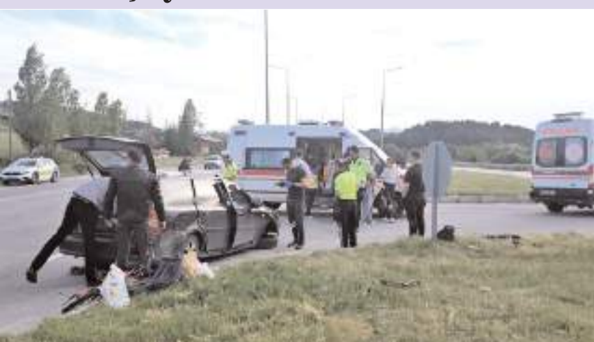
Yaralılara ilk müdahale olay yerinde 112 acil sağlık ekipleri tarafından yapıldı.