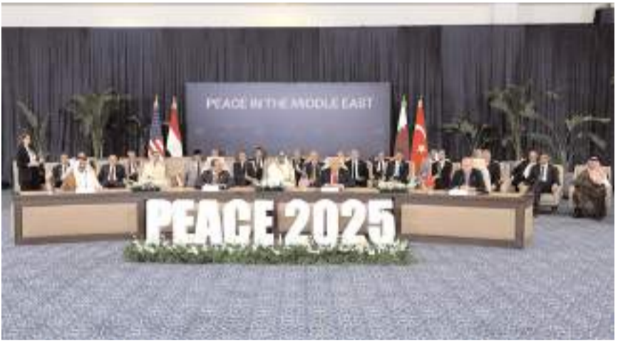
Ateşkes anlaşması 10 Ekim 2025 tarihinde imzalanmıştı.