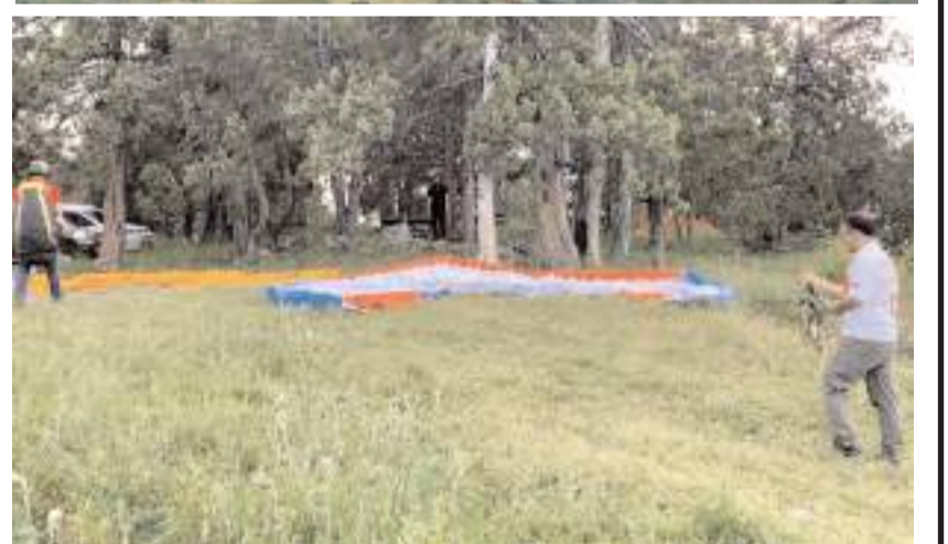
Etkinliği Çorum Sportif Havacılık Ekibi gerçekleştirdi.