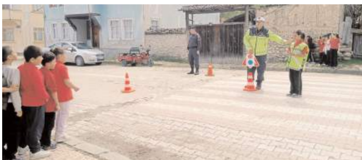
Jandarma ekipleri trafik kurallarını anlattı.