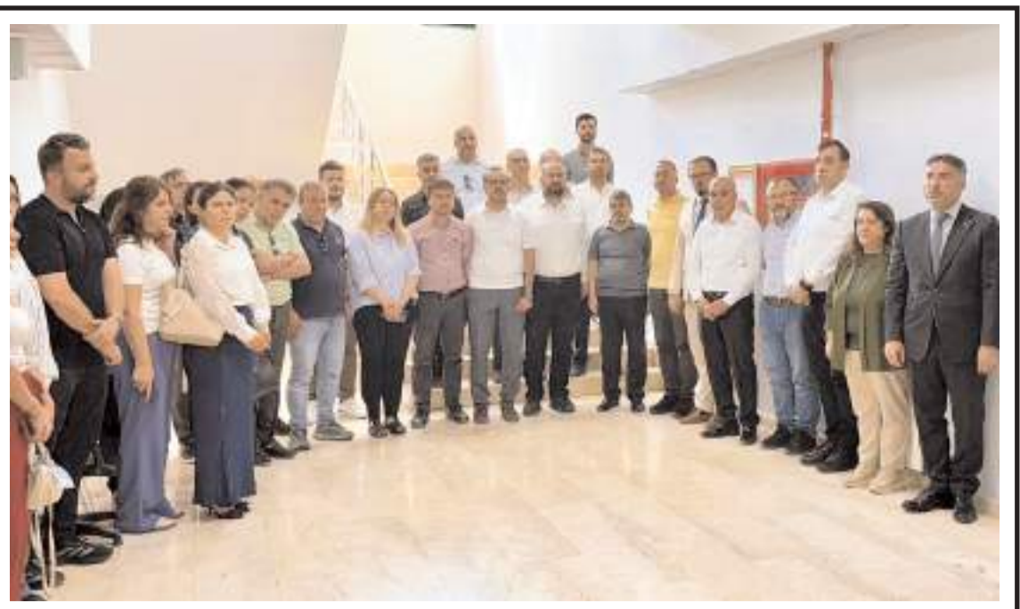
Şehit müzik öğretmeni Şenay Aybüke Yalçın için Batman Üniversitesi'nde anma programı yapıldı.