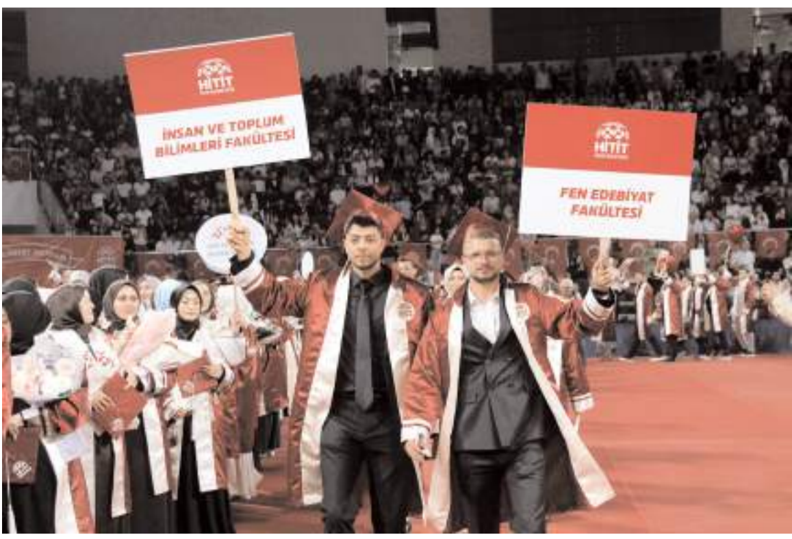
Öđrenciler törende yürüyüş yaptılar.