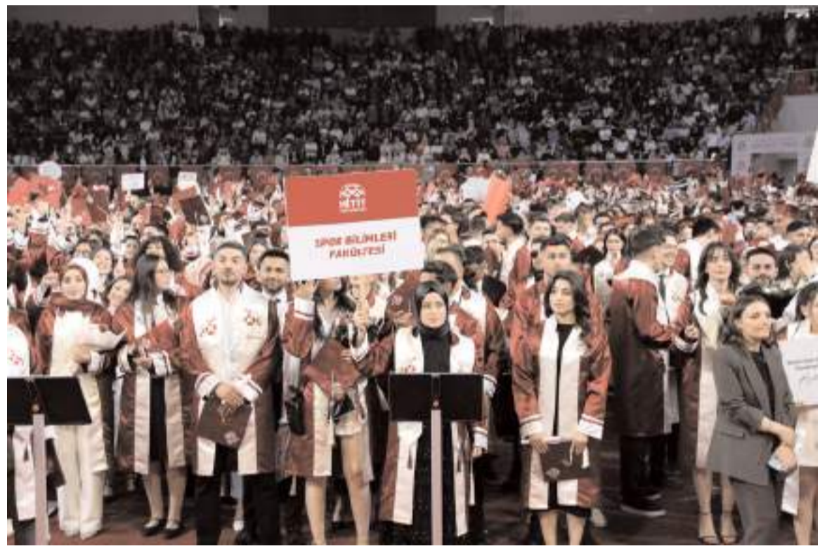
Öđrenciler uzun bir maratonun ardından mezun olmanın mutluluđunu yaşadılar.

Şehrimizin, Çorum'un ve ülkemizin gelişimine katkı sunan birçok önemli çalışmayı hayata geçirirken temel hedefimiz her zaman sahip olduğumuz bilgi ve birikimi milletimizin, toplumumuzun faydasını sunmak oldu. Aziz milletimizin her bir ferdeine dokunmayı, fayda üretmeyi ve geleceğimizi daha sağlam temeller üzerine inşa etmeyi en büyük sorumluluklarımız arasında bildik.