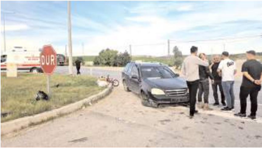
Kaza Palabıyık köyü kavşağında meydana geldi.