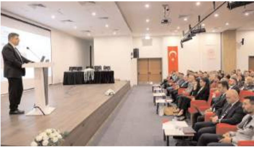
Risk Esaslı Denetim Sistemi (REDES), Samsun'da düzenlenen bölge toplantısıyla tanıtıldı.