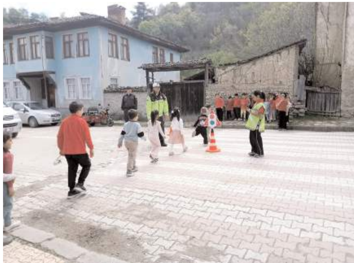
Öğrencilere trafik kuralları uygulamalı olarak gösterildi.