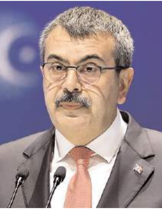
Milli Eğitim Bakanı Yusuf Tekin

"Hazırlıkların yapılabilmesi için eğitim-öğretimin devam ettiği cuma günü bir gün idari izin verdik." diyen Tekin, "Öğrencilerimiz, öğretmenlerimiz,