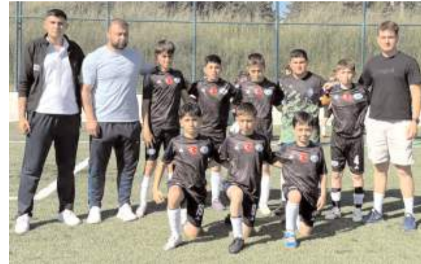
Gençlerbirliği U 12 takımı grupta ilk yarıyı lider olarak tamamladı

U 12 liginde ikinci yarı pazar günü oynanacak maçlarla başlayacak.