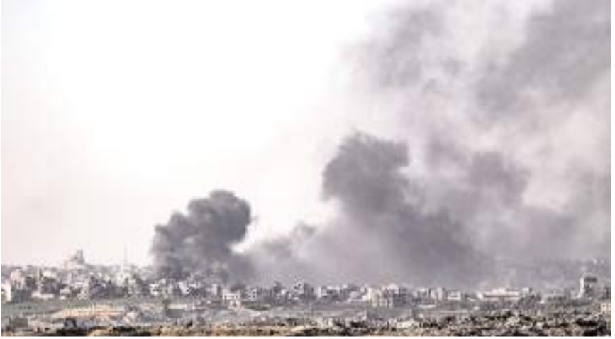
İsrail, Gazze'de binlerce Filistinliyi katletti.