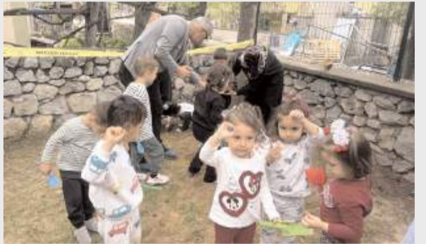
Minikler kazı alanında fırça ve spatula kullanarak kazı deneyimi yaşadı.