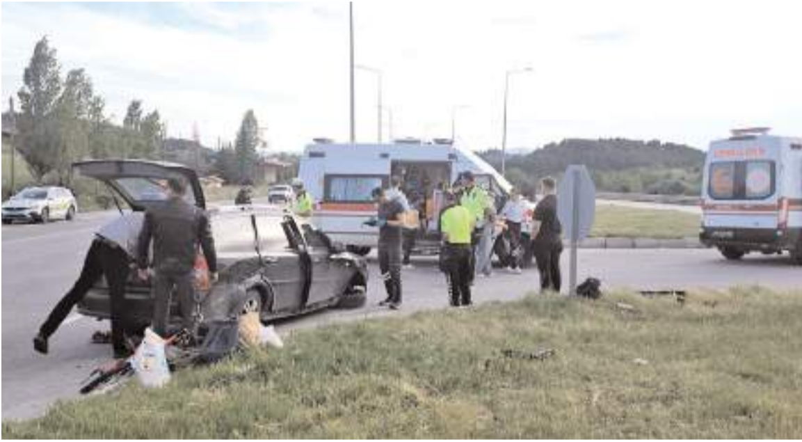
Yaralılarına ilk müdahale olay yerinde 112 acil sağlık ekipleri tarafından yapıldı.

Çorum'da otomobil ile asfalt yüklü tankerin çarpışması sonucu aynı aileden 4 kişi yaralandı.