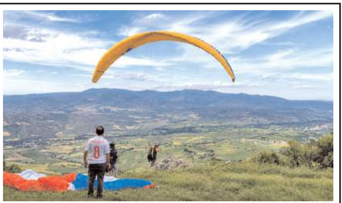
Paraşütçüler, Laçın'da uçuş gerçekleştirdi.

Teknik yönlendirmeler, uygulanacak işlemler ve geçiş takvimine ilişkin internet haber sitelerine ayrıca yazılı bildirim yapılacaktır. (Haber Merkezi)