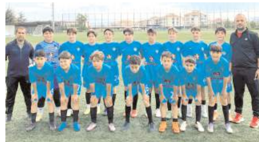
Osmancık Kandiberspor U 12 takımı grubunda ilk yarıyı lider tamamlamayı başardı