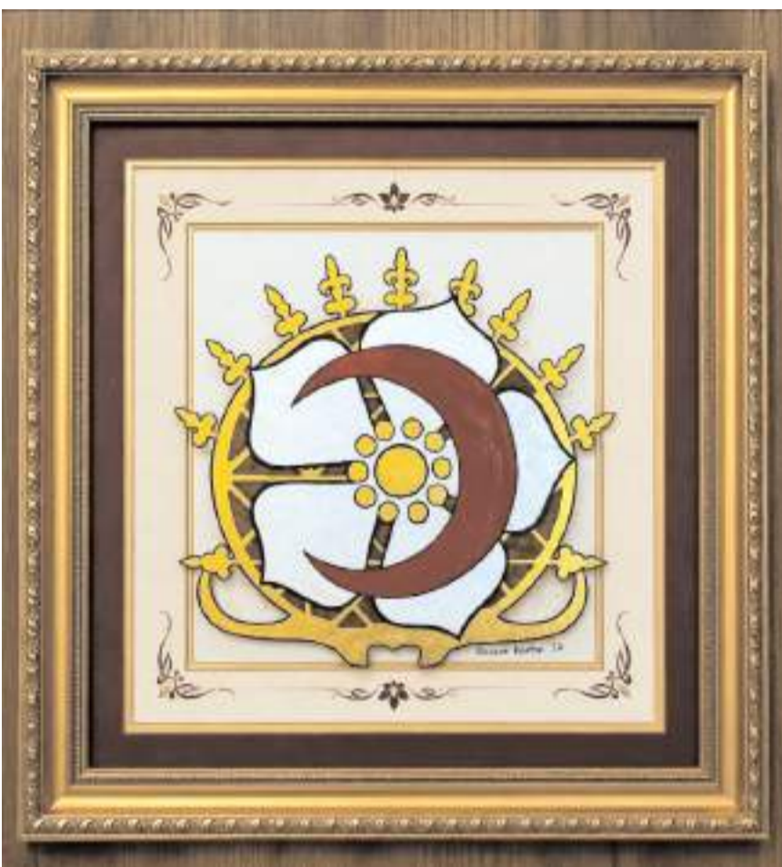
Sanatçılar Hilâl-i Ahmer Çiçeği temasını Çorum'un tarihi, kültürel ve sanatsal birikimiyle buluşturarak özgün eserler ortaya çıkarttılar.