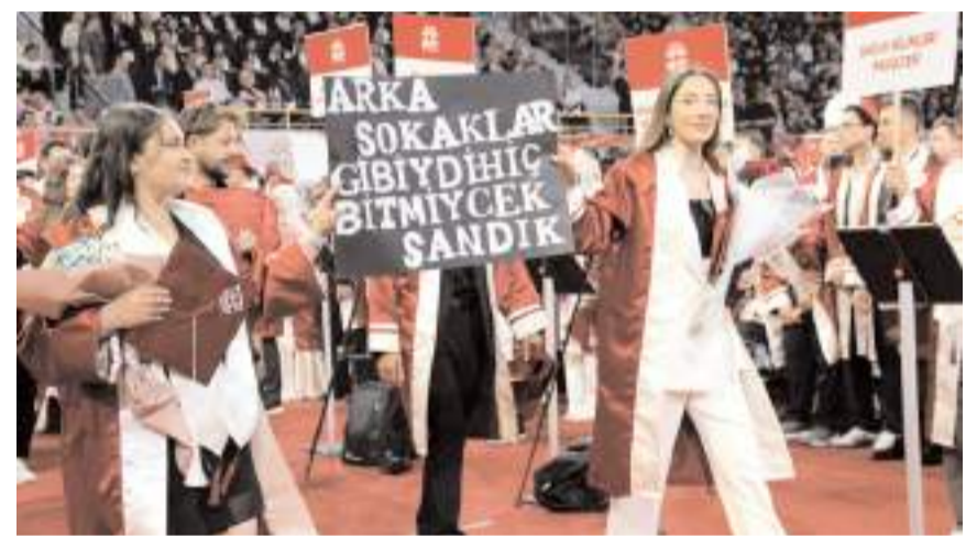
Öđrencilerin geçit töreninde taşıdıkları pankartlar ilgi çekti.

Tören sonunda keplerini havaya fırlatarak mezuniyetin coşkusunu yaşayan öğrenciler, ailelerine sarılarak mutluluklarını paylaştı.