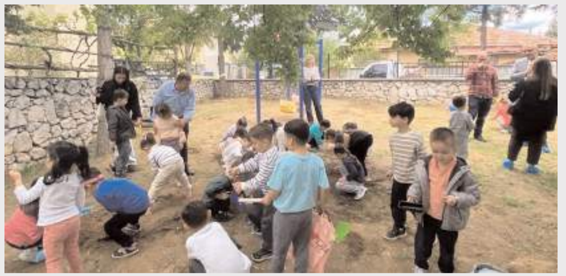
Kargı 125. Yıl Anaokulunca "Minik eller geçmişin izinde" sloganıyla etkinlik düzenlendi.

Çorum Kızılay, katılımcı sayısı bakımından daha önce iki kez Türkiye derecesi elde etmiş, İstanbul hariç iller arasında bir kez Türkiye birincisi ve bir kez Türkiye ikincisi olmuştu.