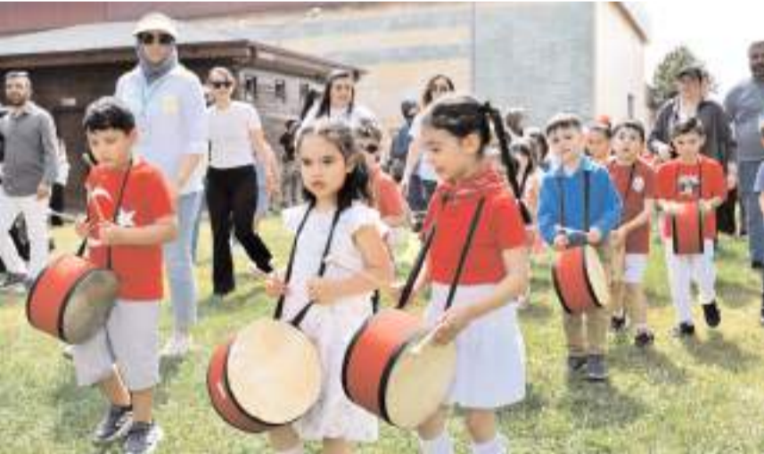
Yürüyüşün ardından anaokulu öğrencileri tarafından hazırlanan çeşitli gösteriler sahnelendi.