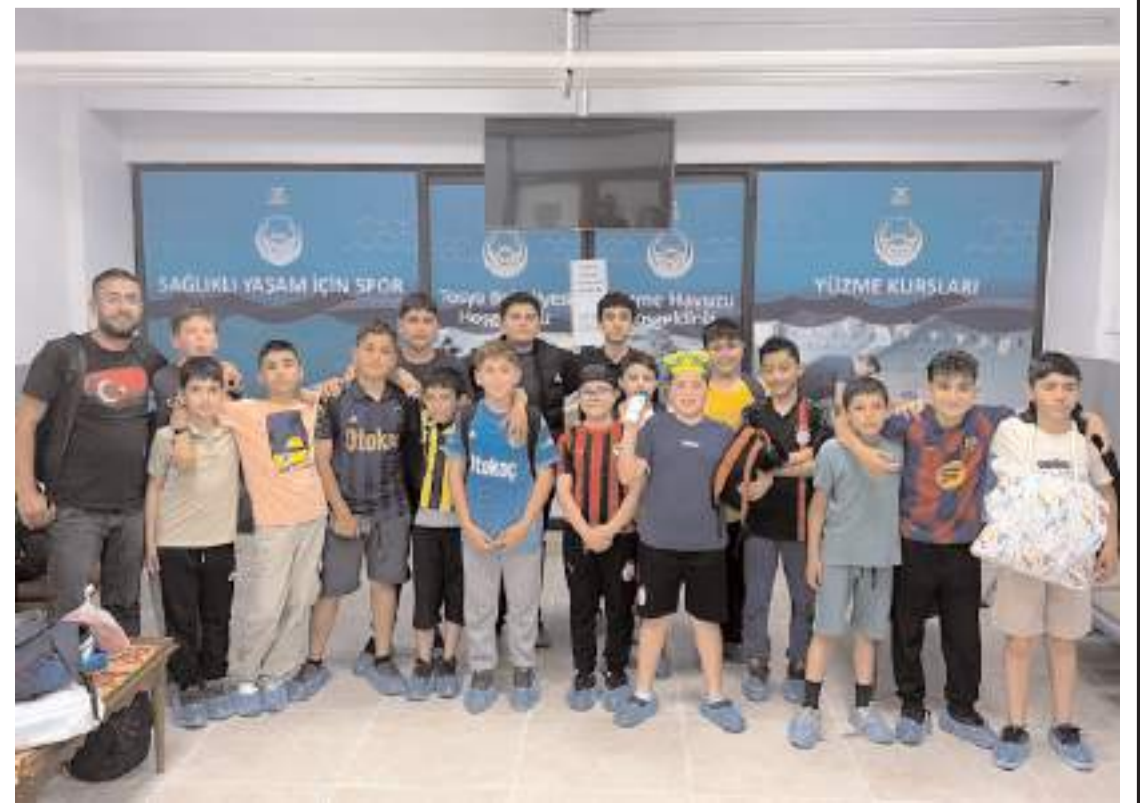
Etkinliğe 18 beşinci sınıf öğrencisi katıldı.