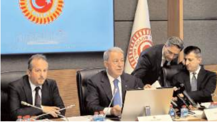
Komisyon AK Parti Kayseri Milletvekili Hulusi Akar başkanlığında toplandı.

Teklifle Uzman Erbaş Kanunu'nda değişiklikte gidiliyor. 26 Haziran 2019'da askerlik süresinin kısalması nedeniyle muvazaflık hizmetini yapmış olan çavuş, onbaşı ve erlerin uzman erbaş olabilmeleri için "müracaat yapılan yılın ocak ayının ilk günü itibarıyla 27 yaşını bitirmemiş olmak" şartı yeterli olurken, bu hususa yönelik düzenleme yapılması ile başta şehit yakınları olmak üzere askerlik hizmetinden muaf tutulanların uzman erbaş olmak