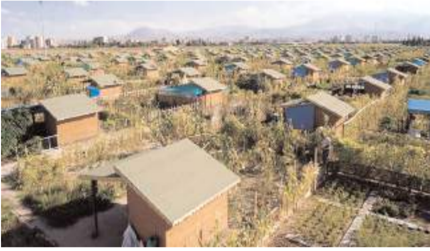
Düzenleme kapsamında tarım arazilerinin hobi bahçesi ve konut amaçlı bölünmesinin önüne geçildi.