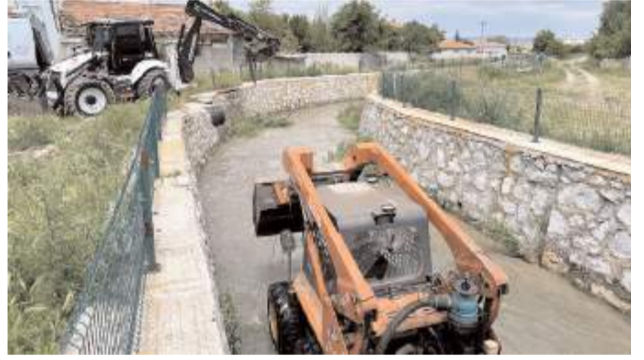
Temizliği dere içinde iş makineleri yapıyor.