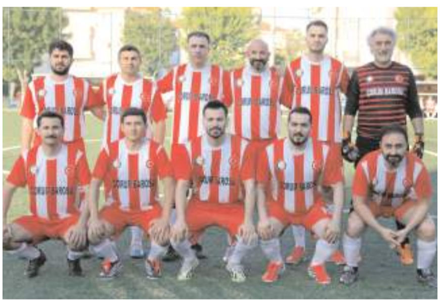
Çorum Barosu dördüncü maçında kazanarak çeyrek final için umutlanmak istiyor