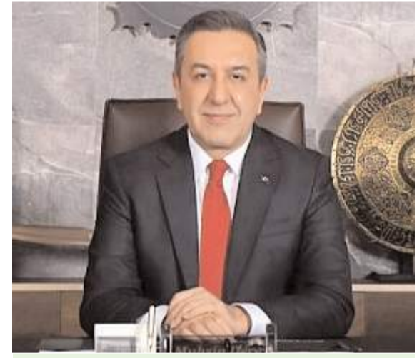
Sungurlu Belediye Başkanı Muhsin Dere

Çorum Belediyesi, üniversite öğrencilerine yaz döneminde iş imkanı sunuyor. Belediye bünyesindeki sosyal tesislerde yaz döneminde part time çalıştırılmak üzere bu yıl da 50 üniversite öğrencisi alınacak. * HABERİ4'TE