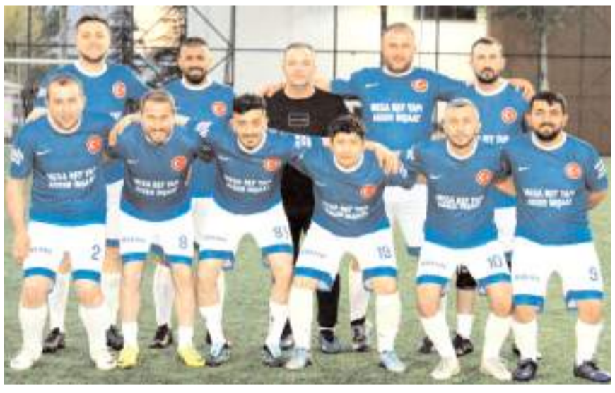
Kule Yapı dördüncü maçında Çorum Barosu karşısında ilk puanlarını almak istiyor