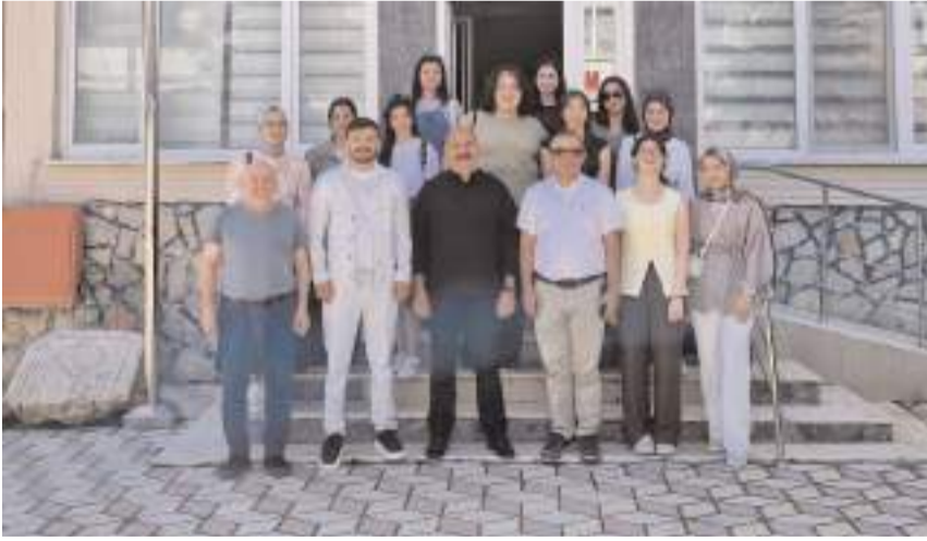
Öğrenciler Ortaköy Belediye Başkanı Taner İsbir'i ziyaret etti.