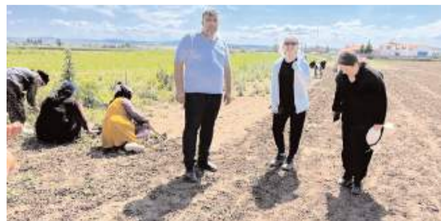
Verimin ve kalitenin korunması amacıyla, mor soğan üretilen tarlalarda ekipler tarafından denetimler gerçekleştiriliyor.