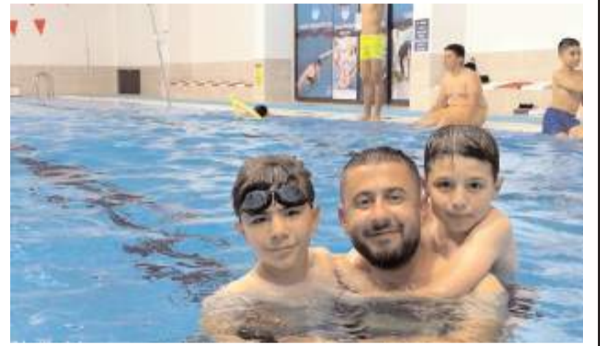
Kargı Cumhuriyet Yatılı Bölge Ortaokulu öğrencileri güzel bir gün geçiriyor.

Öğrenciler Tosya Belediyesi'ne teşekkür etti.