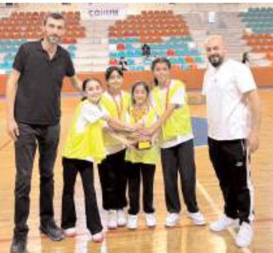
İlkokulu Küçük kızlar il birincisi Atatürk İlkokulu

Tüm kategorilerde yapılan maçlar sonunda dereceye giren okullara kupa sporculara ise madalyaları verildi.