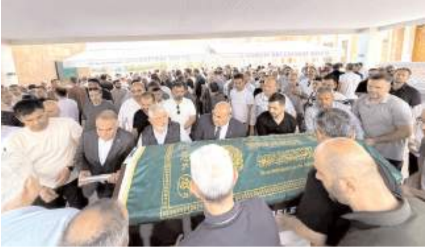
Merhumun cenazesi namazın ardından Ulu Mezarlık'ta toprağa verildi.