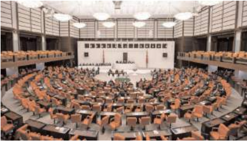
Yasal düzenleme TBMM Genel Kurulu'nda kabul edildi.