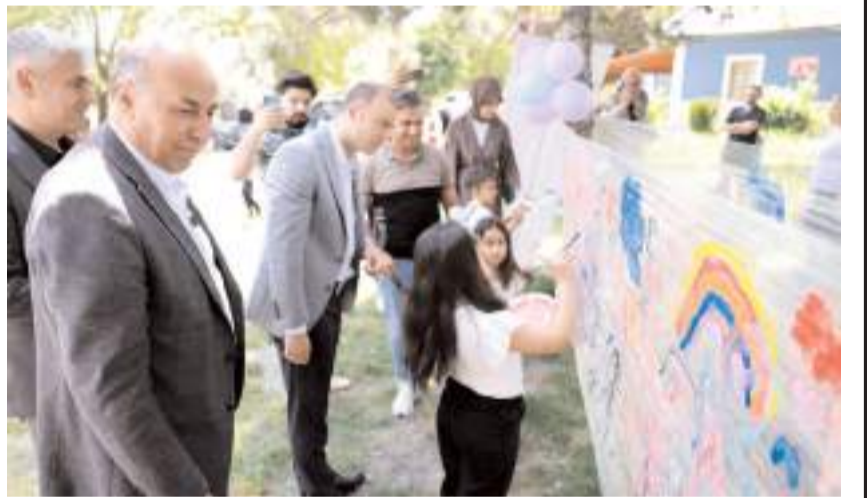
Etkinlik alanında kurulan stantlarda geleneksel çocuk oyunları, bilim ve zeka atölyeleri, balon katlama etkinlikleri başta olmak üzere çok sayıda etkinlik gerçekleştirildi.