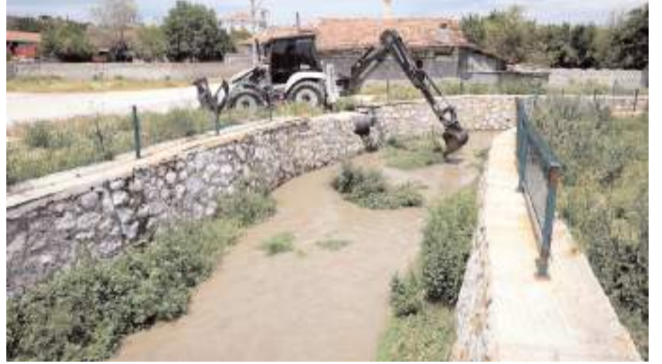
Ekipler dere yatağında su akışını engelleyen malzemeleri temizliyor.