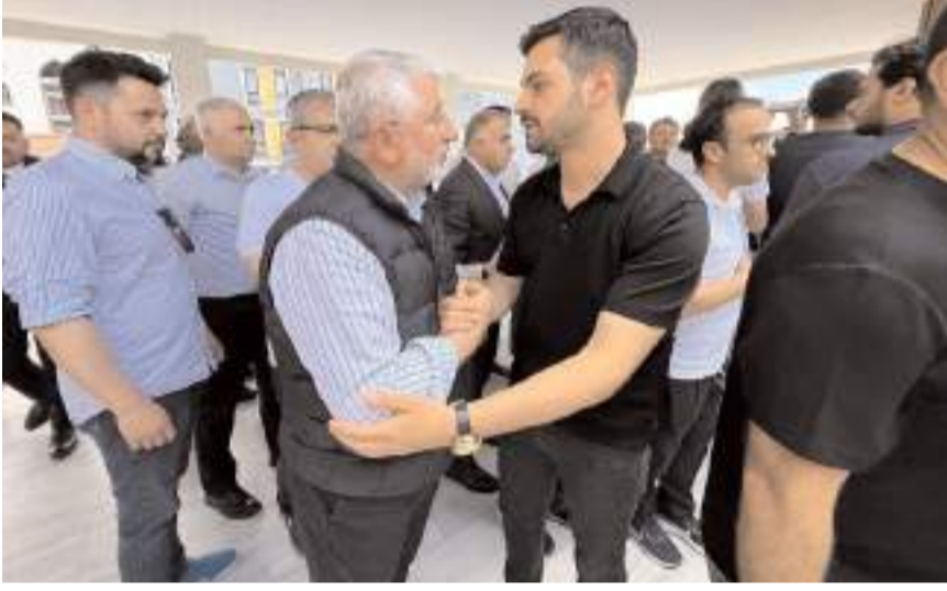
İstanbulu Ailesi taziyeleri kabul etti.