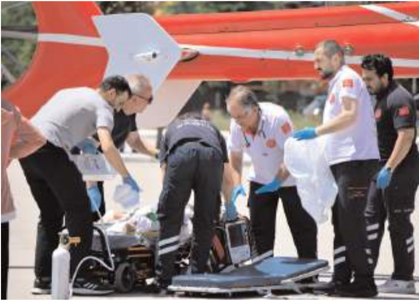
5 yaşındaki M.E.E., ambulans helikopterle Gazi Üniversitesi Tıp Fakültesi Hastanesi'ne sevk edildi.

Olay, Buharaevler Mahallesi Silimkent Caddesi'nde meydana geldi. Edinilen bilgiye göre, 5 yaşındaki M.E.E., ailesiyle birlikte yaşadığı apartmanın 4'üncü katındaki evin balkonundan aşağı düştü. 112 Acil Çağrı Merkezine yapılan ihbar üzerine olay yerine sağlık ve polis ekipleri sevk edildi. Sağlık ekiplerince olay yerinde ilk müdahalesi yapılan yaralı çocuk Hitit Üniversitesi Erol Olçok Eğitim ve Araştırma Hastanesi'ne kaldırıldı. Yoğun bakım ünitesinde tedavi altına alınan M.E.E., hayati tehlikesinin sürmesi sebebiyle ambulans helikopterle Ankara Gazi Üniversitesi Tıp Fakültesi Hastanesi'ne sevk edildi. (İHA)