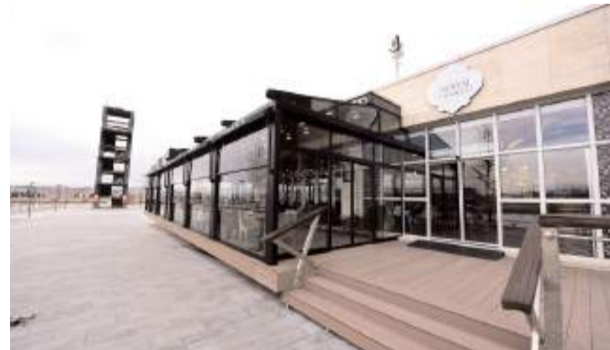
Başvurular; 12-15 Haziran 2026 tarihleri arasında yapılacak.

Çorum Belediyesi, üniversite öğrencilerine yaz döneminde iş imkanı sunuyor. Belediye bünyesindeki sosyal tesislerde yaz döneminde part time çalıştırılmak üzere bu yıl da 50 üniversite öğrencisi alınacak.