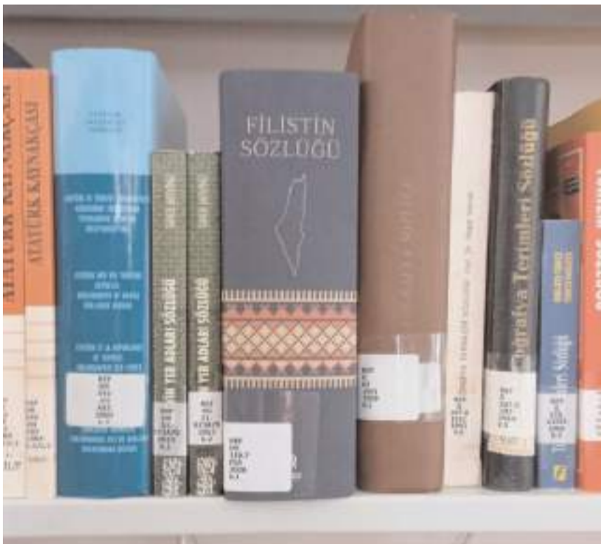
Sözlük Hitit Üniversitesi Merkez Kütüphanesi raflarında yer aldı.

lerin Arapça, İngilizce, Almanca ve Fransızca karşılıklarını da sunuyor.