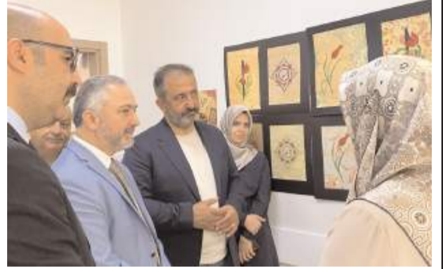
Davetliler sergiyi gezerek eserler hakkında bilgi aldı.