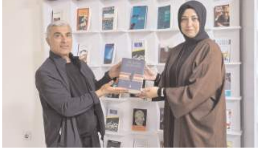
Sözlük Çorum Kültür Merkezi Kütüphanesine hediye edildi.