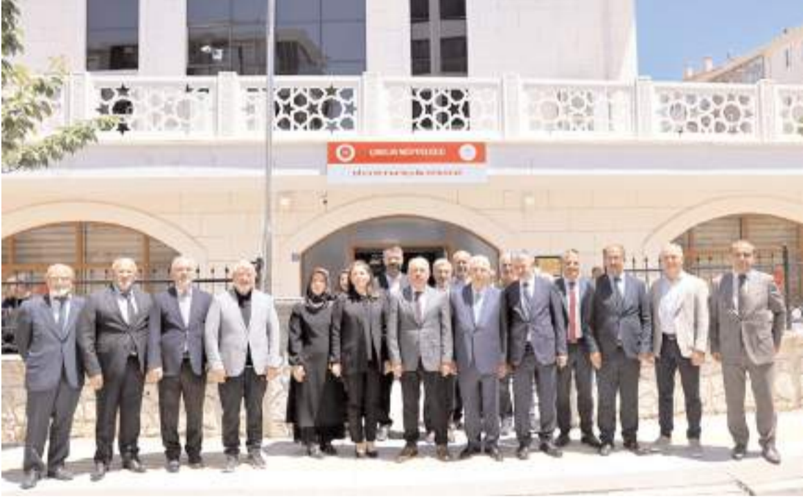
Ziyaretin ardından toplu hatıra fotoğrafı çekildi.