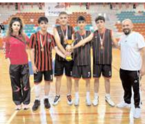
Genç erkekler il birinciliği Mimar Sinan Anadolu Lisesi