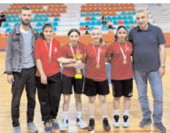
Yıldız Kızlar il birincisi Mustafa Kemal Ortaokulu