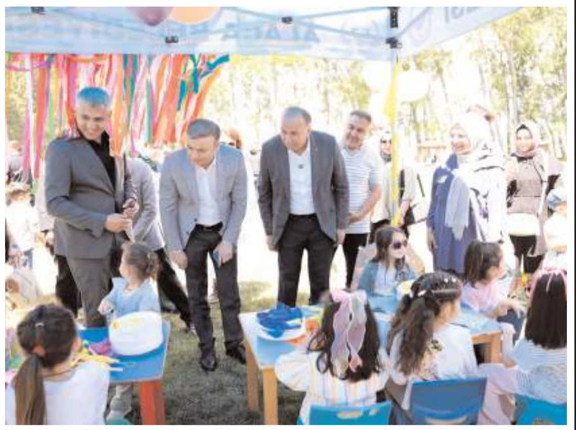
Şenlik Veli Çayırı'nda yapıldı.

17 maddelik teklif, Milli Savunma Komisyonu'nda kabul edildi. (İHA)