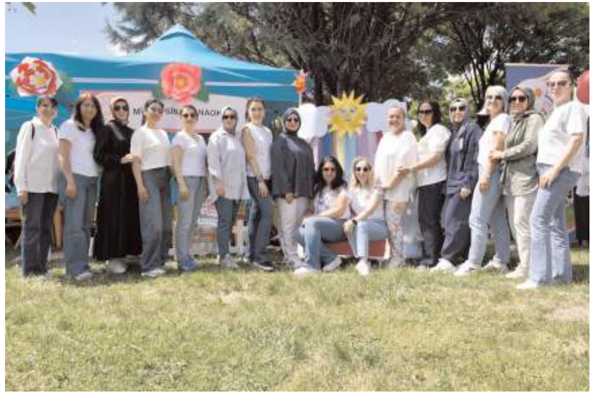
Maarifin Kalbinde Çocuk Okul Öncesi Eğitim Şenliği Şehitler Parkı'nda gerçekleştirildi.