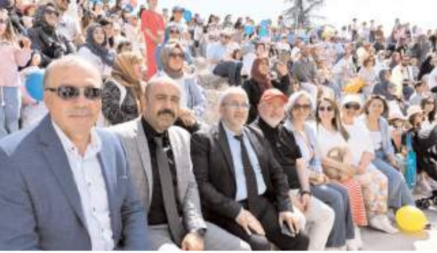
Şenliğe ilgi yüksek oldu.