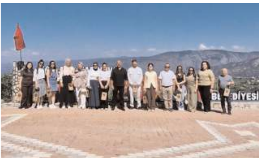
Öğrenciler ile beraberindekiler ilçenin tarihi ve turistik yerlerini gezdi.

Yerel yönetimlerin gençlerle olan bağı güçlendirmek ve ilçenin tarihi-kültürel değerlerini tanıtmak amacıyla gerçekleştirilen ziyarette, gençlerin talepleri, eğitim hayatları ve bölgedeki gençlik faaliyetleri üzerine değerlendirilmelerde bulunuldu.