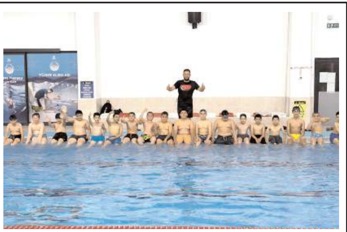
Kargı ilçesinden öğrenciler Tosya'daki yüzme havuzunda serinledi.