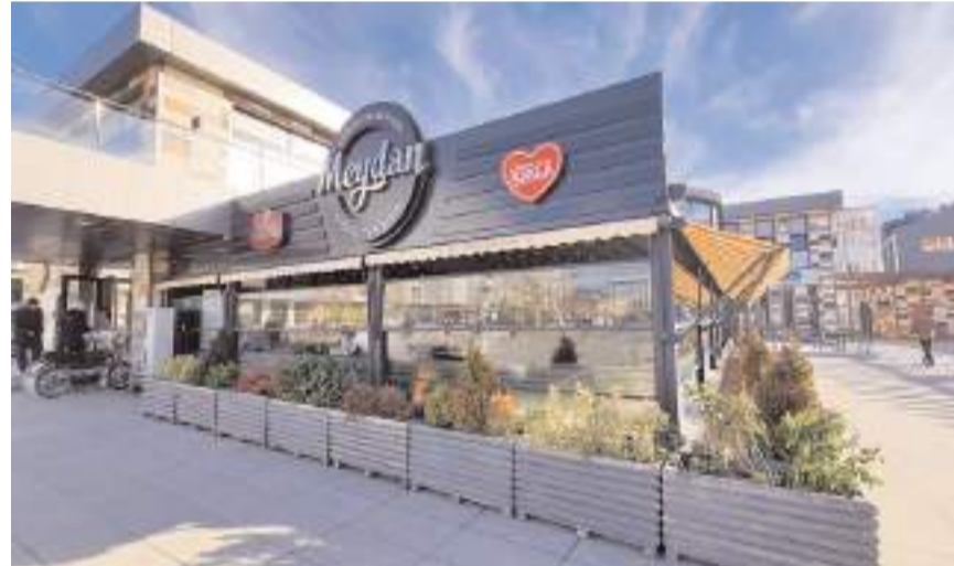
Yaz dönemi boyunca sosyal tesislerde 50 üniversite öğrencisine part time çalışma fırsatı sağlanacak.