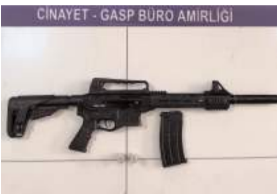
Uygulamalarda 3 tabanca ve 1 av tüfeği ele geçirildi.