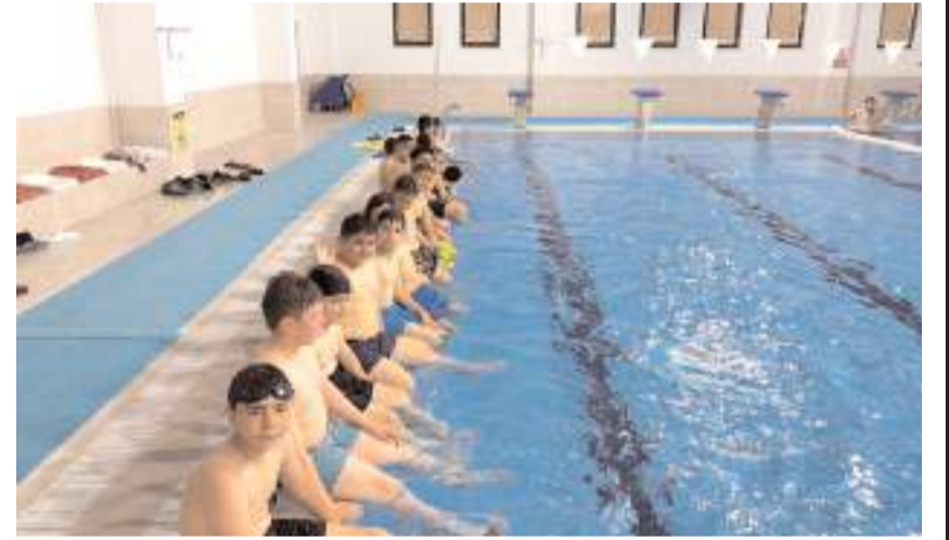
Öğrenciler Tosya Belediyesi'ne teşekkür etti.