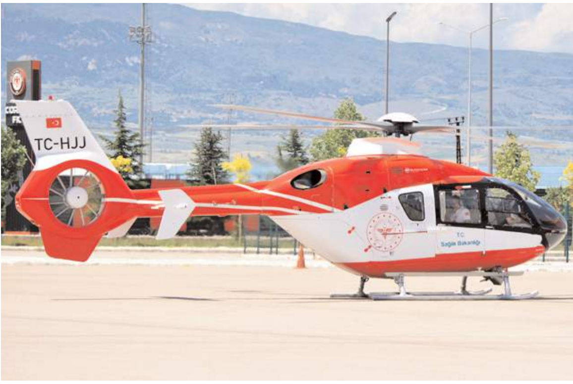
Ambulans helikopter Çorum Şehir Stadyumu otoparkına indi.