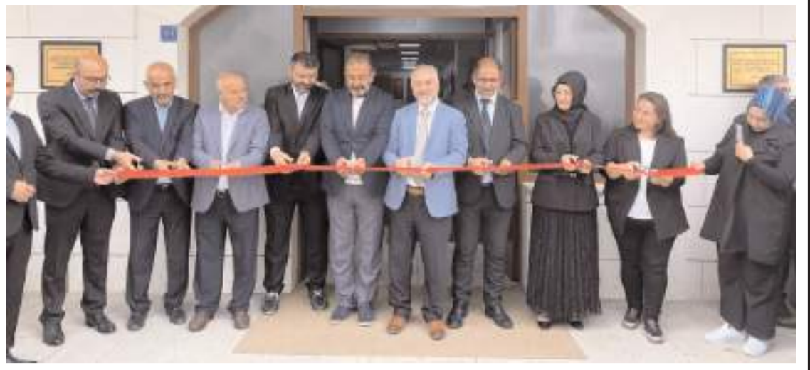
Yapılan duanın ardından açılış kurdelesi kesildi.

Diyanet Gençlik Merkezlerinin gençler için çok önemli bir fırsat olduğunu ve hayırlı hizmetler yürüttüğünü vurgulayan Vali Çalgan, bu hizmetlere katkı sağlayan kurumlara, sivil toplum kuruluşlarına ve özveriyle görev yapan tüm personele teşekkür ederek, çalışmalarında başarılar diledi. (Haber Merkezi)