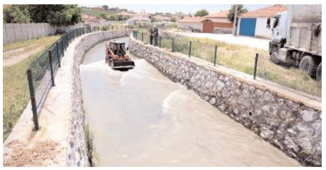
Alaca Deresi'nde geniş çaplı temizlik çalışması başlatıldı.