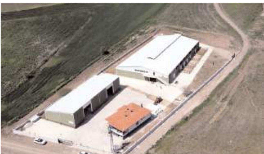
Tesis Laçın'ın Mescitli köyünde bulunuyor.