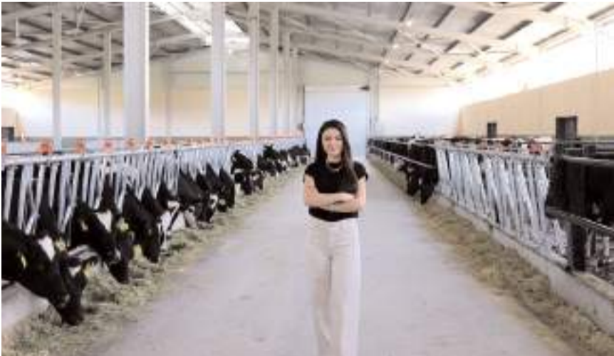
Tesisin kapasitesi 102 sağmal büyükbaş hayvan olarak planlanmış.