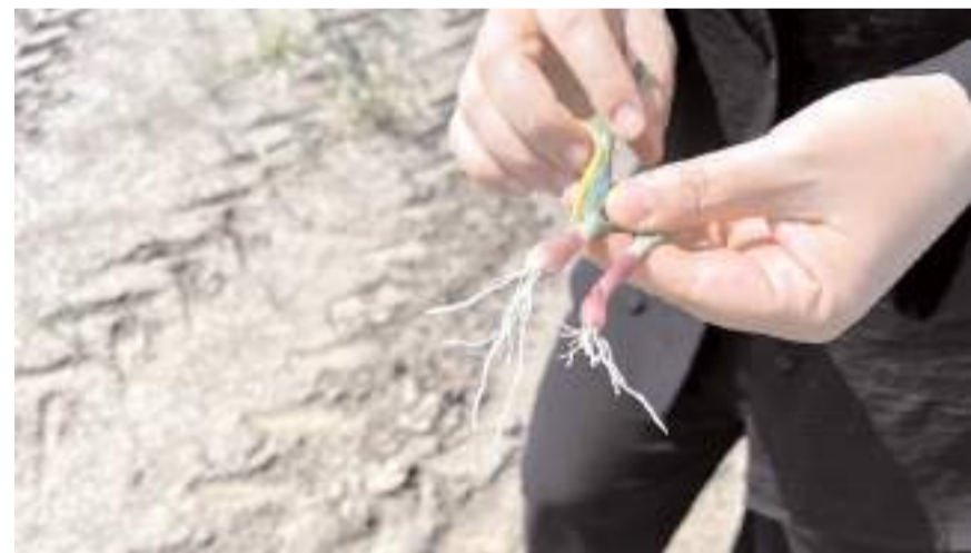
Uzmanlar gerçekleştirilen kontrollerde soğanların gelişim durumu değerlendiriyor.