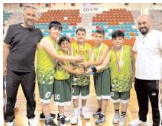
Yıldız erkekler il birincisi Doğa Koleji