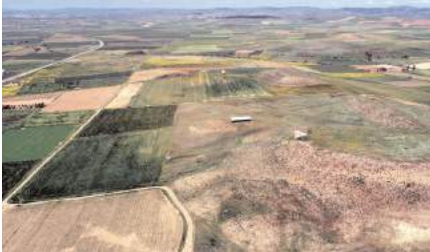
Proje ile düşük vasıflı meraların verimlerinin artırılması hedefleniyor.