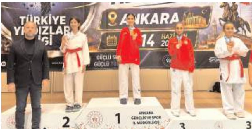
Müsabakalarda Çorumlu sporcular kürsüye ambargo koydular