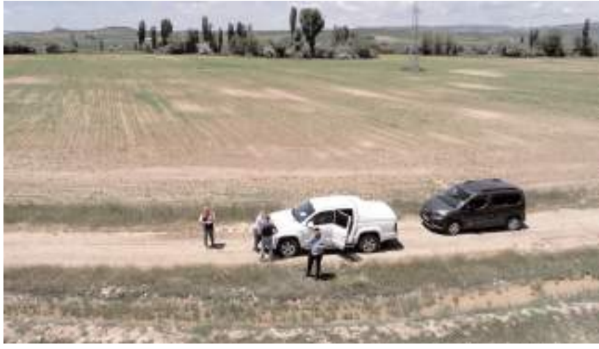
Tarım ve Orman Bakanlığında gelip ekip meralarda inceleme yaptı.