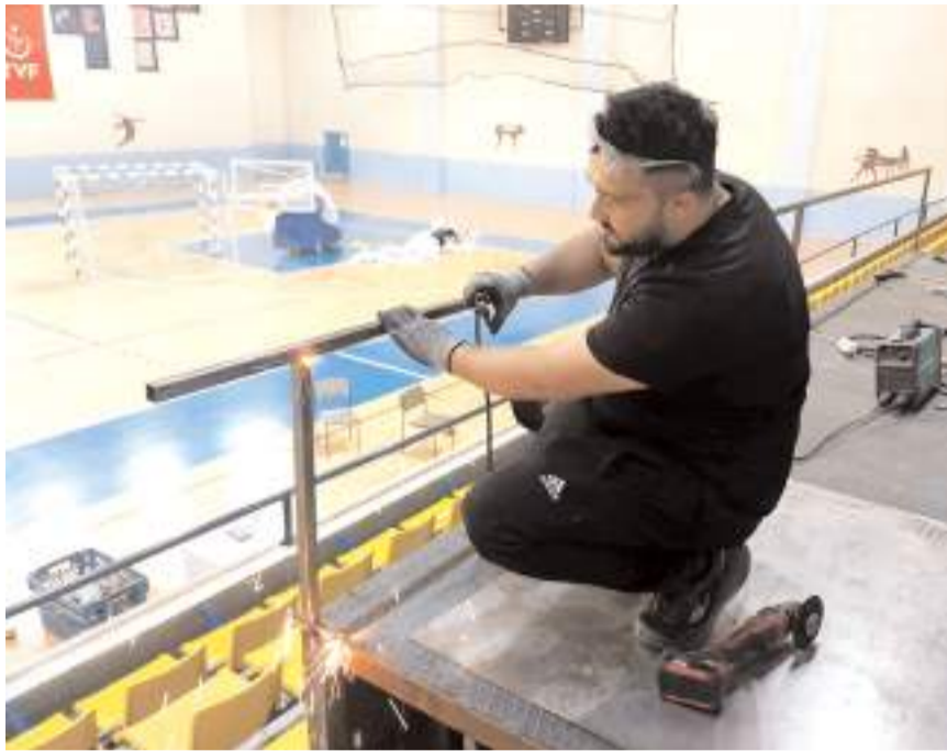
Naklen yayın için kamera çekimi ve maç anlatımı için özel bölüm hazırlanıyor