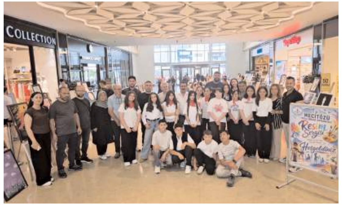
Günün anısına hatıra fotoğrafı çekildi.