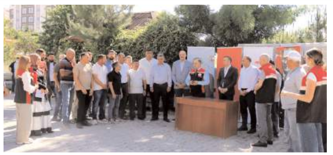
Türkiye Dayanıklı Peyzaj Entegrasyonu Projesi kapsamında köylere sıvat dağıtımı yapıldı.