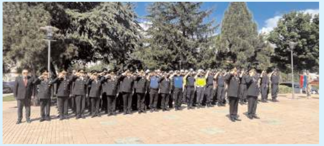
Jandarma Teşkilatı'nın kuruluşunun 187'nci yıl dönümü nedeniyle Atatürk Anıtı'nda tören yapıldı.