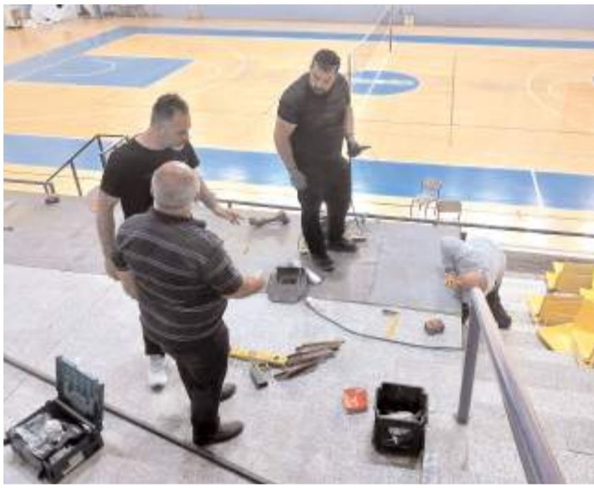
Mahmut Atalay Spor Salonu'na protokol tribünü için ilaveler yapılıyor