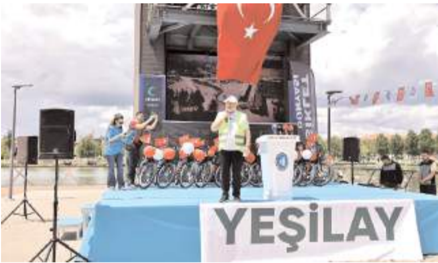
Belediye Başkanı Halil İbrahim Aşgın