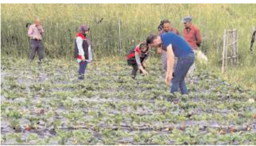
Yapılan kontrollerde üretim aşamalarının organik tarım mevzuatına uygunluğu belirlenirken, üreticilerle teknik konularda bilgi alışverişinde bulunuldu.