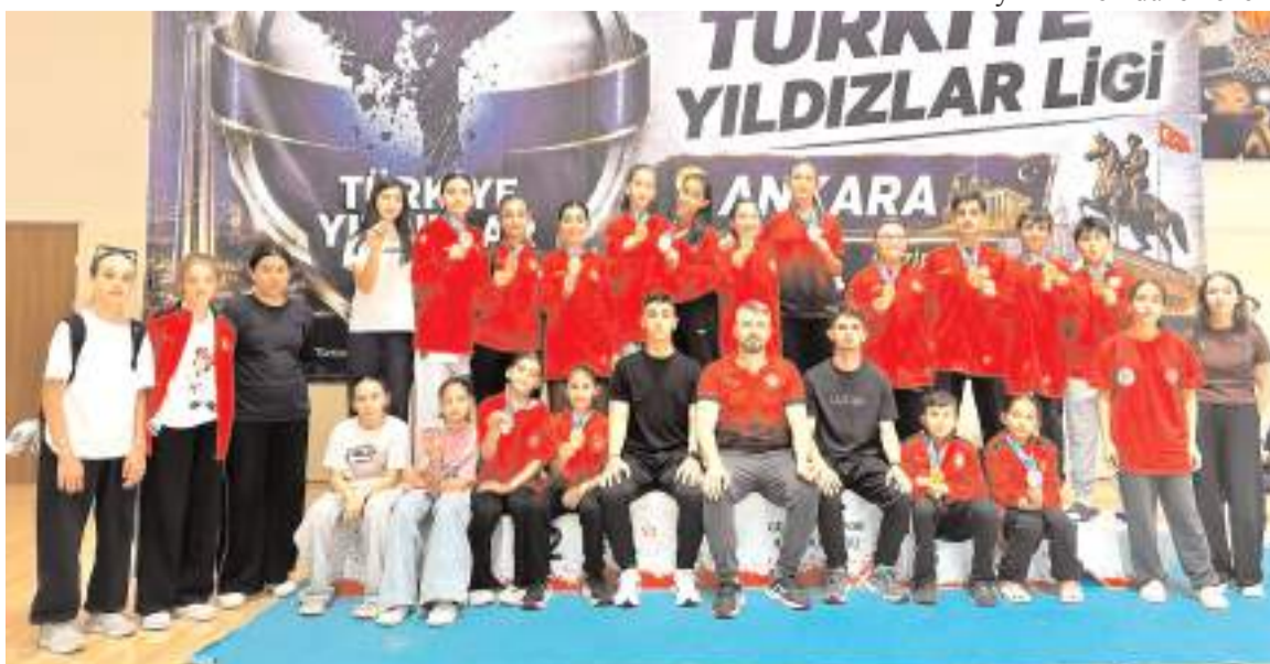
Yıldızlar Karate Liginde madalya kazanan Çorumlu sporcular antrenörleri ile ödül töreni sonrası toplu halde