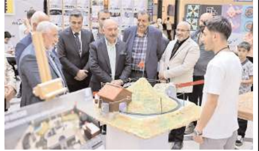
Davettiler sergide yer alan projeleri inceledi.

Yapay zeka projelerinden robotik tasarımlara, yazılım projelerinden mühendislik prototiplerine kadar projenin yer aldığı sergide konuşan Vali Çalgan; Gençlerimizin üretkenliği ve hayal gücüyle ortaya koyduğu bu çalışmalar bizlere büyük bir gurur yaşıyor. Öğrencilerimizi tebrik ediyorum" ifadelerini kullandı