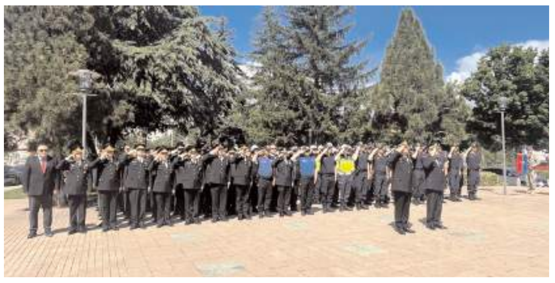
Jandarma Teşkilatı'nın kuruluşunun 187'nci yıl dönümü nedeniyle Atatürk Anıtı'nda tören yapıldı.