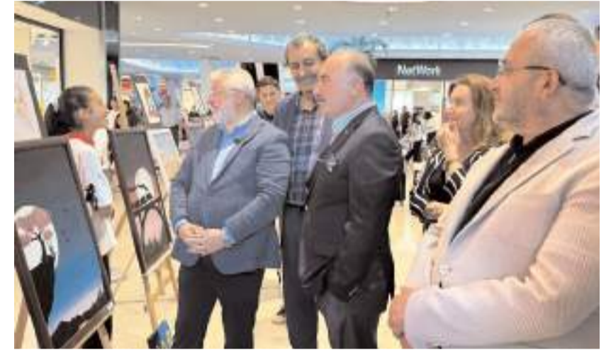
Protokol üyeleri sergiyi gezerek eserleri inceledi.