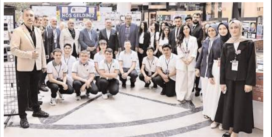
Protokol üyeleri ile öğrenciler hatıra fotoğrafı çekindiler.