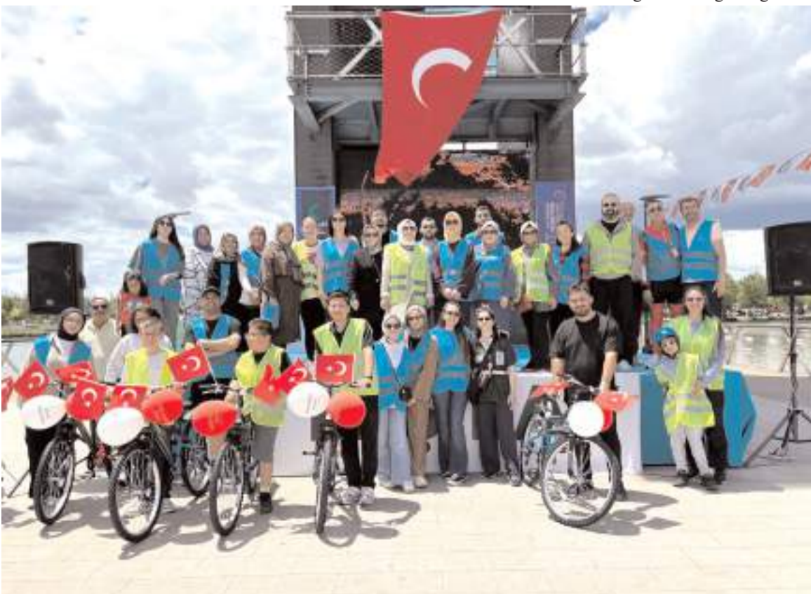
Programın sonunda günün anısına toplu fotoğraf çekildi.