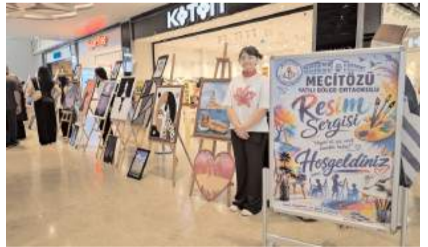
Sergide, 14 kurs öğrencisinin hazırladığı 60 tablo yer alırken, okulda eğitim gören 70 öğrencinin yaptığı duvar süslemeleri ve kağıt çalışmaları yer aldı.