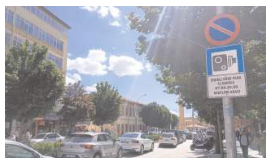
Sürücüler, yolun gidiş yönüne göre en sağ şeritte yer alan sarı çizgiler üzerinde en fazla 15 dakika park edebilecek.