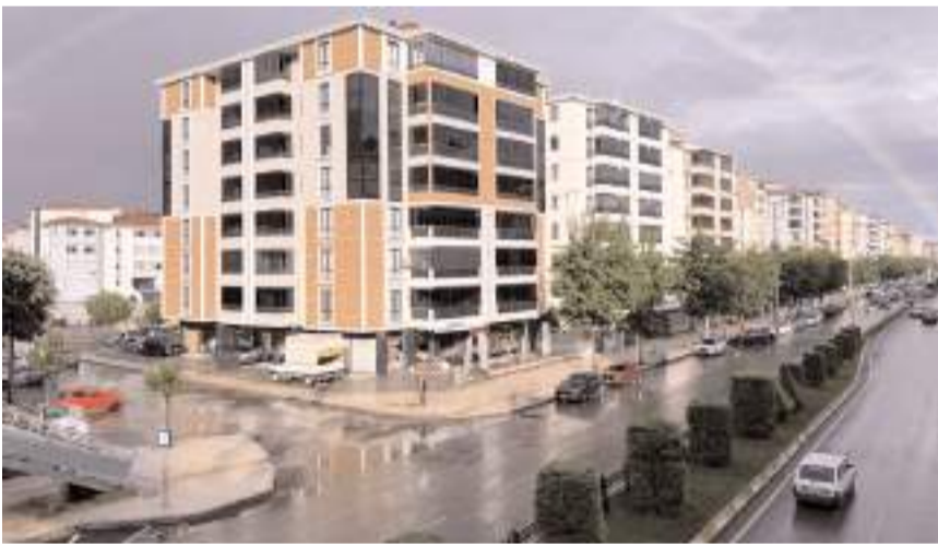
Gökkuşağı kameralara yansdı.

Yağışın ardından beliren gökkuşağı, kentte güzel görüntüler oluşturdu.