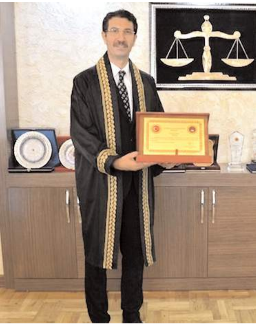
Ömer Güven, Samsun BAM 6. Hukuk Dairesi Üyesi olarak görev yapıyor.

Hâkimler ve Savcılar Kurulu (HSK) kararnameyi doğrultusunda, Samsun BAM 6. Hukuk Dairesi Üyesi Ömer Güven, Çorum Ticaret Mahkemesi Başkanı olarak atandı.