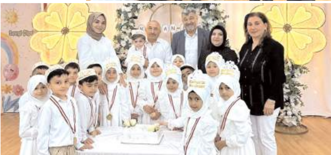
Günün anısına yaş pasta kesildi.