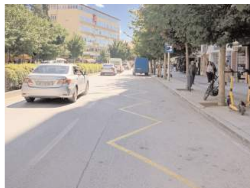
Park yasağının başlaması ile caddelerde boşluklar oluştu.

Yetkililer park yasağına uyulması konusunda sürücülerini uyarırken, park yasağına uymayanlara ise Karayolları Trafik Kanunu kapsamında bin 246 lira idari para cezası uygulanacağı belirtildi.