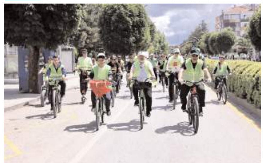
Bisiklet turuna protokol üyeleri de katıldı.