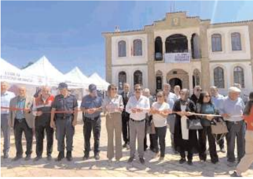
Serginin açılış kurdelesini protokol üyeleri kesti.