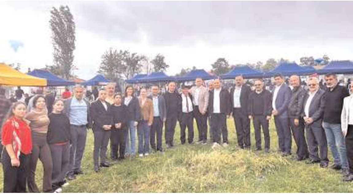
Katılımcılar, mangal yakarak, semaverde çaylar demleyerek, canlı müzik eşliğinde güzel bir gün yaşadı.