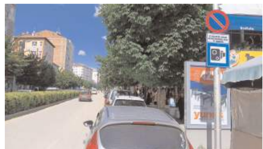
Süreli park yasağı sabah 07.00 ile akşam 20.00 saatleri arasında geçerli olacak.