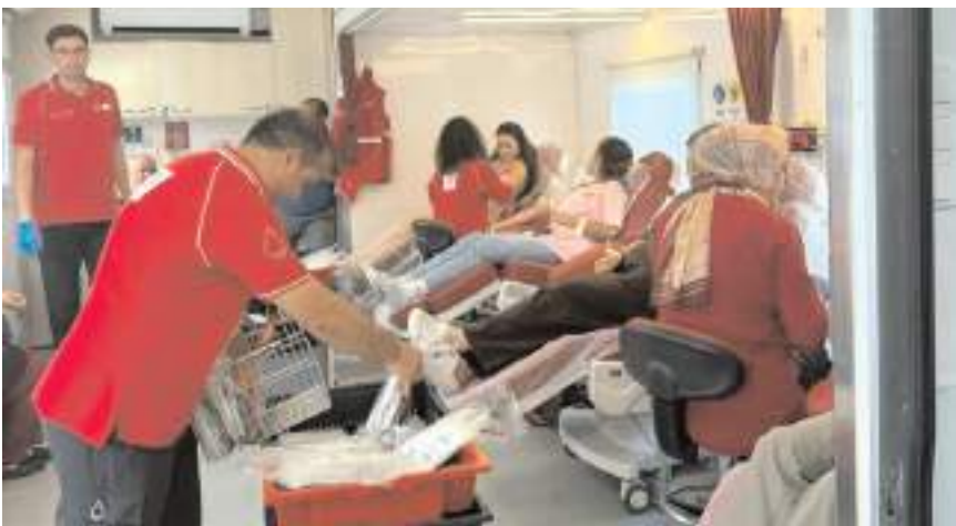
Kan bağıışı kampanyasında 66 ünite bağıış toplandı.

İlçe Millî Eğitim Müdürlüğünden yapılan açıklamada, öğrencilerin gösterdiği duyarlılığın toplumsal dayanışma açısından örnek olduğu belirtilerek, kampanyaya destek veren vatandaşlara teşekkür edildi.(AA)