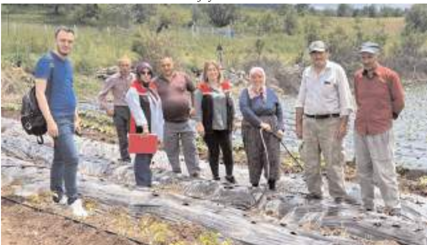
"Örtüaltı Organik Çilek Yetiştiriciliği Demonstrasyon Projesi"ne Çorum'dan da katılım oldu.

Tarım ve Orman İl Müdürlüğü tarafından organik tarım faaliyetlerinin geliştirilmesi, üreticilerin teknik açıdan desteklenmesi ve sürdürülebilir üretim modellerinin yaygınlaştırılması amacıyla saha çalışmaları ve denetimlerin titizlikle sürdürüldüğü belirtildi. (Haber Merkezi)