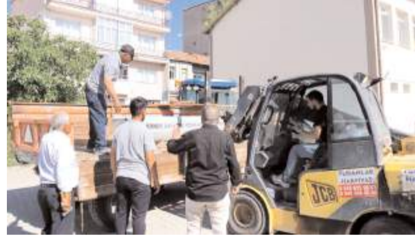
11 merada kullanılmak üzere 55 adet sıvat 11 köy muhtarına törenle teslim edildi.