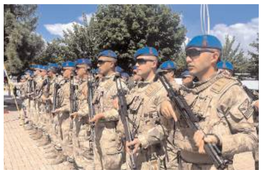
Tören saygı duruşunda bulunulması ve İstiklal Marşı'nın okunmasıyla başladı.