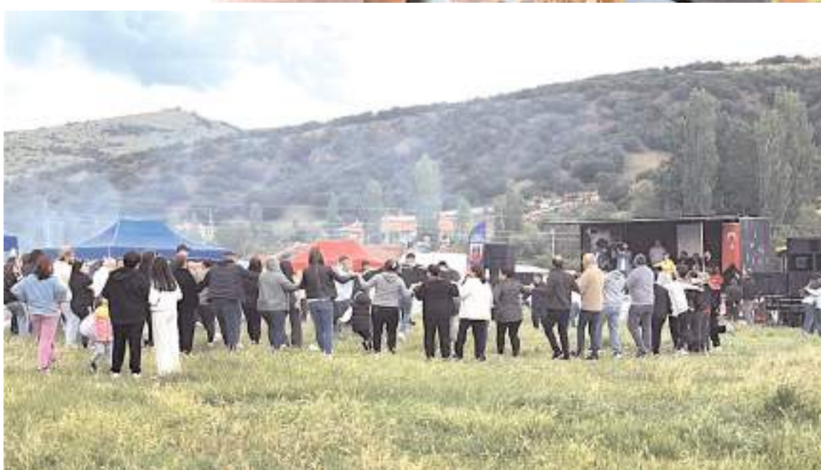
Şenlikte bol bol halay çekildi.