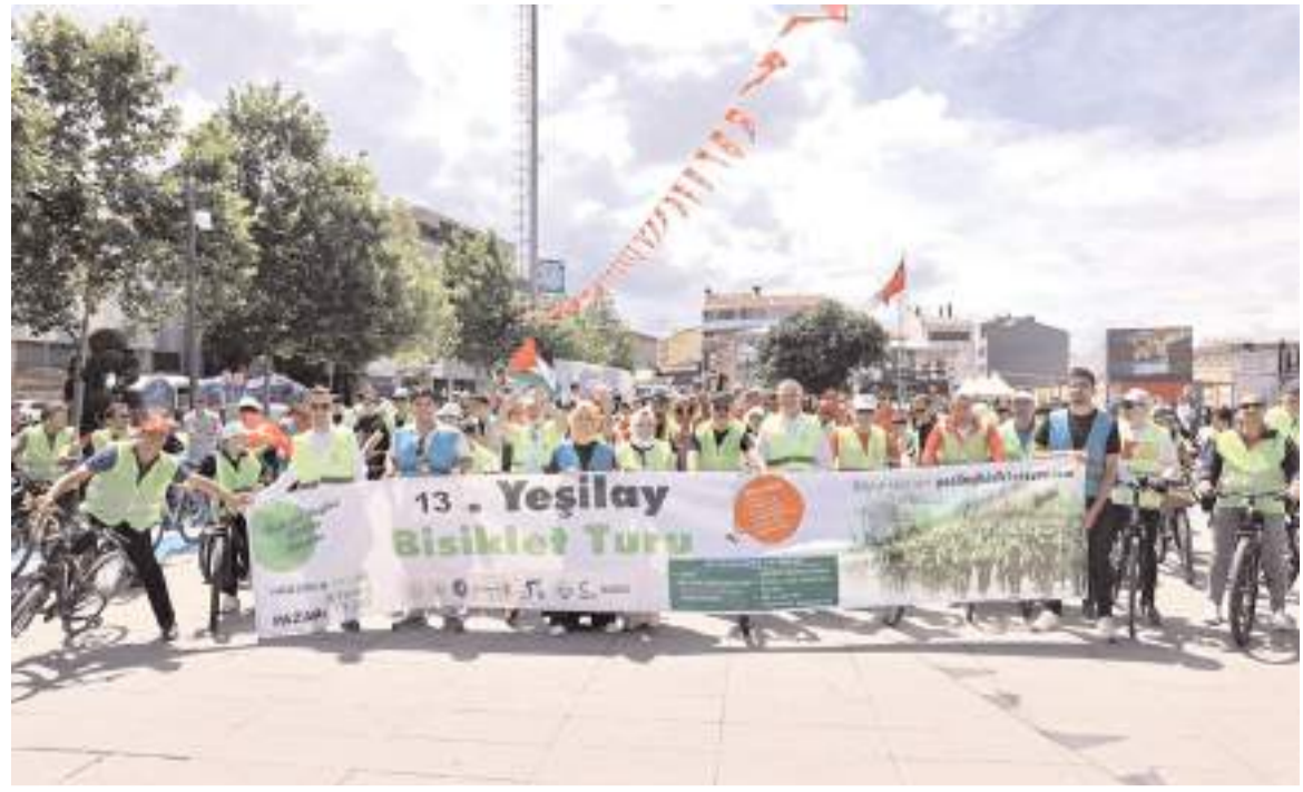
13. Yeşilay Bisiklet Turuna ilgi yüksek oldu.