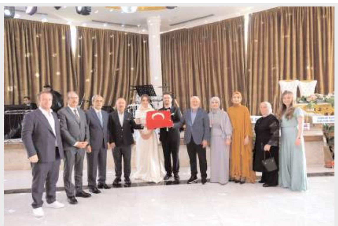
Protokol üyeleri genç çifti tebrik etti.