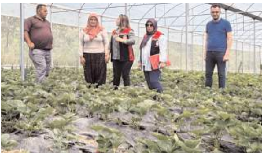
Tarım ve Orman İl Müdürlüğü ekipleri ve yetkilendirilmiş Kontrol ve Sertifikasyon Kuruluşu ekipleri proje kapsamında denetim yaptı.