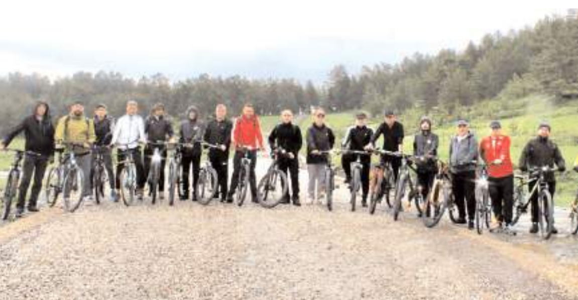
Yalak Yaylası'nda bisiklet turu geleneği bu yıl da devam etti.

Yetkililer, tüm doğa ve bisiklet severleri Yalak Yaylası'nın eşsiz atmosferinde düzenlenecek etkinliklere katılmaya davet etti.