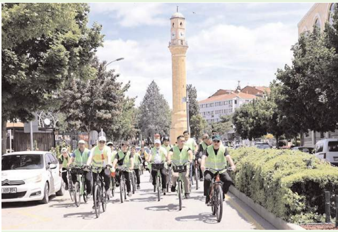
Kadeş Barış Meydanından başlayan bisiklet turu Millet Bahçesinde sona erdi.