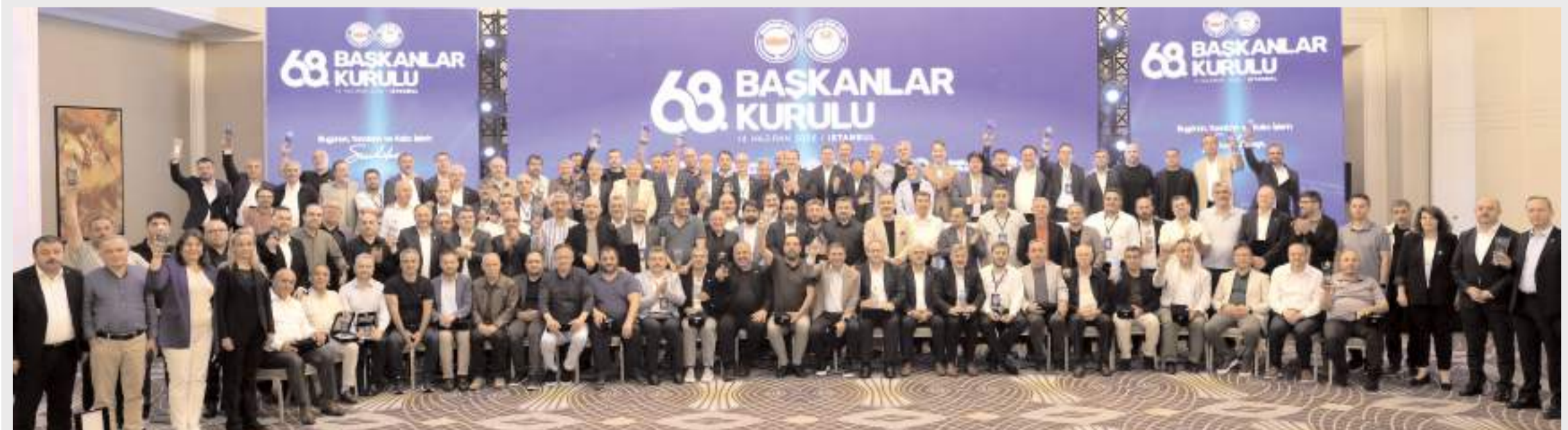
Eğitim-Bir-Sen 68. Başkanlar Kurulu Toplantısının ardından toplu hatıra fotoğrafı çekildi.