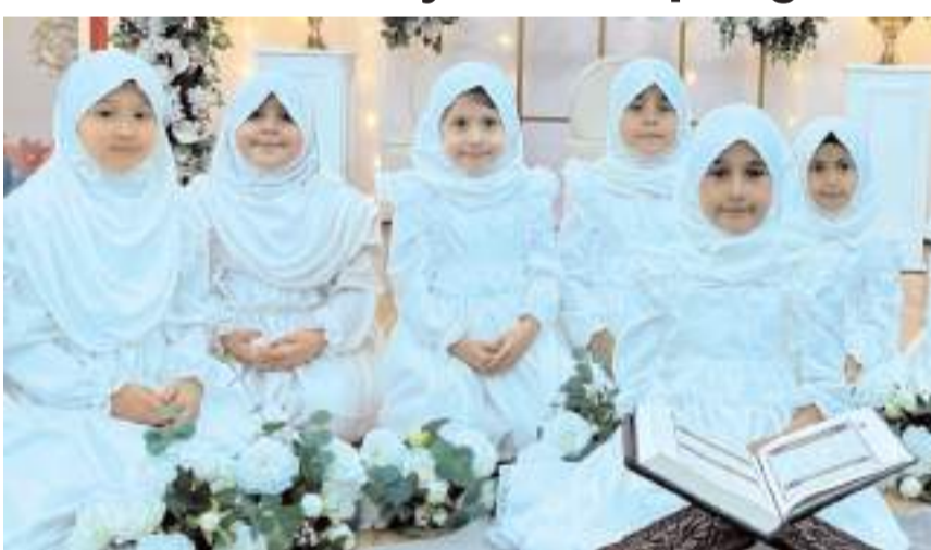
Miniklerin gösterileri bol bol alkış aldı.