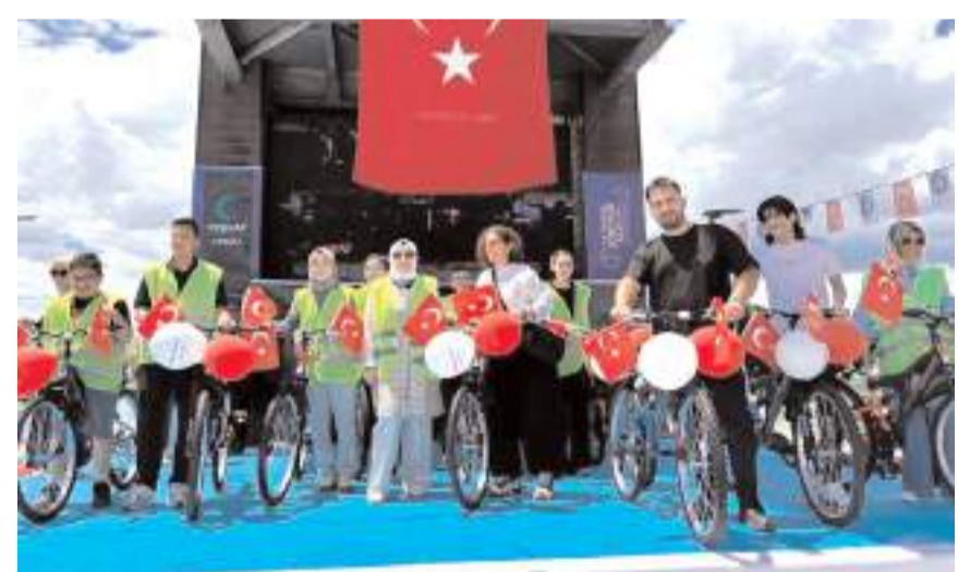
Programda hediye çekilişi yapıldı.

Program, hediye çekilişlerinin ardından sona erdi.