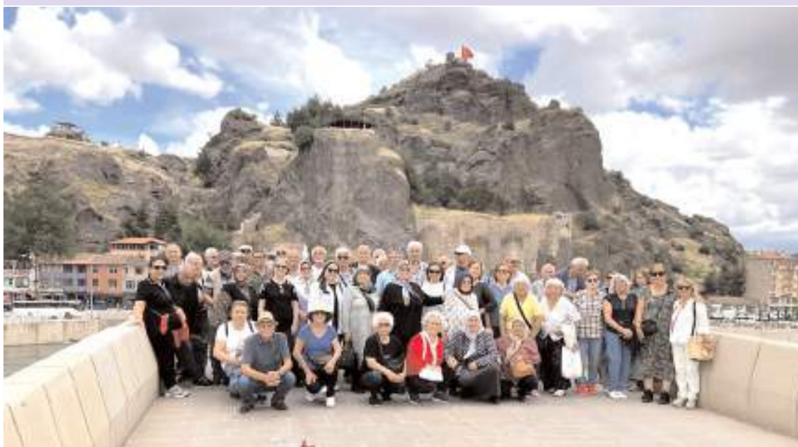
Türkiye'nin çeşitli illerinden gelen mezunlar, 12-14 Haziran tarihleri arasında Çorum'da düzenlenen etkinliklerde bir araya gelerek yarım asırlık dostluklarını tazeledi.