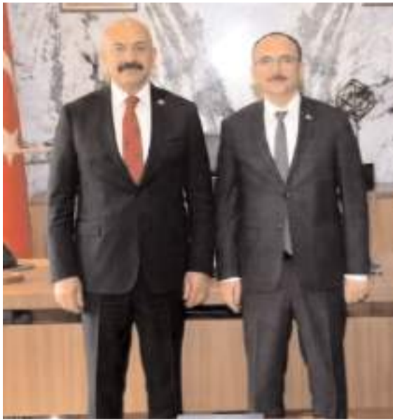
Ziyarete Ortaköy'ün ulaşım projeleri istişare edildi.