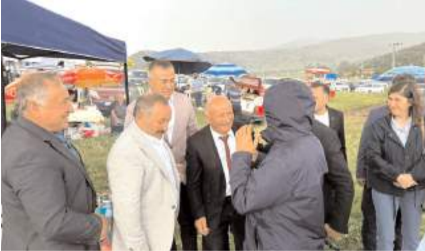
Şenliğe CHP Çorum Milletvekili Mehmet Tahtasız da katıldı.