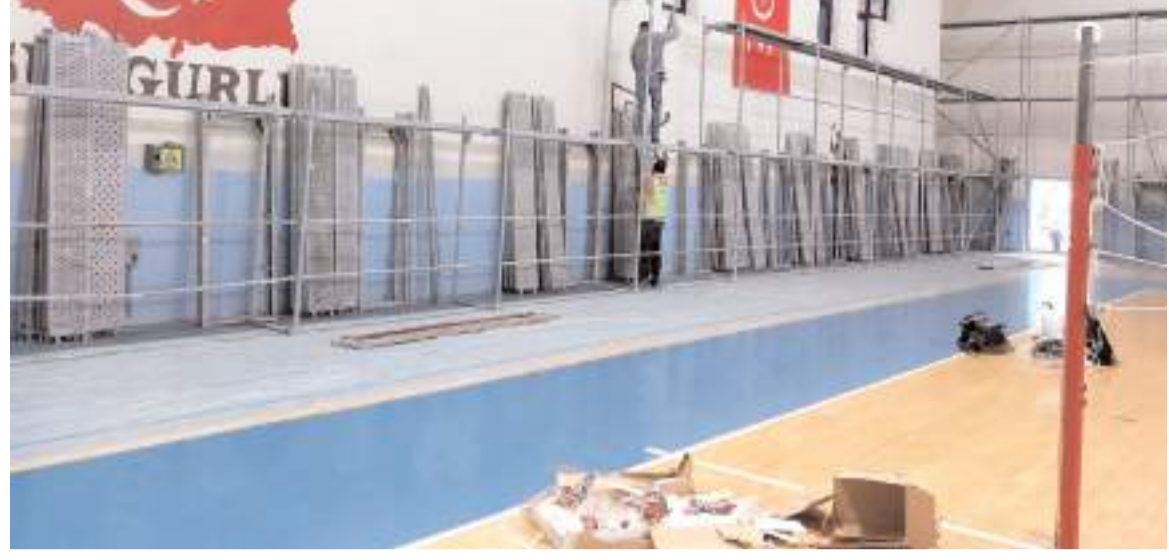
Salonun tüm bölümleri iskele kurularak boya ve badana ile aydınlatma sistemi yenilenecek