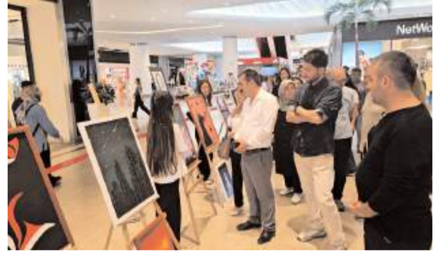
Sergiyi Mecitözü Yatılı Bölge Ortaokulu öğrencileri açtı.