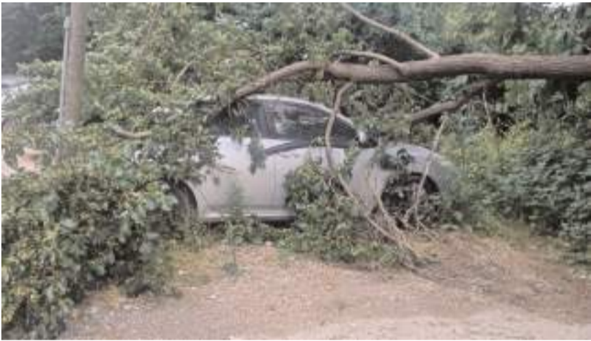
Araçlarda maddi hasar meydana geldi.