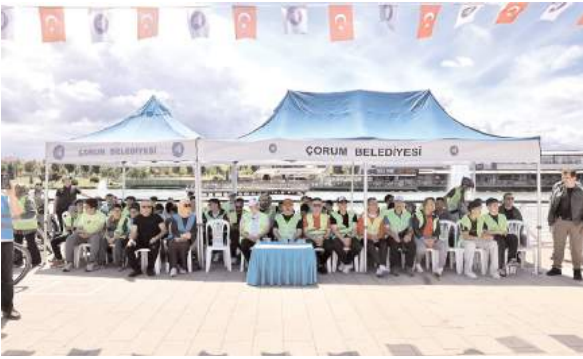
13. Yeşilay Bisiklet Turu öncesinde Kadeş Meydanında tören yapıldı.