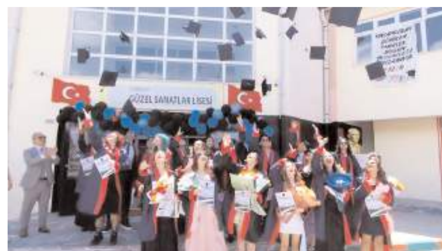
Öğrenciler kep atarak mezuniyetlerini kutladılar.