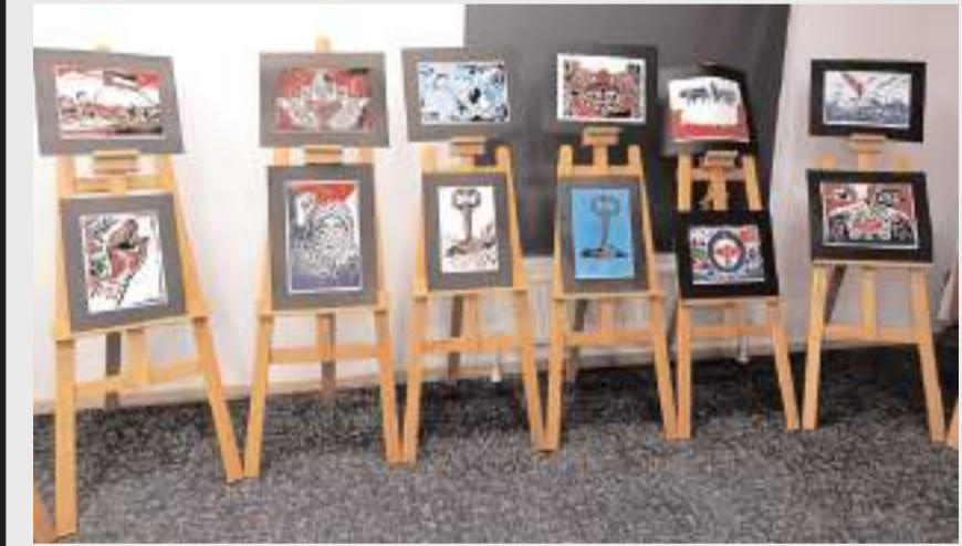
Baskı çalışmaları, düzenlenen sergiyle sanatseverlerin beğenisine sunuldu.