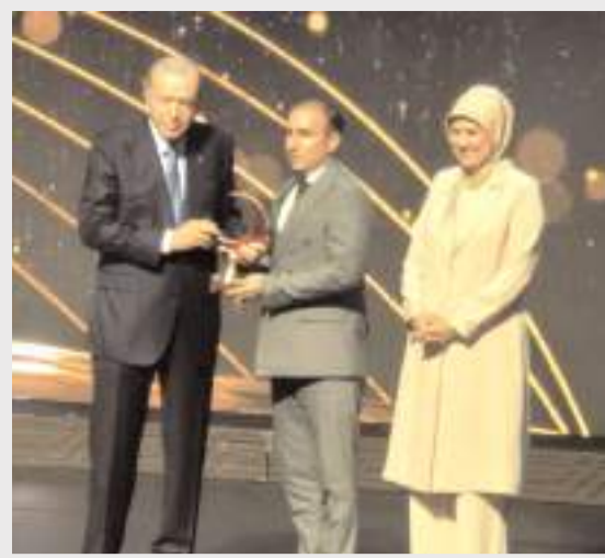
Türk Kızılayı Alaca İlçe Temsilcisi Akif Yurt'a ödülünü Cumhurbaşkanı Recep Tayyip Erdoğan verdi.

Alaca'ya olan sevdalarını ve hizmet kararlılıklarını bir kez daha dile getiren Milletvekili Av. Oğuzhan Kaya, "Alaca'mız için çalışmaya, üretmeye ve projeleri adım adım hayata geçirmeye devam ediyoruz. Söz verdiğimiz gibi, Alaca hak ettiği tüm yatırımları tek tek alacak" diyerek yatırımların ilçeye ve bölge halkına hayırlı olmasını diledi. (Haber Merkezi)