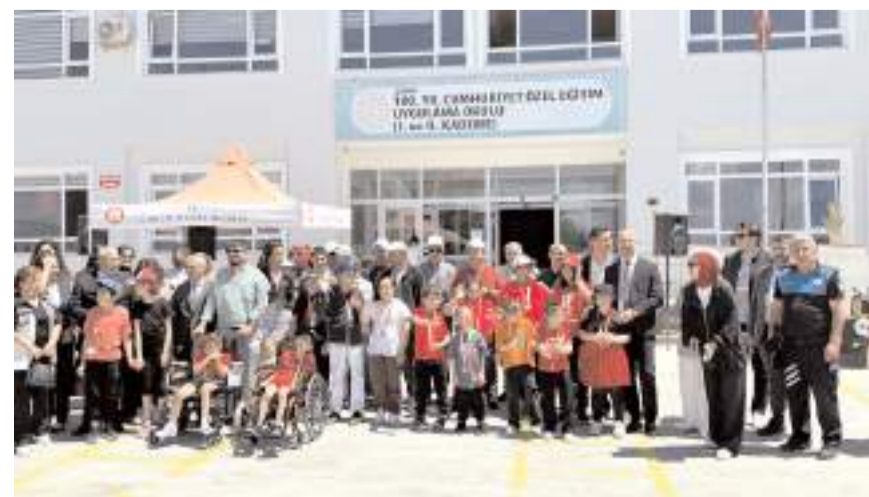
Şenlik 100. Yıl Cumhuriyet Özel Eğitim Uygulama Okulu'nda yapıldı.