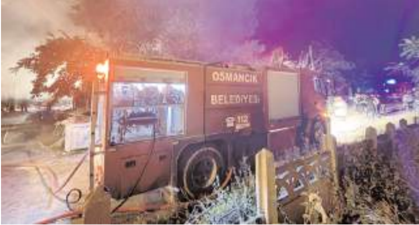
Yangın itfaiye ekipleri tarafından söndürüldü.