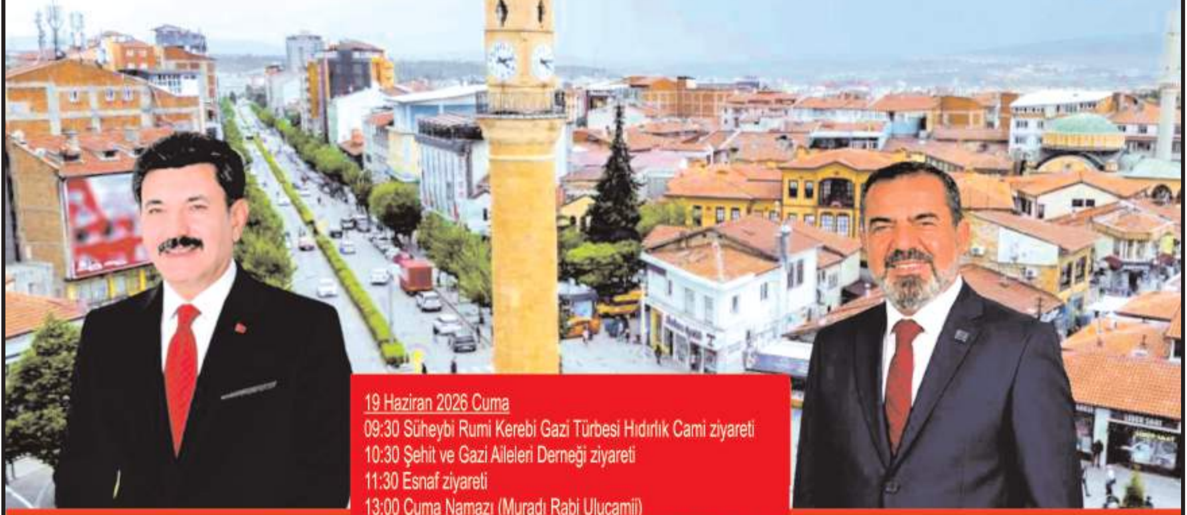
Ferhat Yılmaz Genel Başkan

19 Haziran 2026 Cuma 09:30 Süheybi Rumi Kerebi Gazi Türbesi Hıdırlık Cami ziyareti 10:30 Şehit ve Gazi Aileleri Derneği ziyareti 11:30 Esnaf ziyareti 13:00 Cuma Namazı (Muradı Rabi Ulucamii) 14:00 Çorum Esnaf ve Sanatkarlar Odaları Birliği (ÇESOB) ziyareti 15:30 Çorum Ticaret ve Sanayi Odası (TSO) ziyareti 16:30 Çorum Organize Sanayi Bölgesi (OSB) ziyareti