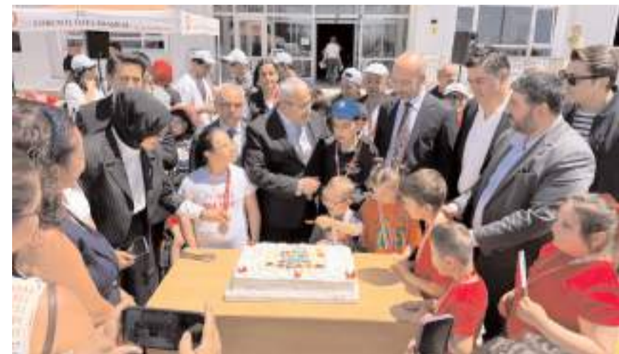
Günün anısına yaş pasta kesildi.

Köpük balon gösterilerinin de gerçekleştirildiği Nefes Engelsiz Çocuk Şenliği, yapılan ikramlar ve pasta kesiminin ardından sona erdi. (Haber Merkezi)