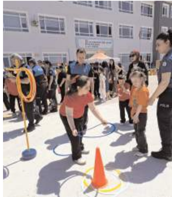
Şenlikte birbirinden eğlenceli yarışmalar yapıldı.