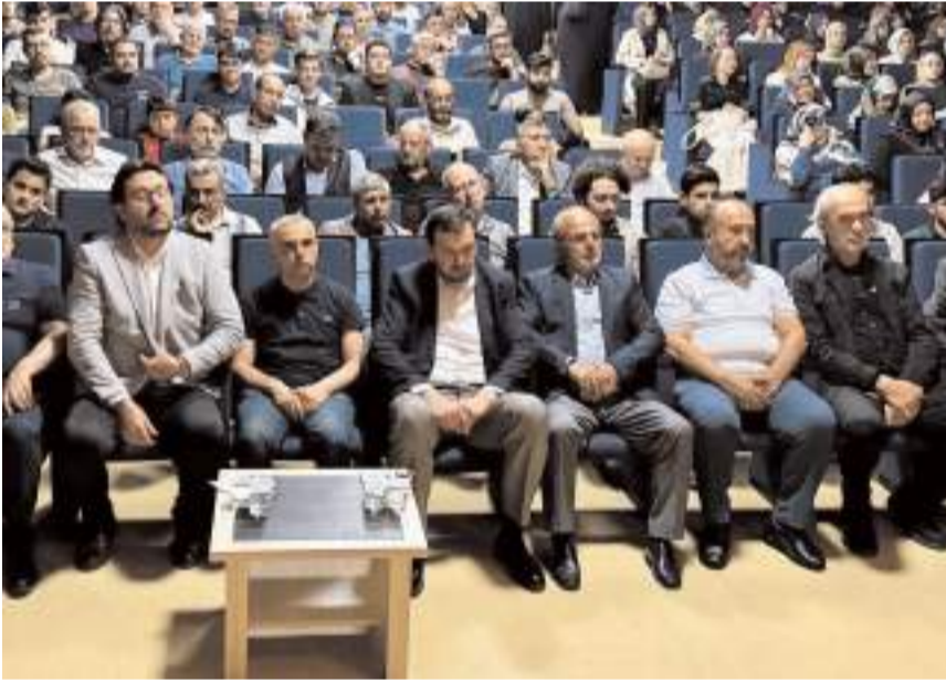
Konferans Buhara Kültür Merkezinde gerçekleştirildi.