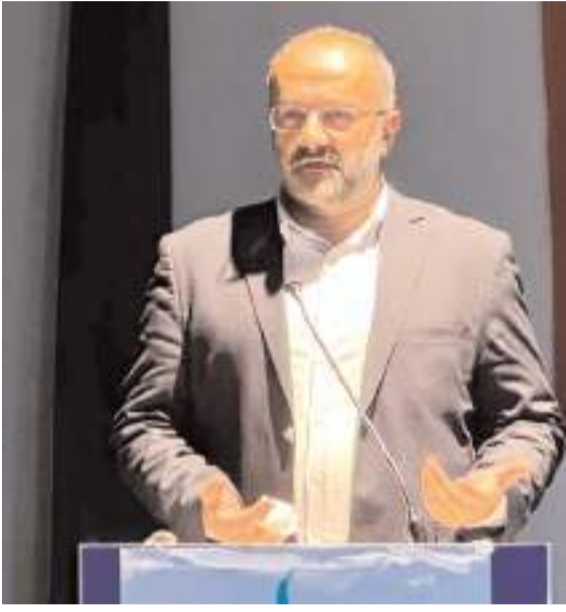
Gazeteci Taha Kılınç