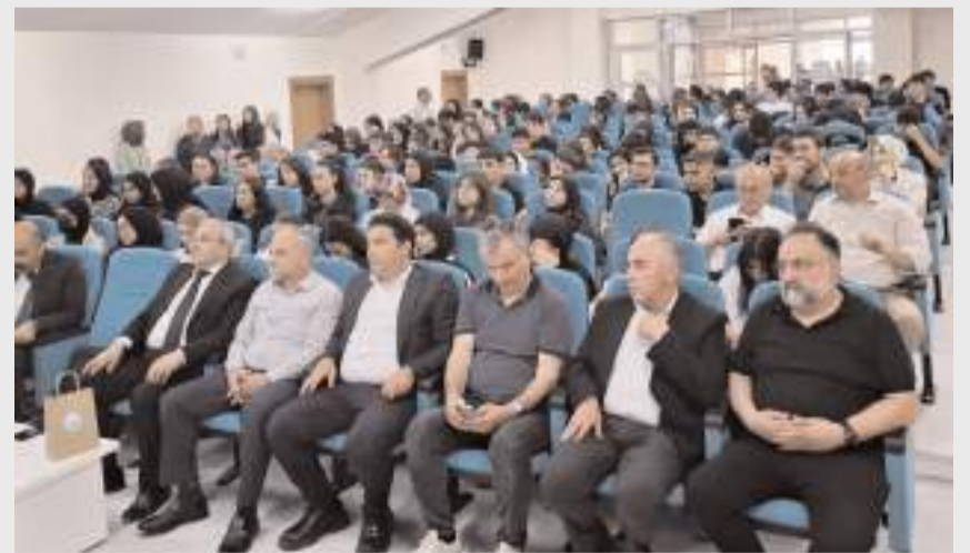
Söyleşiye çok sayıda öğrenci katıldı.