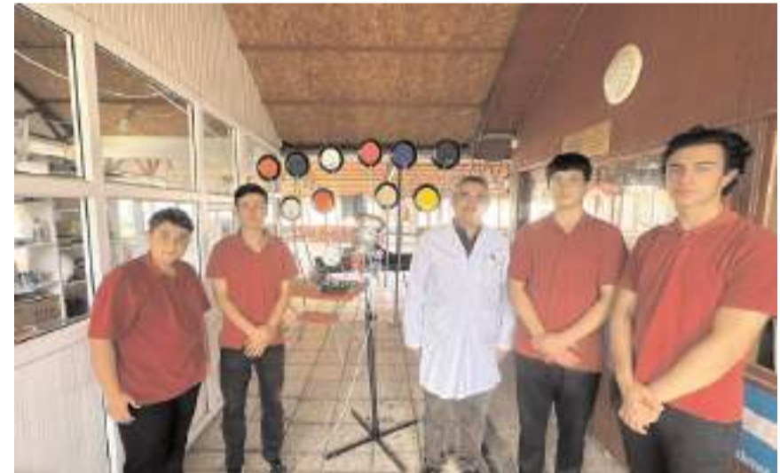
Proje Kargı Çok Programlı Anadolu Lisesi öğrencileri geliştirdi.