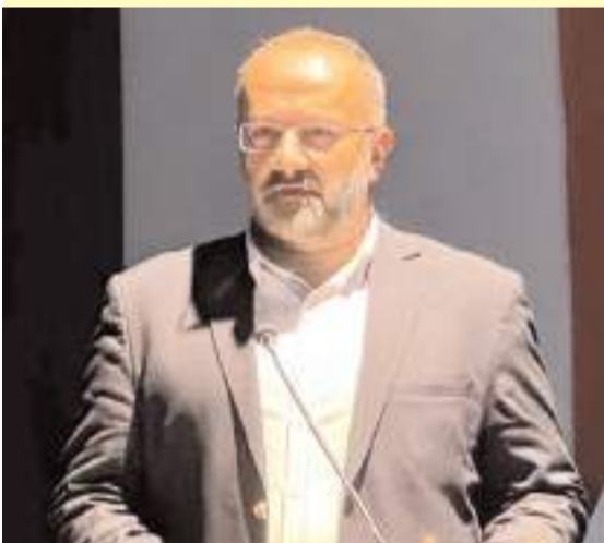
Gazeteci Taha Kılınç