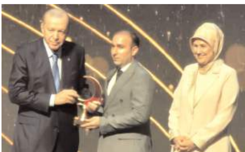
Türk Kızılayı Alaca İlçe Temsilcisi Akif Yurt'a ödülünü Cumhurbaşkanı Recep Tayyip Erdoğan verdi.

Türk Kızılayı Alaca İlçe Temsilcisi Akif Yurt'a ödülünü Cumhurbaşkanı Recep Tayyip Erdoğan'a ödülünü Cumhurbaşkanlığı Külliyesinde Cumhurbaşkanı Recep Tayyip Erdoğan verdi.