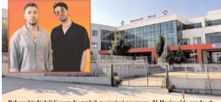
Bahçeşehir Koleji Çorum Kampüsü mezuniyet programı, 21 Haziran'da yapılacak.