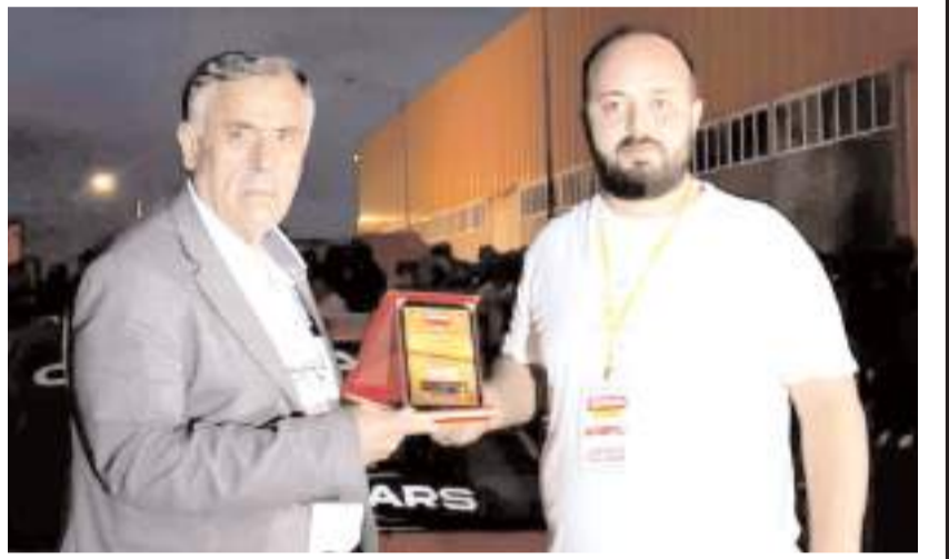
Yarışmalarda derece elde edenlere plaketleri verildi.

Aylarca emek verilerek hazırlanan otomobiller, performansları ve görünüşleriyle ziyaretçilerin beğenisine sunuldu. Katılımcılar araçlarını tanıtmaya fırsatı bulurken, vatandaşlar da sergilenen otomobilleri ya-