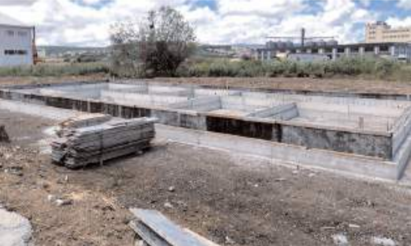
112 Acil Sağlık Hizmetleri İstasyonu Toptancılar Sitesine inşa ediliyor.