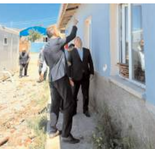
Oyaca köyünde geçtiğimiz ay meydana gelen hortum olayında çok sayıda evde hasar meydana geldi.