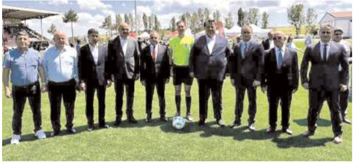
Sahanın açılış törenine katılan protokol üyeleri gösteri maçını yöneten hakem ile birlikte

Sahanın açılış töreni sırasında Çorum Gençlikspor kulübü tarafından ilçede bu yıl içinde yapılan okul spor müsabakalarına katılan 15 okula çeşitli spor malzemeleri dağıtıldı. Gençlikspor kulübü tarafından 15 okula değişik branşlarda kullanılan spor malzemeleri okul idarecilerine açılışa katılan protokol üyeleri tarafından verildi.