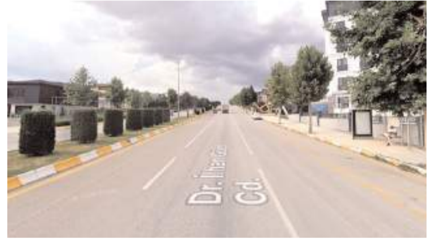
Bölgede yaşayan vatandaşlar durak talebini dile getirdiler.