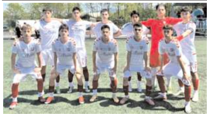
Samsun Kadıköyspor bugün Çorum'da final grubuna yükselmek için mücadele edecek

Eşleşmede, ilk maçlar 23 Temmuz'da, rövanşları ise 30 Temmuz'da yapılacak.