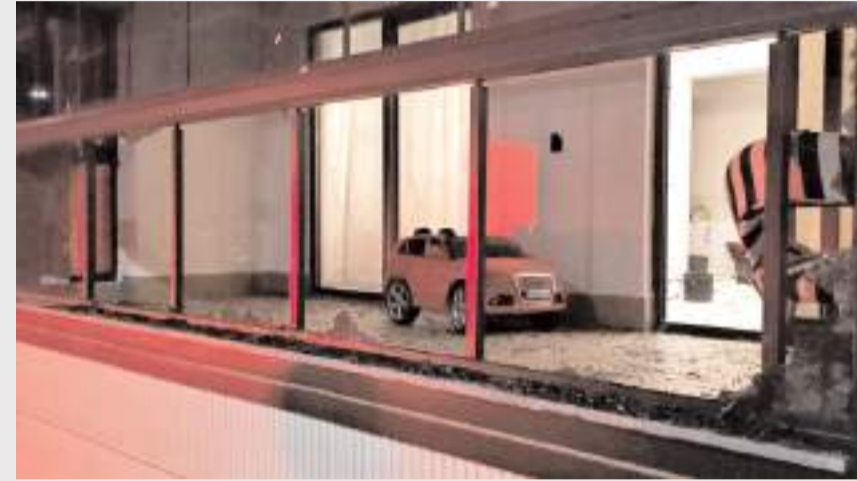
Olay Bahçelievler Mahallesi Şenyurt 6. Sokak'ta meydana geldi.