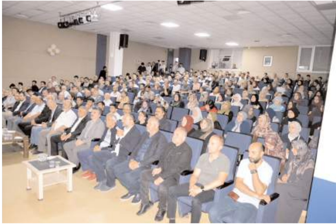
Konferansa ilgi yüksek oldu.

Kılınç, bölgede dini kimliğin dönüştürülmesine yönelik uygulamaların da dikkat çektiğini belirterek, çeşitli propaganda faaliyetleriyle insanların