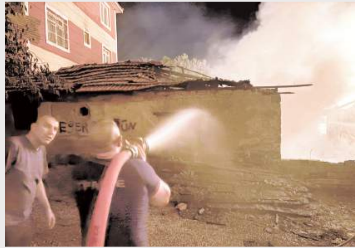
Olay Kaleli Hoca Sokak'ta meydana geldi.