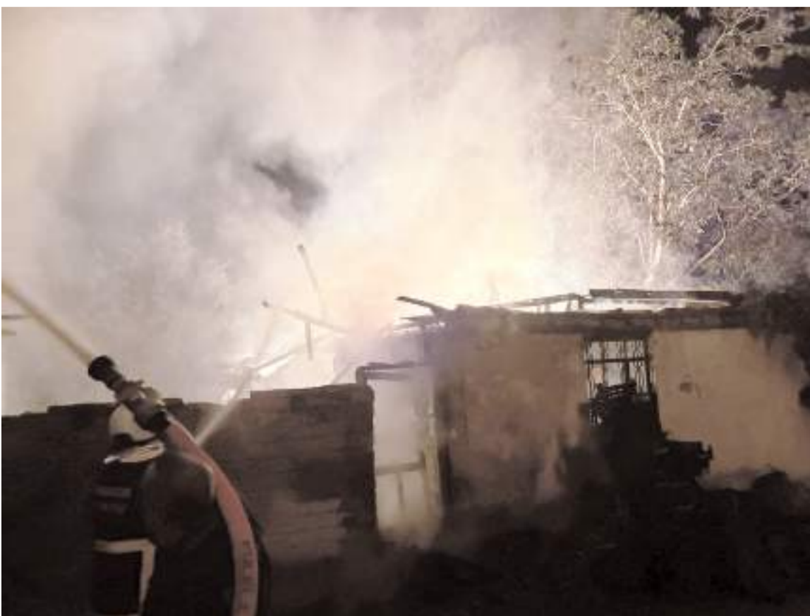
Yangında ev kullanılmaz hale geldi.