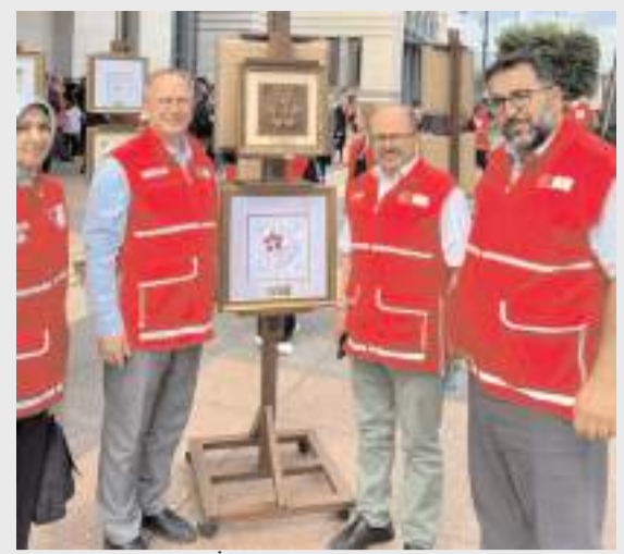
"11 Haziran - İyilikle Açan Çiçekler" sergisine Çorum'dan da katılım oldu.