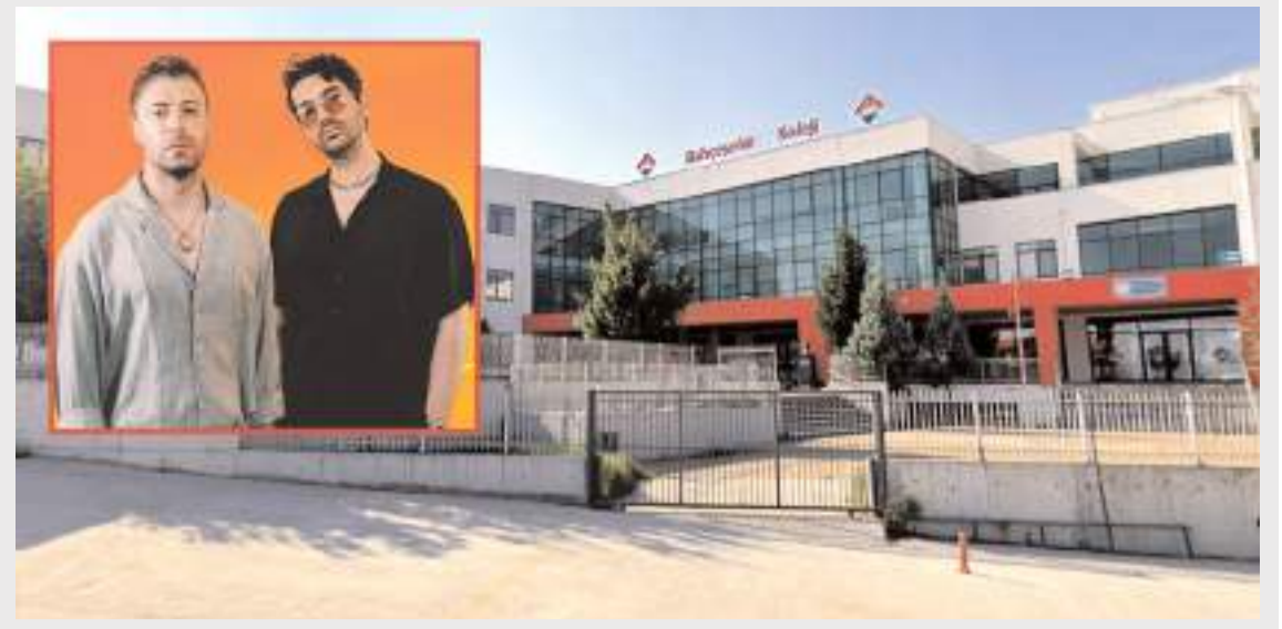
Bahçeşehir Koleji Çorum Kampüsü mezuniyet programı, 21 Haziran'da yapılacak.

2019 yılında Türk İdareciler Derneği tarafından, Hozat Kaymakamlığı döneminde tarım alanında yaptığı projeler dolayısıyla Yılın Kaymakamı seçilerek, Şehit Kaymakam Ersin ATEŞ Üstün Hizmet Ödülünü almış, Kızıltepe Kaymakamlığı ve Belediye Başkan Vekilliği döneminde yaptığı başarılı çalışmalar nedeniyle de çeşitli kuruluşlar tarafından 'Mezopotamya'nın Enleri Yılın Kaymakamı' ile 'Spora Destek Veren Yılın Yerel Yöneticisi' ödülleriyle layık görülen ÇAM, evli ve 3 çocuk babasıdır. (Haber Merkezi)