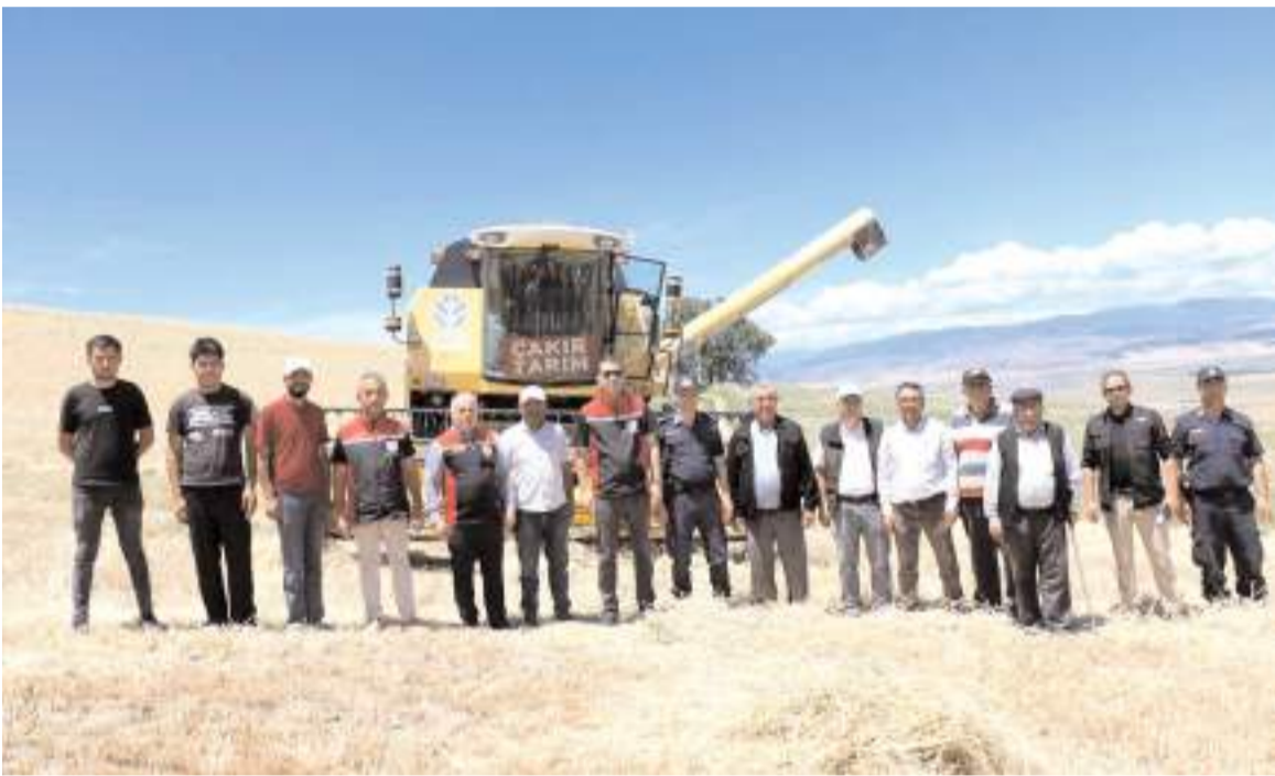
Boztepe köyünde yılın ilk arpa hasadı gerçekleştirildi.

Tekerciođlu, katılım sağlayacak herkesten yanında sadece Türk bayrağı getirmesini istedi. (Haber Merkezi)