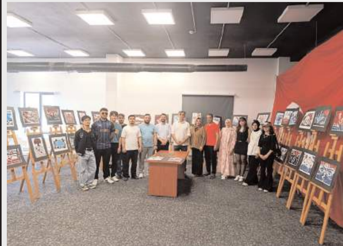
Sergiyi Hitit Üniversitesi İskilip Meslek Yüksekokulu öğrencileri açtı.