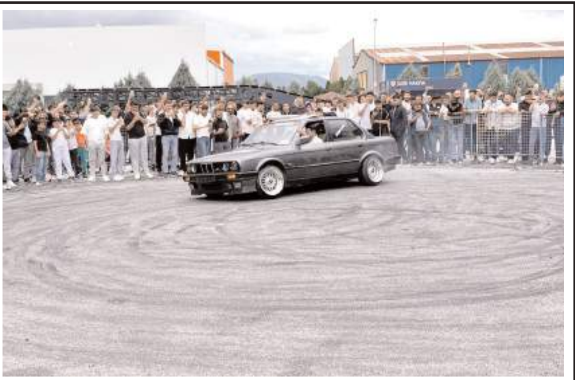
Çorum Autofest, Çorum Sanayi Sitesi'nde yapıldı.

Program kapsamında gerçekleştirilen ilk arpa hasat çalışmaları yerinde incelenirken, üreticilerin emek ve gayretlerinin ülkemiz tarımına önemli katkılar sunduđu vurgulandı. (Haber Merkezi)