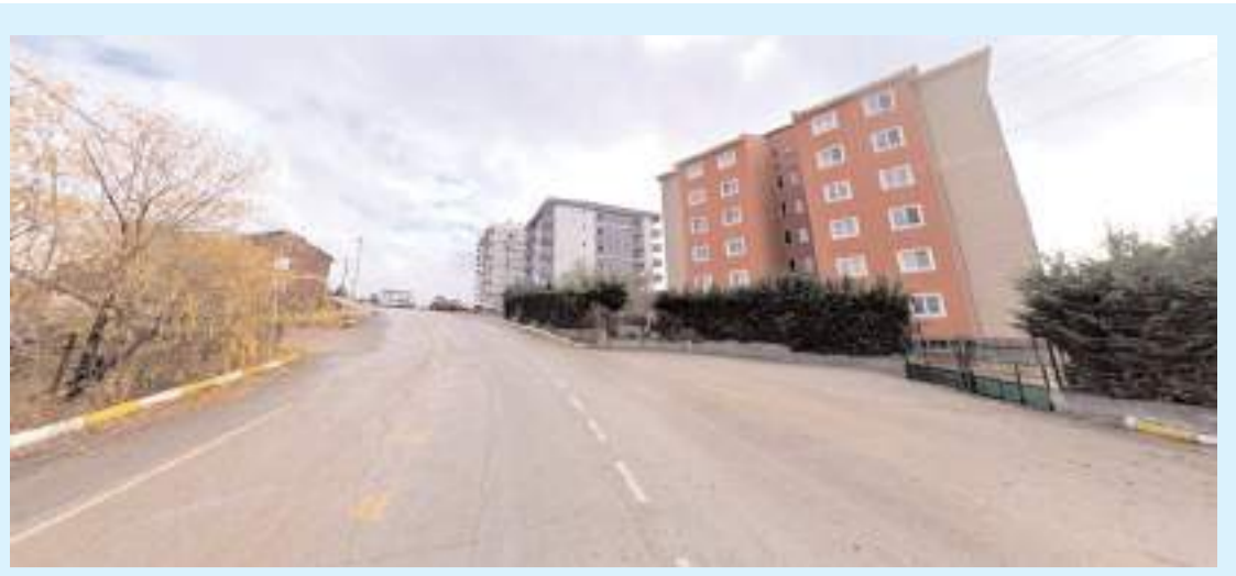
Vatandaşların durak istedikleri yer...