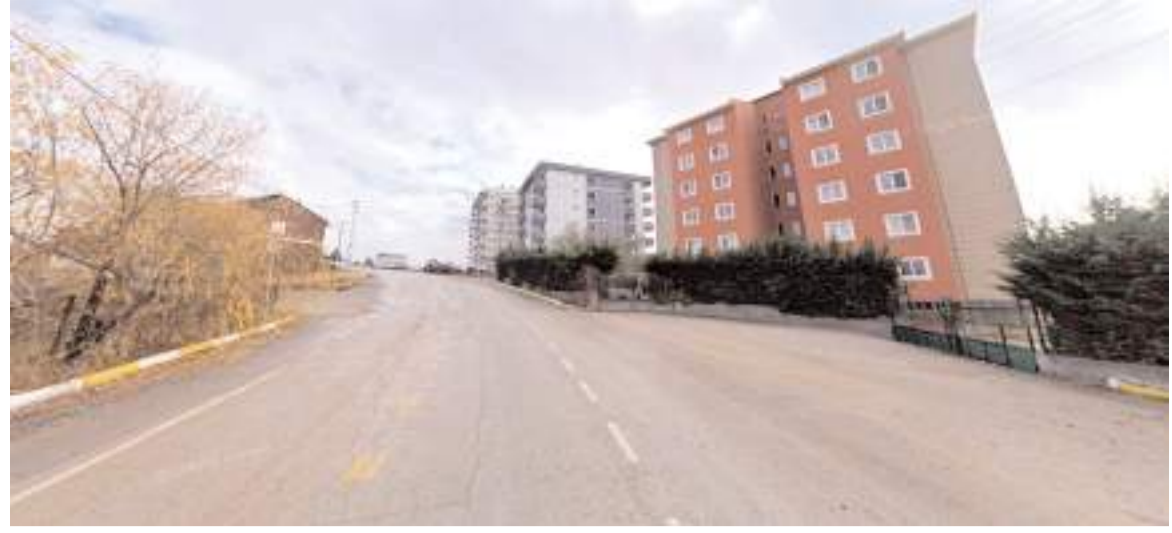
Vatandaşların durak istedikleri yer...