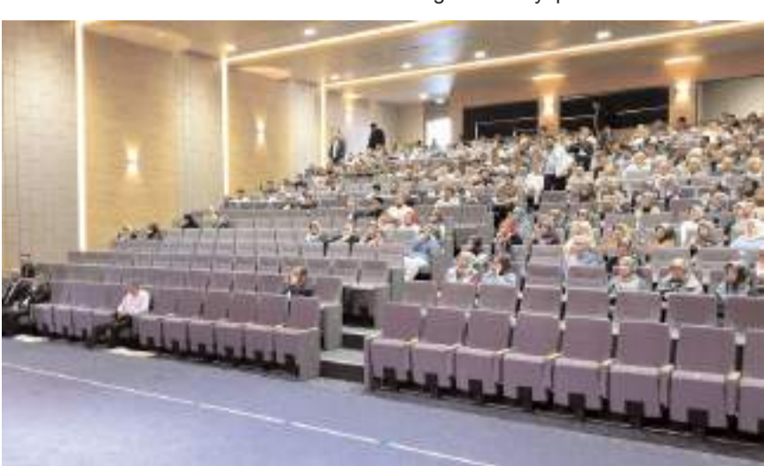
Eğitim semineri TSO Konferans Salonunda gerçekleştirildi.