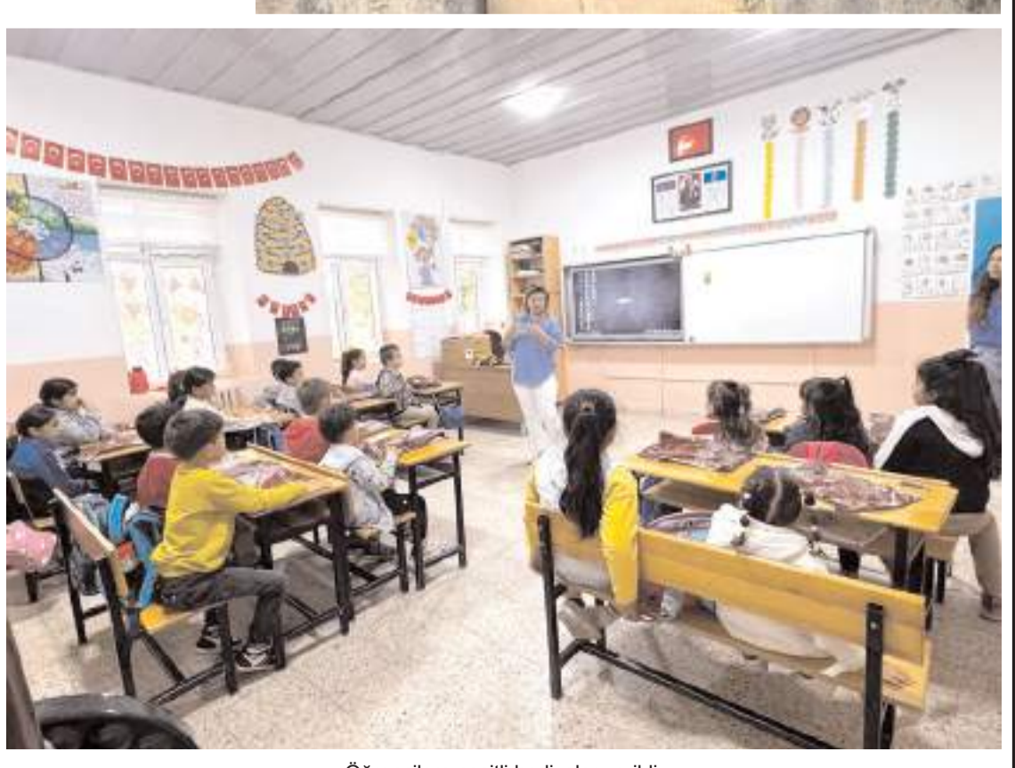
Öğrencilere çeşitli hediyeler verildi.