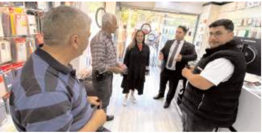
İYİ Parti heyeti esnafları ziyaret etti.