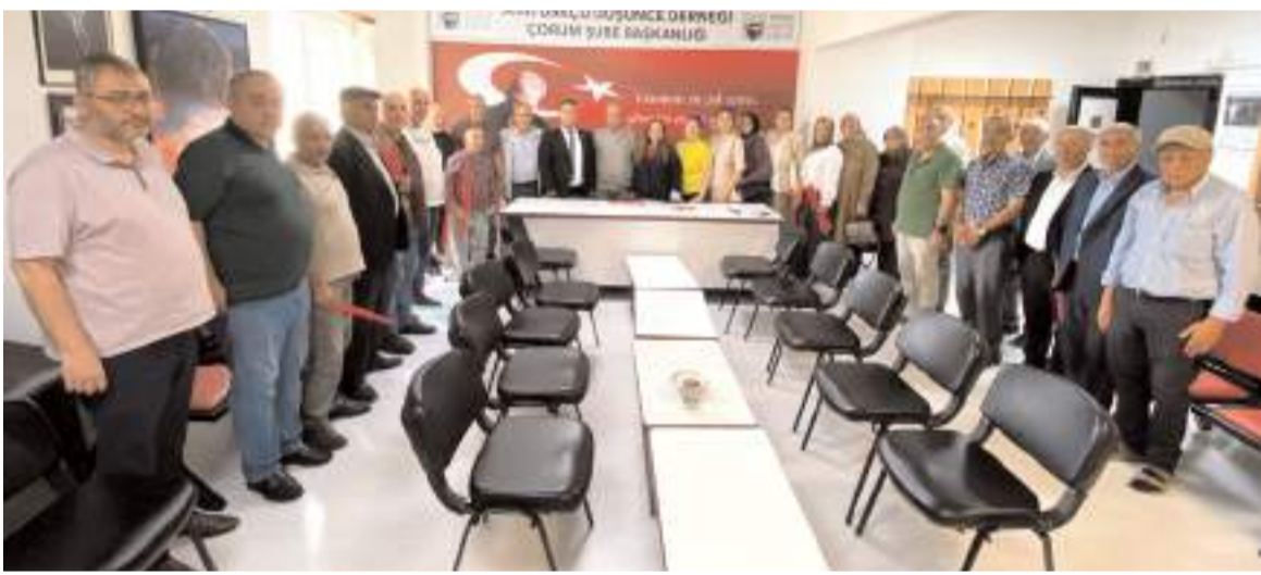
İYİ Parti heyeti ADD Çorum Şubesi'ni ziyaret etti.