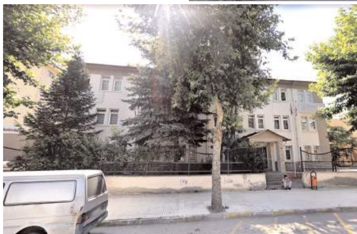
Gazi Aile Sağlığı Merkezi binası yıkılıp yeniden yapılacak.