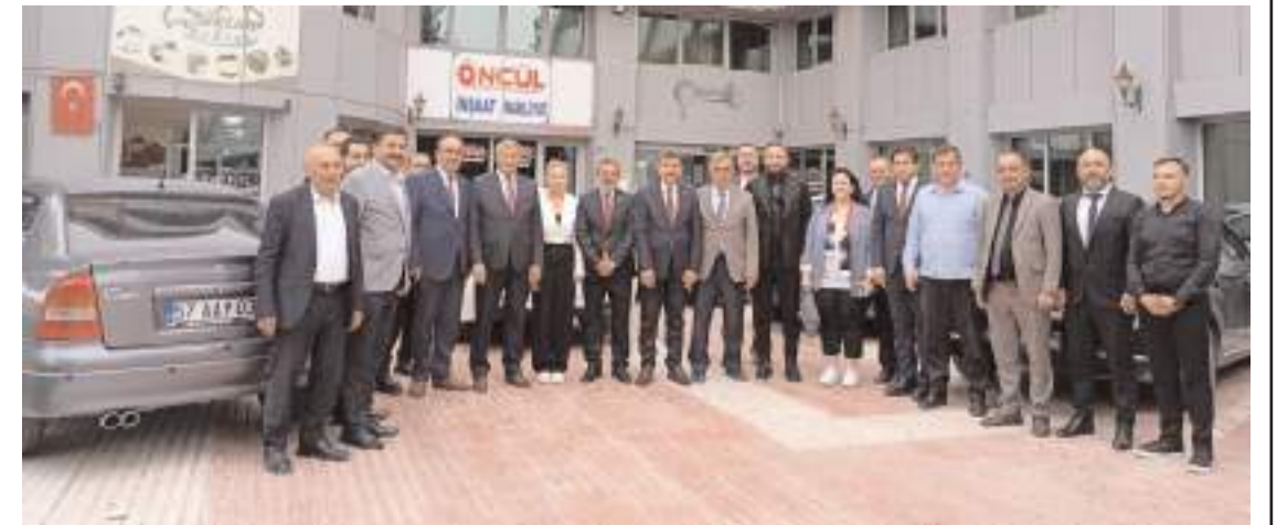
Türkiye İttifakı Partisi Genel Başkanı Ferhat Yılmaz, ÇESOB'u ziyaret etti.