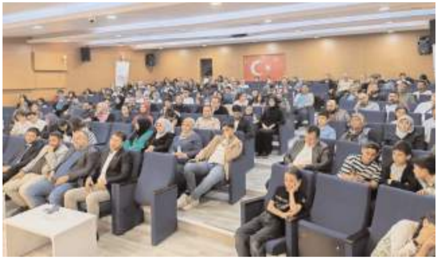
Ödül töreni Turgut Özal Konferans Salonunda yapıldı.