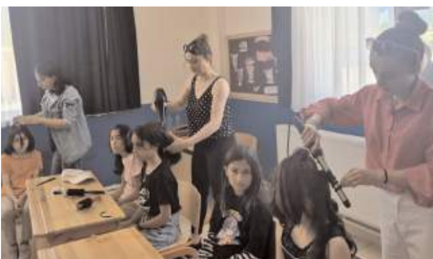
Öğrenciler kursiyerlere teşekkür etti.