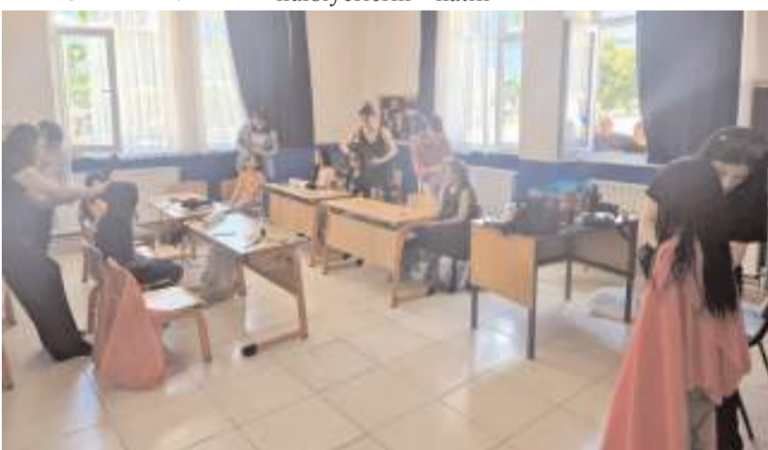
Etkinlik İbek Şehit Osman Aydoğdu İlkokulu ve Ortaokulu'nda düzenlendi.