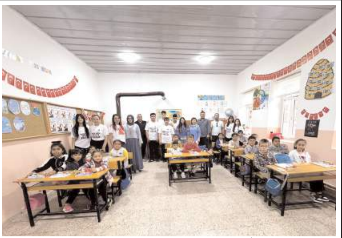
Hasanpaşa Ticaret Mesleki ve Teknik Anadolu Lisesi öğrencileri, Konaklı İlkokulu'nu ziyaret etti.