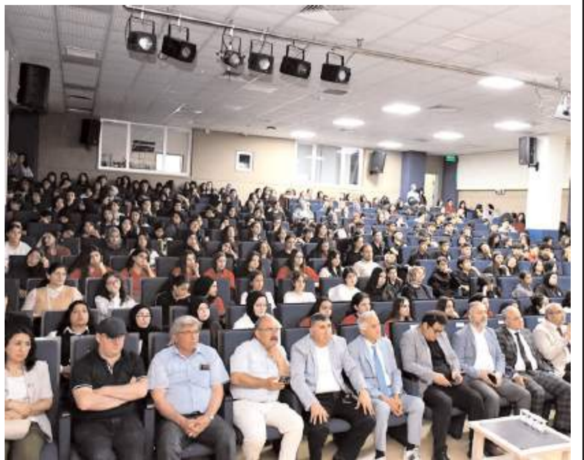
Panelde katılım yüksek oldu.

köklü mirasıyla buluşturmak ve onları edebiyat, sanat ve yüksek ahlak değerleriyle geleceğe hazırlamak olduğu vurgulanan programda, emeği geçen yönetici, öğretmen ve öğrencilere teşekkür edildi.