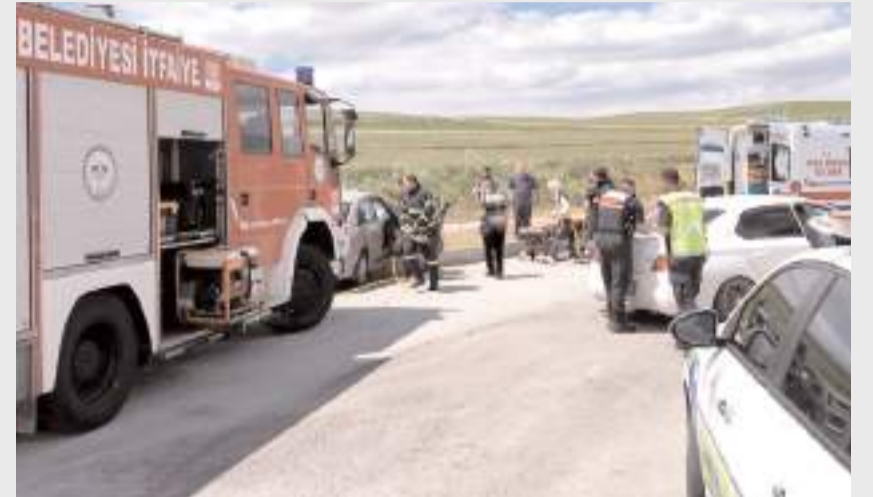
Kaza, Alaca ilçesi Alaca-Sungurlu karayolu Eskiyaşar köyü kavşağında meydana geldi.