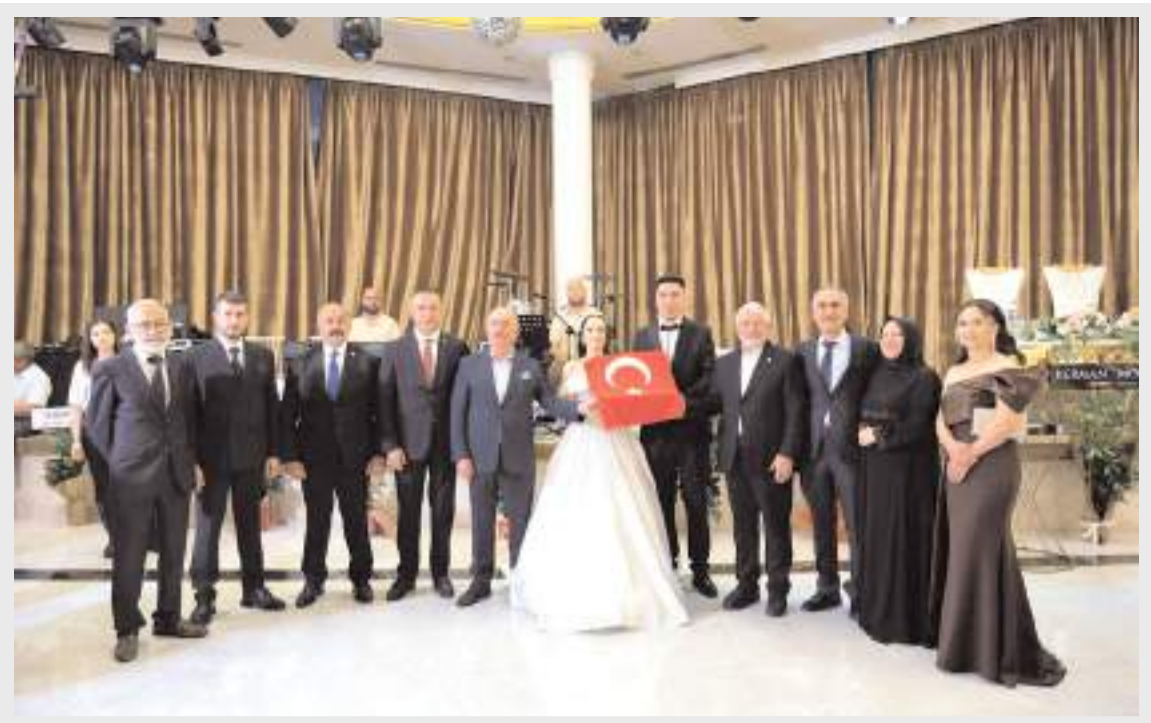
Genç çiftin düğünü Altınkaya Arena Düğün Salonunda yapıldı.