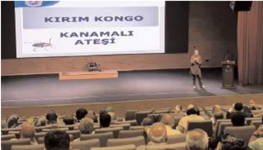
Personele farklı konularda bilgilendirme yapıldı.