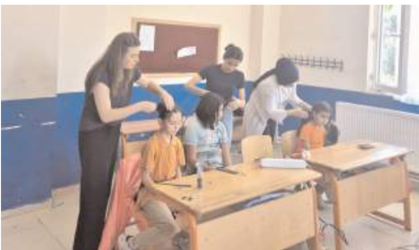
Kursiyerler öğrencilerin saçlarını yaptı.