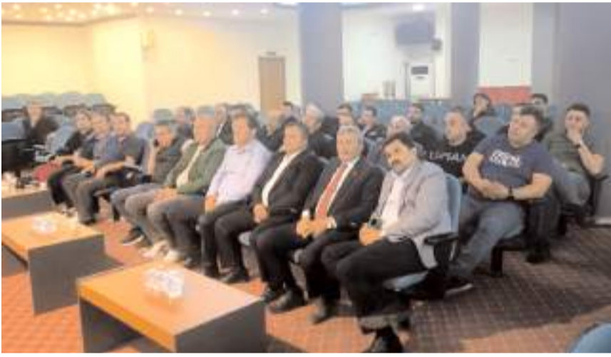
Kooperatifin gelir-gider bilançoları okunarak oy birliği ile ibra edildi.