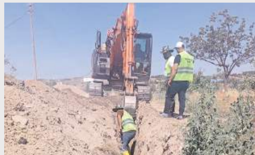
Proje kapsamında 17 bin 210 metrelik 4. etap çalışmaları başladı.