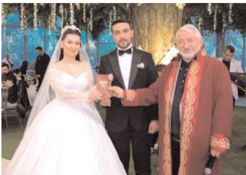
Belediye Başkanı Halil İbrahim Aşgın, genç çifte ömür boyu mutluluklar diledi.