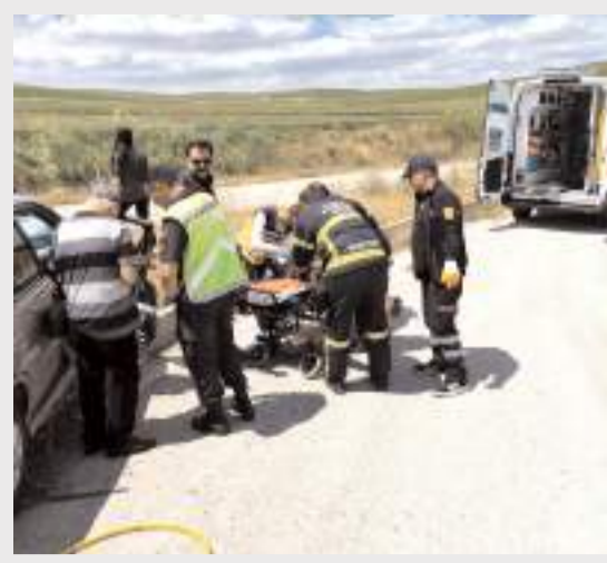
Olay yerine gelen sağlık ekipleri tarafından ilk müdahalesi yapılan yaralı, hastaneye kaldırıldı.