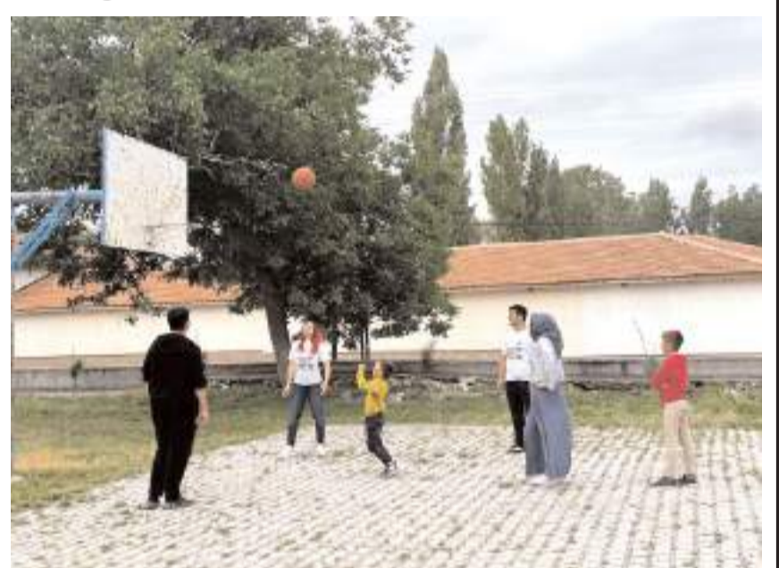
Ziyarette çeşitli oyunlar oynandı.

Etkinlik kapsamında çeşitli hediyeler de öğrencilere ulaştırıldı. Hem Hasanpaşa Ticaret MTAL öğrencileri hem de Konaklı İlkokulu öğrencileri için unutulmaz anlara sahne olan ziyaret, birlik, dayanışma ve kardeşlik duygularının güçlenmesine katkı sağladı.