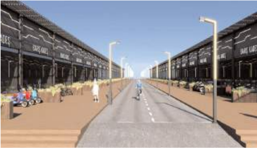
Proje kapsamında 11 bin 400 metrekarelik alana 96 iş yeri inşa ediliyor.