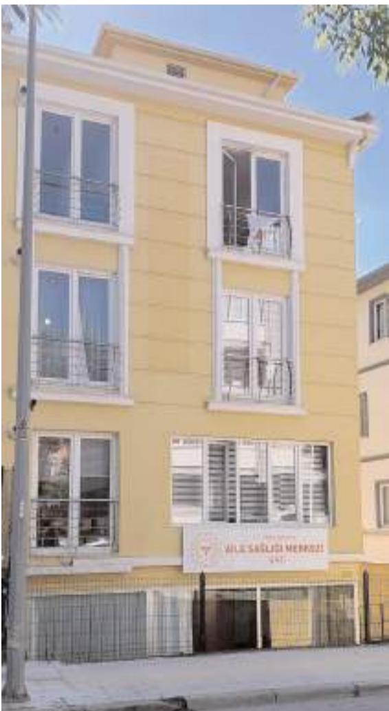
Gazi Aile Sağlığı Merkezi Anadolu 5. Sokak'taki binasında hizmet verecek.

■ Çorum'un İskilip ilçesinde kamyona arkadan çarpan motosikletin sürücüsü hayatını kaybetti. * HABERİ 5'TE