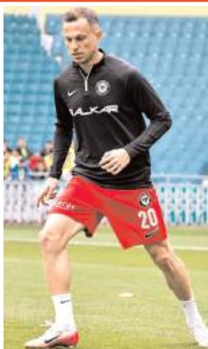
Geçtiğimiz sezon Çorum FK formasıyla 1. Lig'de 35 karşılaşmada 4 gol ve 6 asistlik performans sergileyerek takımına önemli katkı sağladı.

İzmir temsilcisinin, Çorum FK ile Haziran 2027'ye kadar sözleşmesi bulunan 33 yaşındaki futbolcuyla her konuda anlaşma sağladığı öğrenildi. Kulüpler arasındaki son görüşmelerin de olumlu sonuçlanması halinde transferin kısa süre içerisinde resmîyet kazanması bekleniyor.