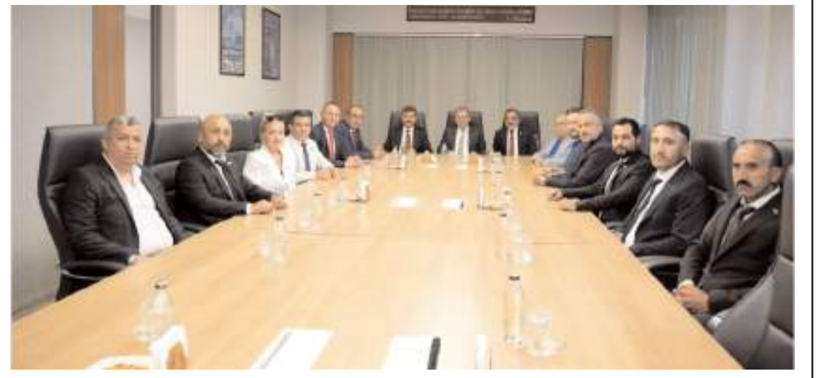
Türkiye İttifakı Partisi Genel Başkanı Ferhat Yılmaz, TSO'yu ziyaret etti.