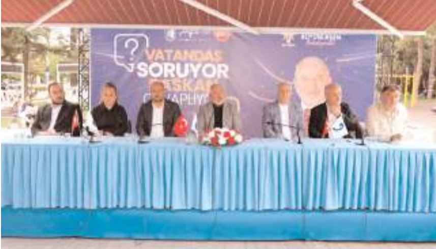
Başkan Aşgın, vatandaşların sorun ve taleplerini dinledi.