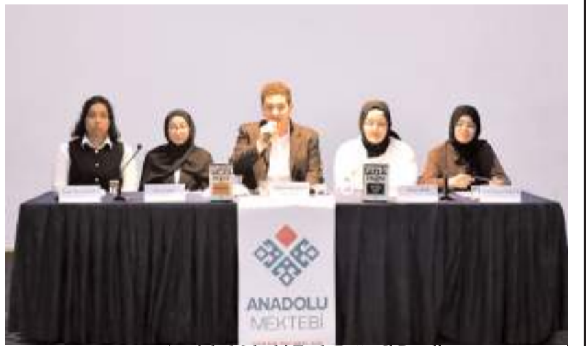
Anadolu Mektebi Tarık Buğra İl Paneli, Buhara Kültür Merkezinde gerçekleştirildi.