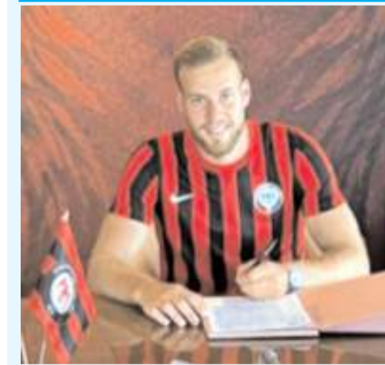
Smolcic'e yapay zekada Çorum FK'ya imza atırlı