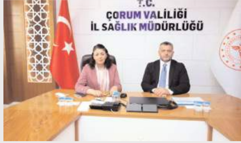
Toplantıda sağlık alanında yapılan çalışmaların son durumları değerlendirildi.