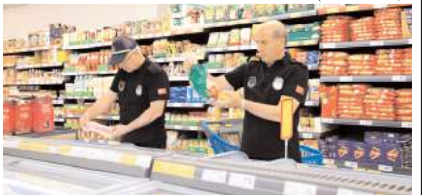
Ürünlerin son kullanma tarihleri kontrol edildi.