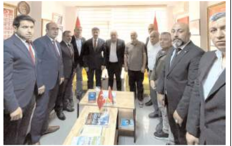
Türkiye İttifakı Partisi Genel Başkanı Ferhat Yılmaz, Çorum Şehit Aileleri ve Gaziler Derneği'ni ziyaret etti.