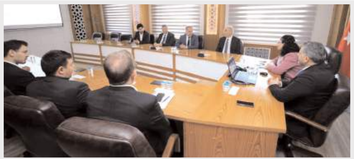
Toplantı Vali Yardımcısı Yeliz Mercan'ın başkanlığında yapıldı.