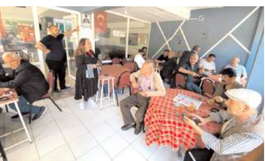
İYİ Parti heyeti vatandaşları mitinge davet etti.