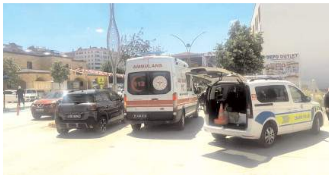
Olay yerine gelen sağlık ekipleri tarafından ilk müdahalesi yapılan E.K. hastanede tedavi altına alındı.