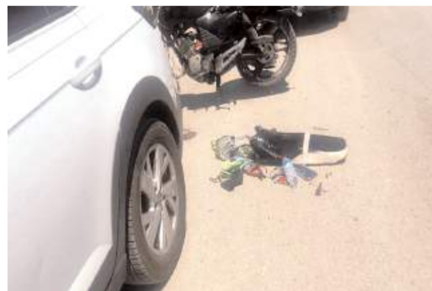
E.K., Hitit Üniversitesi Erol Olçok Eğitim ve Araştırma Hastanesi'ne

Kaza, Recep Tayyip Erdoğan Caddesi ile Alabey Sokak kesişiminde meydana geldi. Edinilen bilgilere göre, caddenin yolun karşısına geçmeye çalışan E.K.'ye, B.S. idaresindeki motosiklet çarptı. Çarpmanın etkisiyle savrulan E.K. yaralandı. Kazayı gören vatandaşların ihbarı üzerine olay yerine sağlık ve polis ekipleri sevk edildi. Olay yerine gelen sağlık ekipleri tarafından ilk müdahalesi yapılan