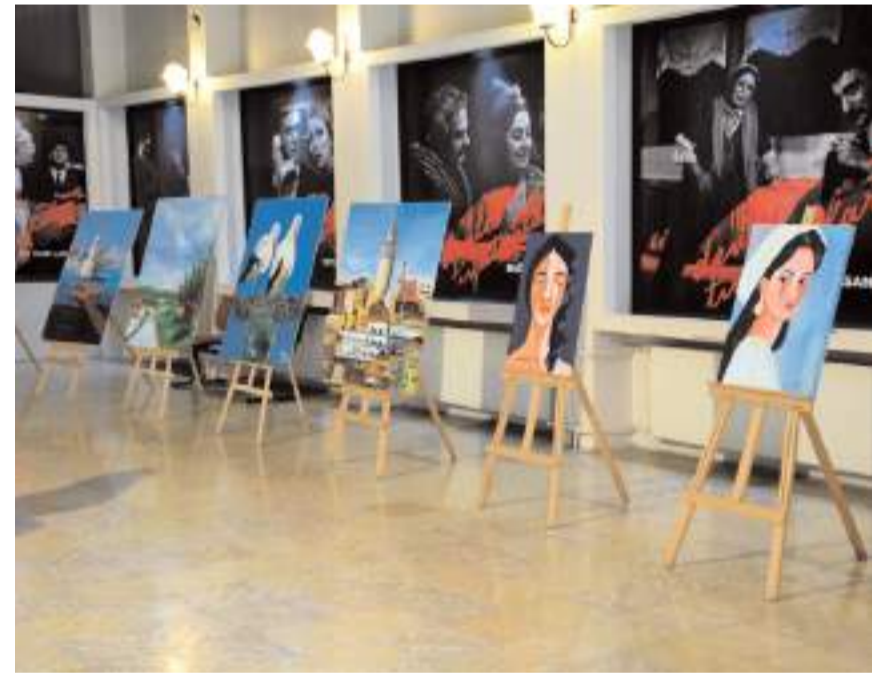
Öğrencilerin yıl boyunca yaptığı el emeği ürünler sergilendi.