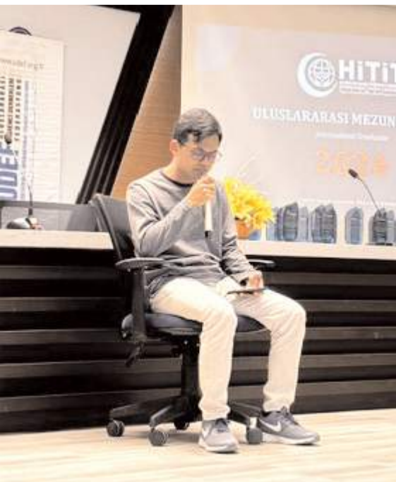
Program Kuranı Kerim tilaveti ile başladı.