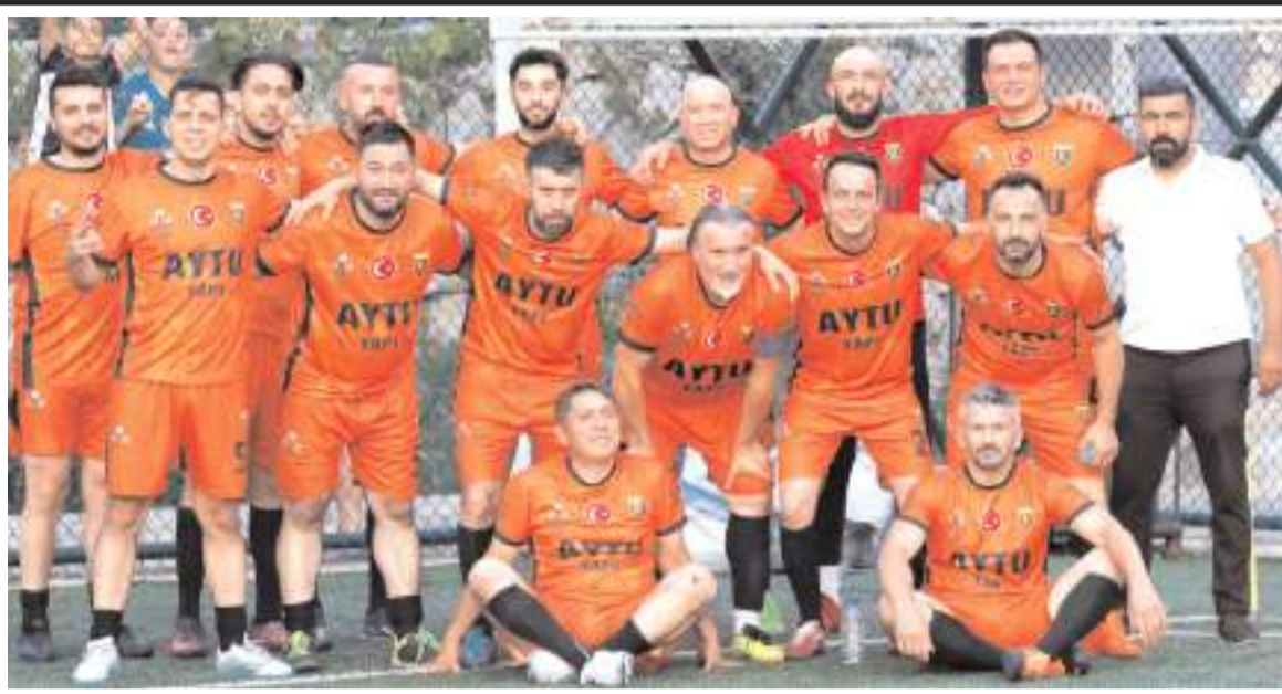
Kalehisar Kardeşler İveco lig etabını lider tamamlayan rakibini yenerek yarı finale yükselme sevinci yaşadı