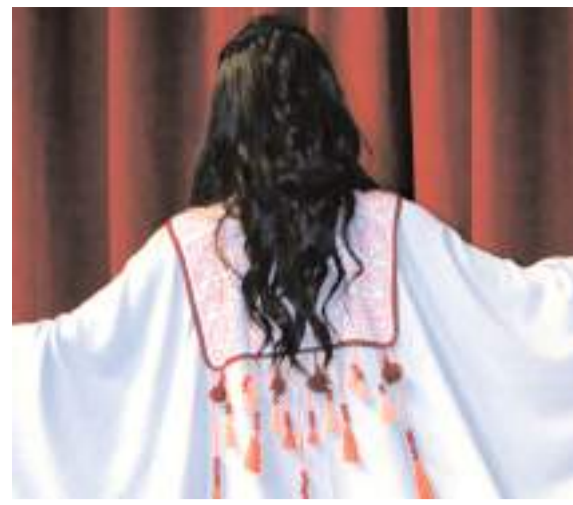
Bahçelievler Kız Mesleki ve Teknik Anadolu Lisesi tarafından hazırlanan yıl sonu etkinliği, birbirinden renkli görüntülere sahne oldu.