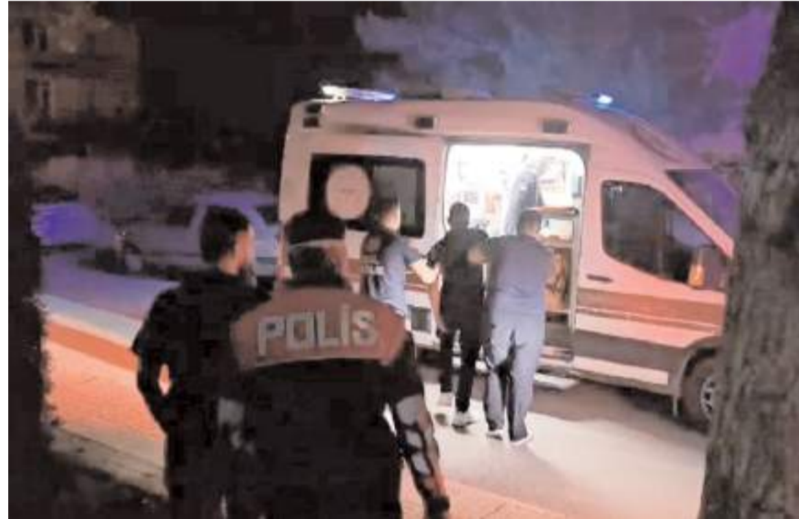
Olay, Bahçelievler Mahallesi Çoraklık 13. Sokak'ta meydana geldi.

Ziyaretin, akademik çevre ile medya sektörü arasındaki iletişimi güçlendirmesi, iş birliği olanaklarını artırması ve öğrencilerin sektörel deneyimlerini desteklemesi açısından önemli bir adım olduğu ifade edildi.