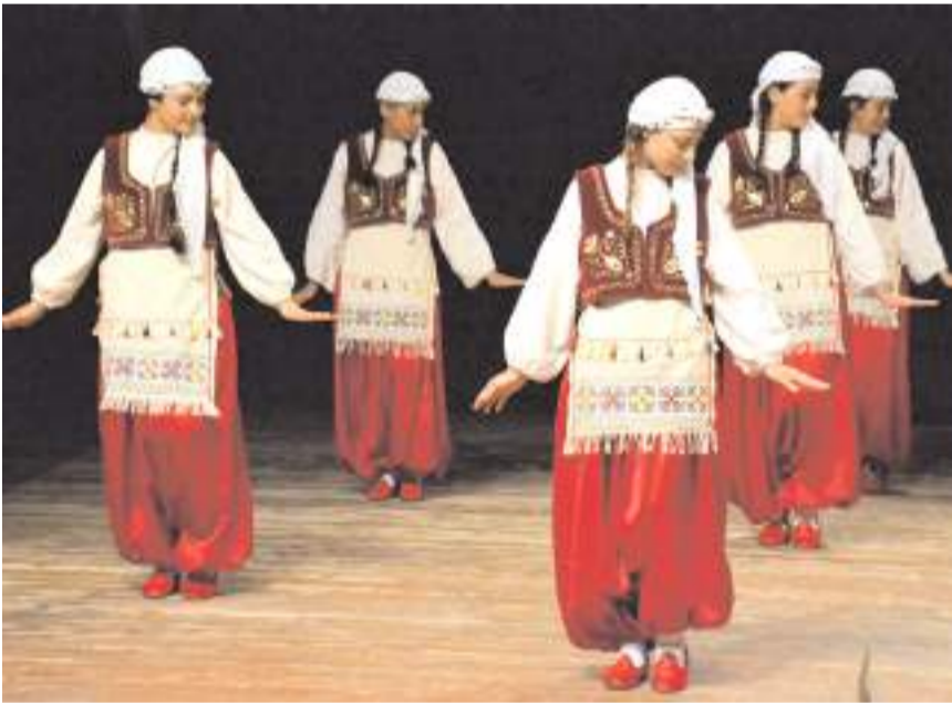
Öğrenciler tarafından halk oyunları gösterileri sahnelendi.