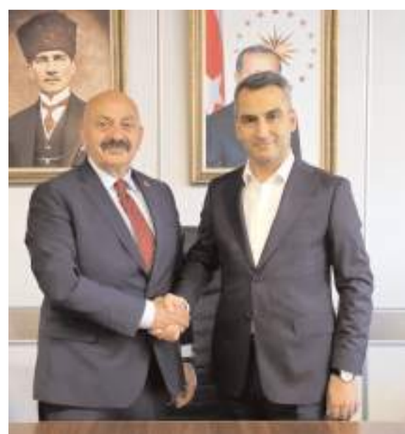
Ziyarete personel yönetimine ilişkin güncel konular ele alındı.

Gerçekleşen nezaket ziyaretinde, kamu hizmetlerinin etkinliği, kurumlar arası iş birliğinin geliştirilmesi ve personel yönetimine ilişkin güncel konular ele alındı. Samimi bir ortamda geçen görüşmede, karşılıklı fikir alışverişinde bulunularak gelecek-