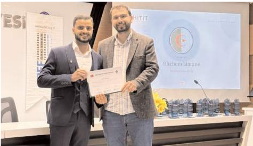
Öğrencilere sertifika ve plaketleri takdim edildi.

Hitit Uluslararası Öğrenci Derneği 2026 Mezuniyet Programı düzenledi.