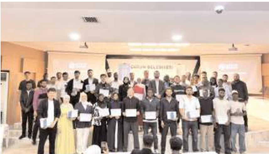
Törenin ardından toplu hatıra fotoğrafı çekildi.