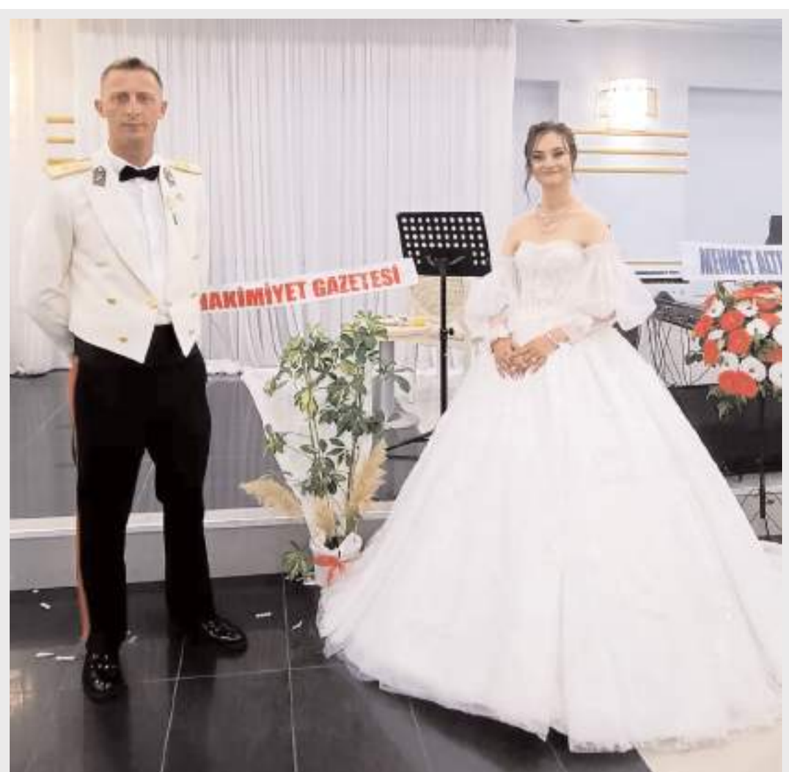
Genç çiftin düğünü Anitta Otel'de yapıldı.