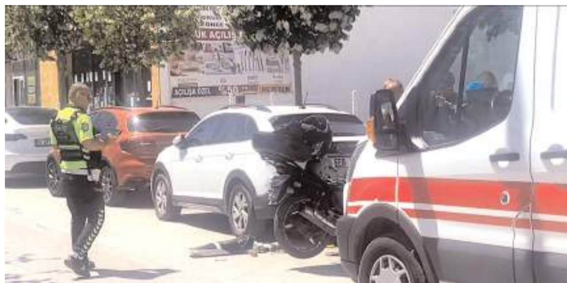
Kaza, Recep Tayyip Erdoğan Caddesi ile Alabey Sokak kesişiminde meydana geldi.