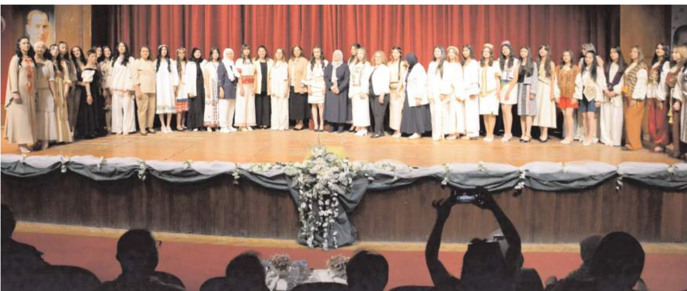
Programın ardından günün anısına toplu fotoğraf çekildi.