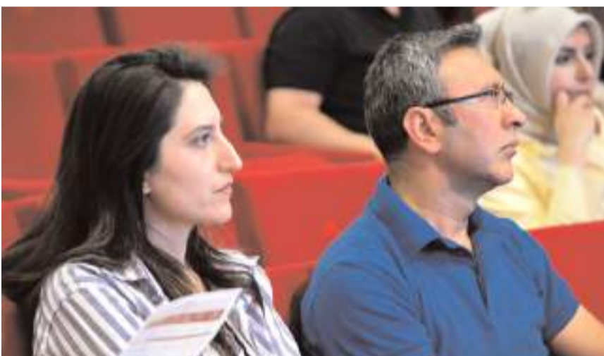
Toplantıda, YKS'nin ardından tercih aşamasına gelen öğrencilerin kariyer planlamaları ele alındı.