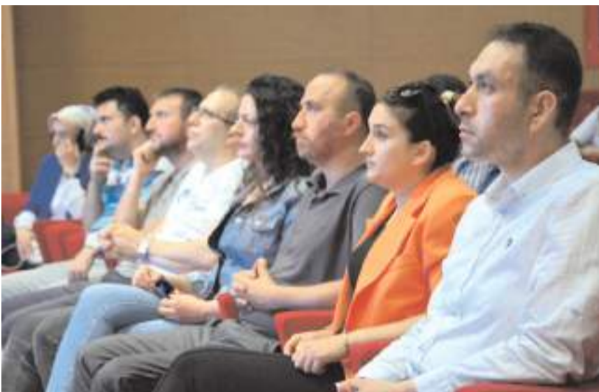
Program Meslek Yüksekokulları Kampüsü Ethem Erkoç Konferans Salonu'nda yapıldı.