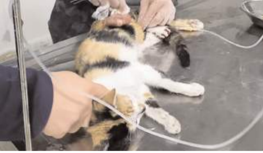
Yaralı kedinin tedavisi yapıldı.