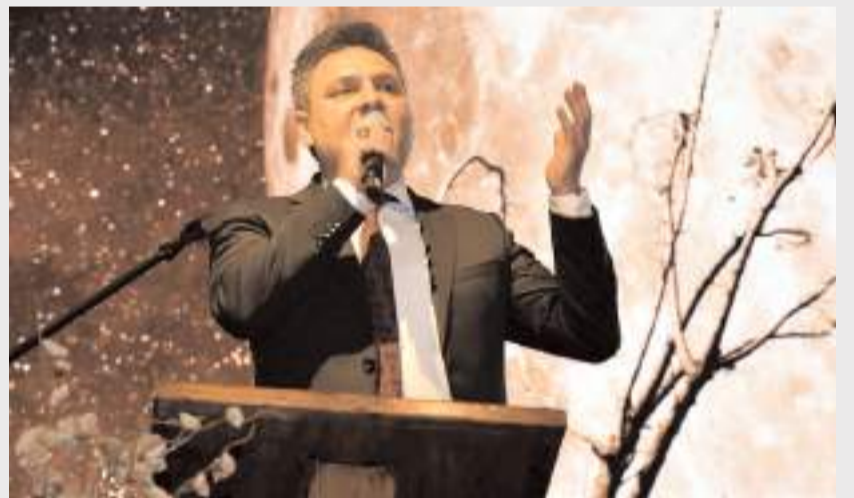
Türk edebiyatının seçkin eserlerinden şiirler protokol üyeleri, akademisyenler ve öğretmenler tarafından seslendirildi.