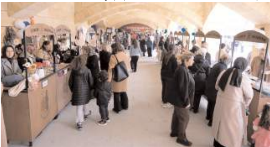
Yoğun ilgi gören etkinlikte bu yıl stant sayısını artırılarak 50'ye çıkarıldı