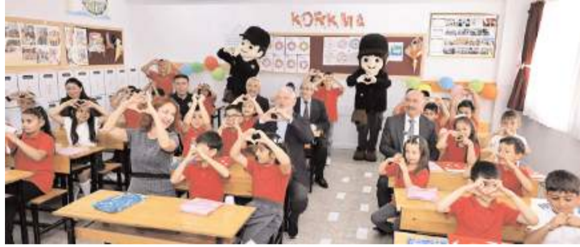
Protokol üyeleri ile öğrenciler hatıra fotoğrafı çekindiler.

Çalgan, öğrencilere tatili dinlenerek geçirmelerini tavsiye ederek; "Çorum genelinde resmi ve özel olmak üzere 438 okulda okul öncesi ilkokul, ortaokul ve liselerde öğrenim gören 83 bin 402 öğrencimiz ve görev yapan 7 bin 724 öğretmenimiz için uzun ve yorucu bir çalışma döneminin son