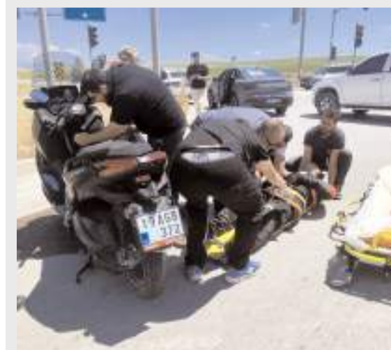
Kaza, Alaca-Zile karayolu kavşağında meydana geldi.

Çorum'un Alaca ilçesinde otomobil ile çarpışan motosikletin sürücüsü yaralandı. Kaza anı güvenlik kamerasına yansdı.