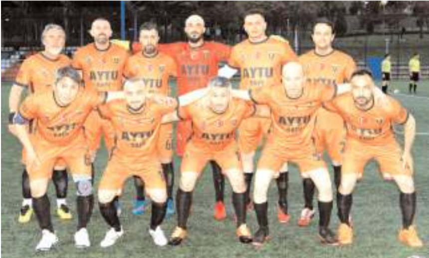
Kalehisar&Kardeşler İveco yarın final için Fora Mobilya karşısında mücadele edecek

Bu maçın ardından ikinci yarı final maçında ise saat 20'de iki Alaca takımı karşılaşacak. Lig etabında başarılı olarak çeyrek finale yükselen iki takım hafta içinde çeyrek final maçlarını kazanarak yarı final biletini almıştı.