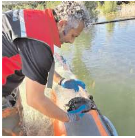
Denetim ekiplerinin Çorum Barajı'nda yaptığı denetimlerde 2 bin 800 metre uzunluğunda kaçak misina ağı ele geçirildi.