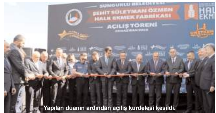
Yapılan duanın ardından açılış kurdelesini kesiliyor.