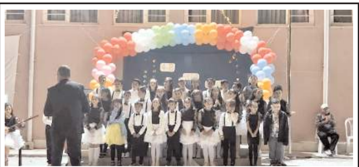
Öğrenciler mezuniyet töreniyle ilkököl eğitimlerini tamamlamanın mutluluğunu yaşadılar.