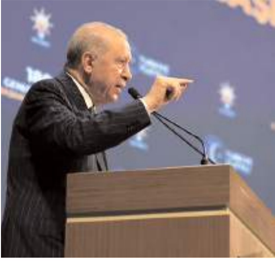
Cumhurbaşkanı Recep Tayyip Erdoğan, AK Parti Genişletilmiş İl Başkanları Toplantısı'nda konuştu.

Ak Parti Genel Merkezi'nde düzenlenen toplantıda, teknolojinin ve dijital dünyadaki popülarite arayışının siyaset üzerindeki olumsuz etkilerine dikkat çeken Cumhurbaşkanı Erdoğan, gündemde kalma kaygısının bir virüse dönüştüğünü ifade etti. Erdoğan konuya ilişkin şu sert eleştirileri yöneltti: "Sosyal medyanın da tesiriyle etkileşim avcılığı denilen bir hastalığım hem toplumda hem kamuda hem de yerel yönetimlerde yayıldı-