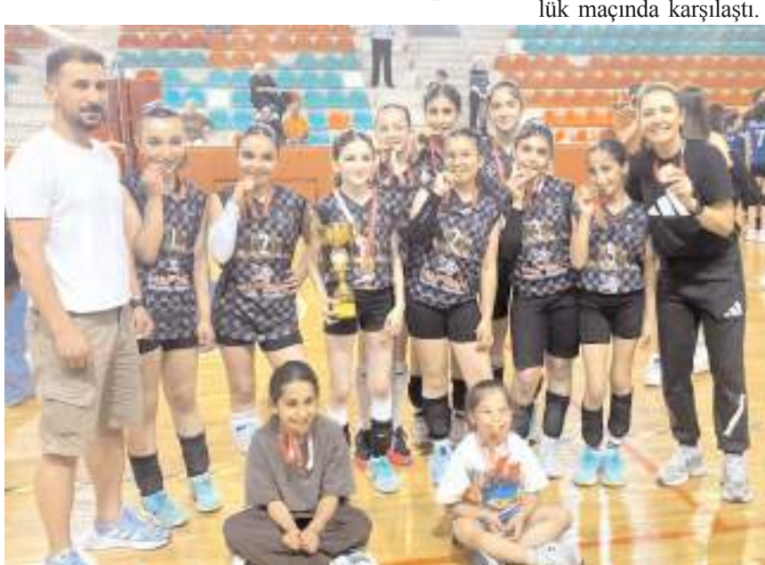
Mini Kızlar voleybolda şampiyon olan Milli Eğitimspor takımı kupa töreninde toplu halde

Final maçının ardından düzenlenen törenle dereceye giren kulüplere kupa sporcularına ise madalyaları verildi.