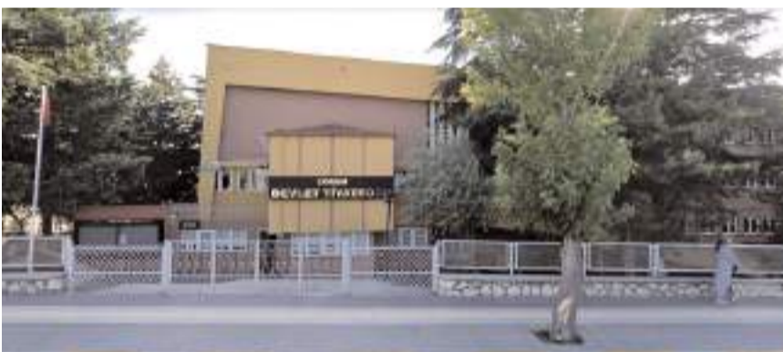
Çorum Devlet Tiyatro Salonu 42 yıl önce inşaa edildi.

Konuşmasında Çorum Devlet Tiyatrosu'nun geçmişine değinen Tahtasız, 1971 y-