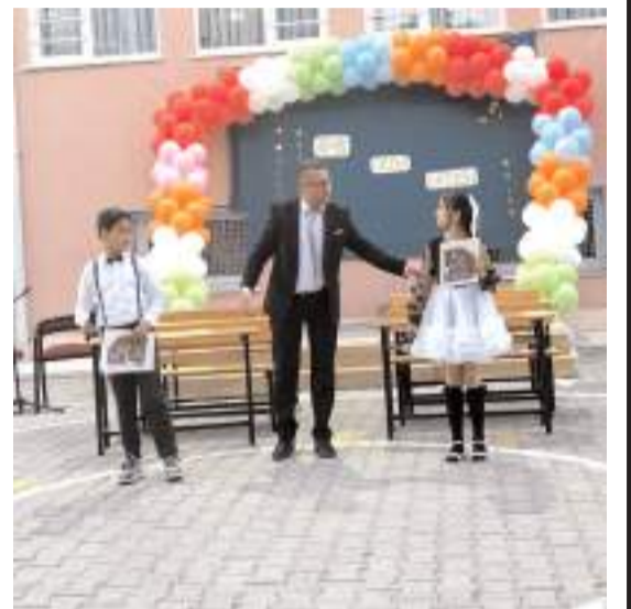
Öğrenciler şiirler seslendirdiler.

İlkokuldan ortaokula geçiş yapan öğrenciler için düzenlenen tören, toplu fotoğraf çekimi ve mezuniyet coşkusunun paylaşılmasıyla sona erdi. (Haber Merkezi)