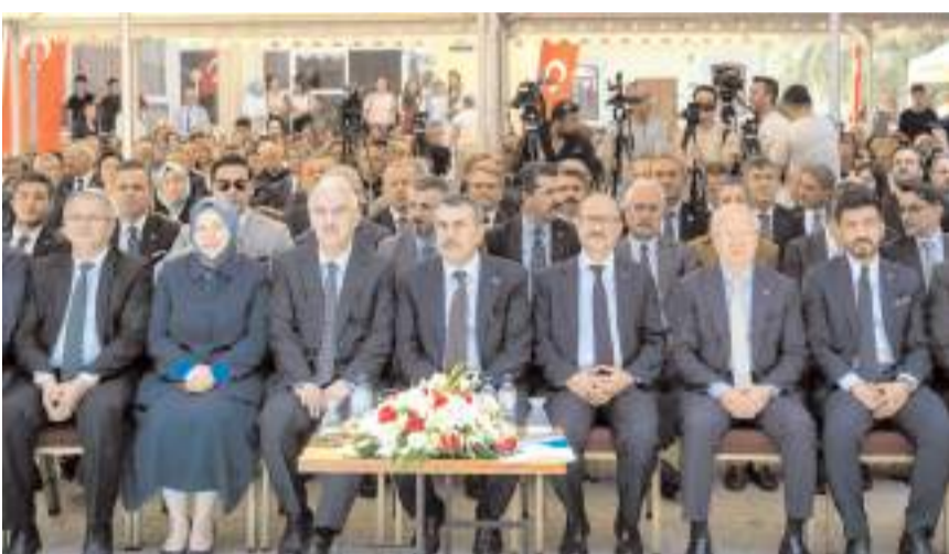
Bursa'da düzenlenen programda Türkiye'nin dört bir yanından peynir ustaları bir araya geldi.