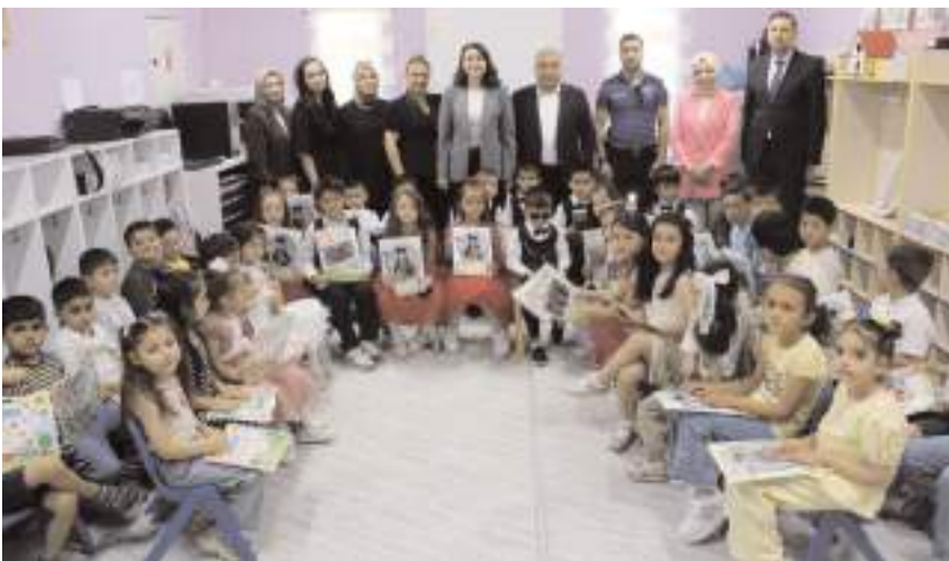
Günün anısına toplu fotoğraf çekildi.