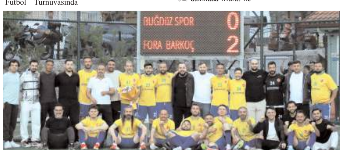
Fora Mobilya&Barcoç Mühendislik Buğdüzspor karşısında 2-0 kazanarak yarı finale yükselmeyi başardı