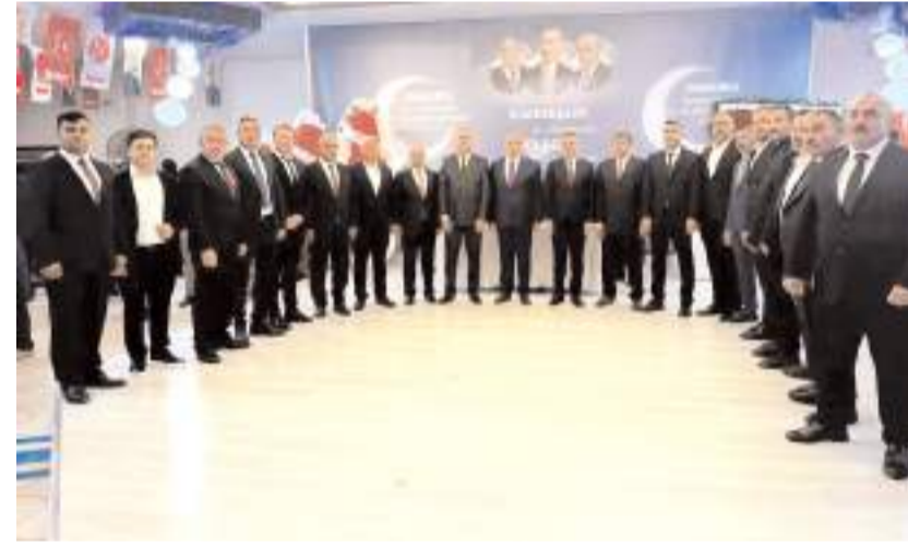
Kongrenin ardından hatıra fotoğrafı çekildi.