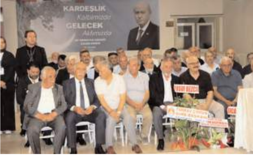
Kongreye katılım yüksek oldu.