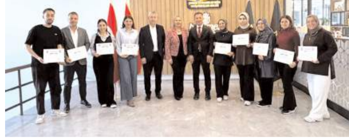
Kursa katılan personele sertifikaları törenle verildi.