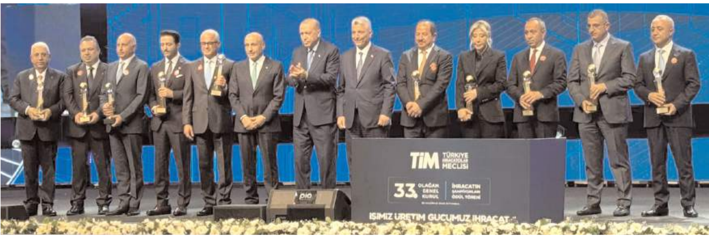
Türkiye İhracatçılar Meclisi'nin (TİM) 33. Olağan Genel Kurulu ve İhracatın Şampiyonları Ödül Töreni dün gerçekleştirildi.