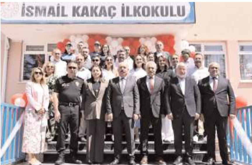
Törenin ardından protokol üyeleri ile eğitimciler hatıra fotoğrafı çekindiler.

günündeyiz. Sevgili çocuklar, uzun yorucu bir eğitim öğretim yılının sonunda tatile kavuşmuş durumdasınız. Tatili iyi değerlendirin. Şehrimizde oynayacak, gezecek, spor yapacak çok şeyler var. İyi çalışın, iyi eğlenin, iyi spor yapın" dedi