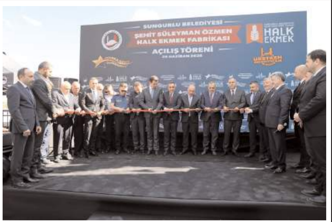
Yapılan duanın ardından açılış kurdelesi kesildi.

Yatırımın taşkın riskinin azaltılması, kent estetiğinin güçlendirilmesi ve şehir planlaması açısından önem taşıdığını vurgulayan Dere, "Şehrimizin uzun yıllardır ihtiyaç duyduğu taşkın kontrolü ve dere ıslahı çalışmalarının hayata geçirilmesi adına önemli bir adım atılmıştır. Bu yatırımın Sungurlu'muza hayırlı olmasını diliyorum." ifadelerini kullandı.(AA)