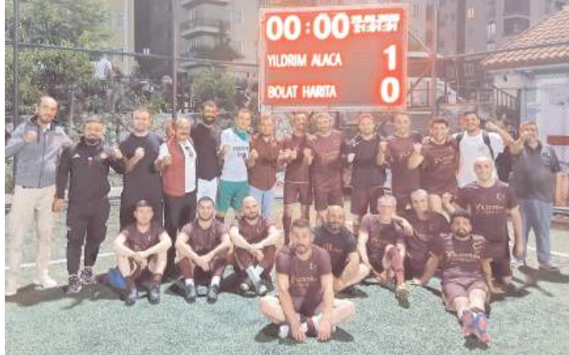
Yıldırım İnşaat Alaca çeyrek final maçını 1-0 kazanarak yarı finale yükselen son takım oldu

29. Orta Kuşak Futbol'da yarı finalistler belli oldu