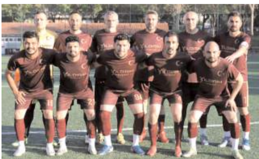
Yıldırım İnşaat Alaca yarın final için Alaca derbisinde Çopraşık ile karşılaşacak

29. Orta Kuşak Futbol'da yarı finalistler belli oldu