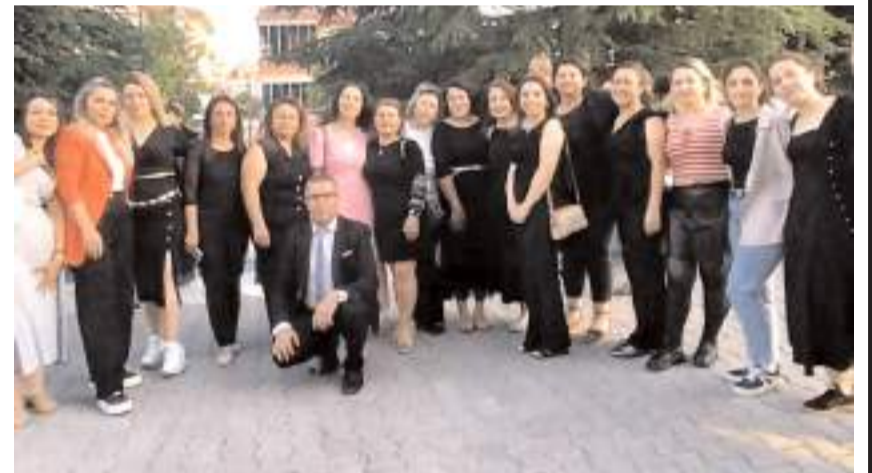
Tören, toplu fotoğraf çekimi ve mezuniyet coşkusunun paylaşılmasıyla sona erdi.