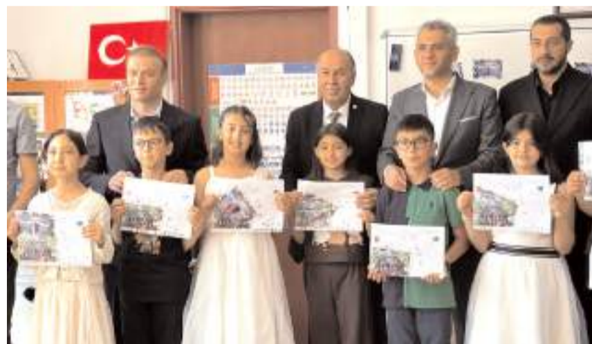
Öğrencilere kamelerini protokol üyeleri verdi.

Çorum'un Alaca ilçesinde 2025-2026 eğitim yılının sona ermesiyle 4 bin 503 öğrenci karne alarak yaz tatiline başladı.