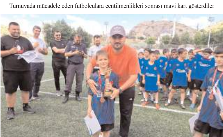
Turnuvada mücadele eden futbolculara centilmenlikleri sonrası mavi kart gösterildi