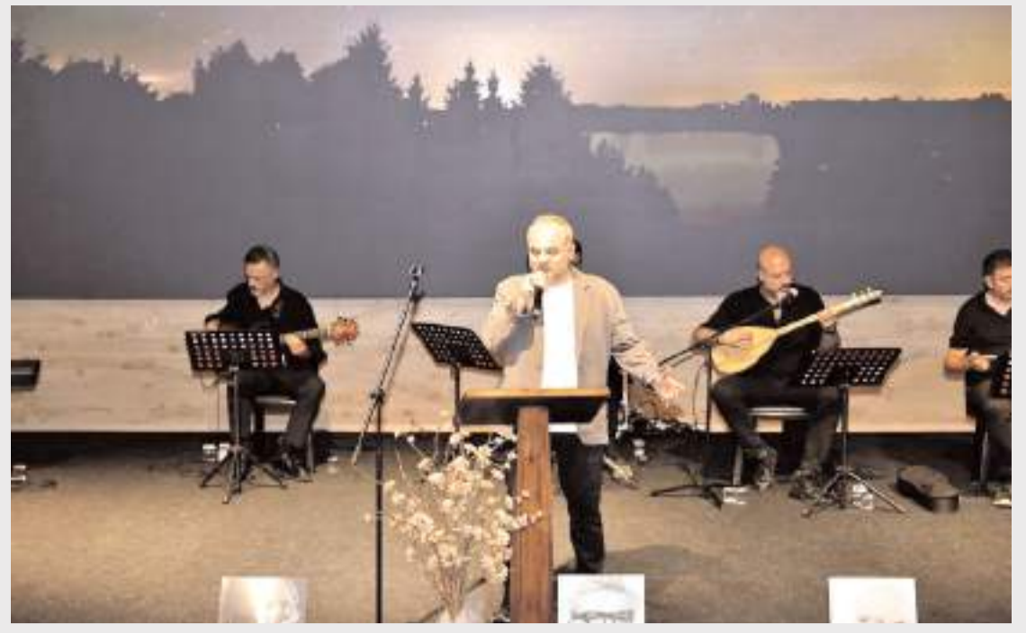
Öğretmen Akademilerinin kapanış programı yapıldı.

"İŞKUR'a kayıtlı, 18 yaşını tamamlamış ve Türkiye Cumhuriyeti vatandaşı olmak, yaşlılık (emekli) ve malullük aylığı almamak (iş göremezlik veya ölüm aylığı alanlar programdan faydalanabilir), başvuru tarihinden ve katılım olarak seçildiği takdirde başlama tarihinden önceki son bir aylık sürede 5510 sayılı Kanunun 4'üncü maddesi kapsamında sigortalı olmamak, son bir yılda yüklenici kurumum, bağlı veya yan kuruluşunun çalışanı olmamak, programa başvuru, başlangıç ve program devamı süresince 5510 sayılı Kanunun 5'inci maddesi (kısa vadeli sigorta) kapsamında sigortalı olmamak, başvuru tarihindeki Adres Kayıt Sistemine (AKS) göre aynı adreste ikamet edenlerin belirlenen ana aya ait aylık toplam kazançlarının, bir aylık net asgari ücretin iki katını aşmaması (yurtlar ve sığınma evleri, vb. toplu yaşam alanlarında ikamet edenler için bu şart aranmaz), başvuru tarihi itibarıyla aktif işgücü programlarından ve işsizlik sigortasından faydalanmamak (işsizlik ödeneği hak etmemiş ve almıyor olmak), terör örgütlerine veya Milli Güvenlik Kurulunca Devletin milli güvenliğine karşı faaliyette bulunduğu karar verilen yapı, oluşum veya gruplara üyeliği, mensubiyeti veya iltisakı yahut bunlarla irtibatı bulunmamak. (Haber Merkezi)