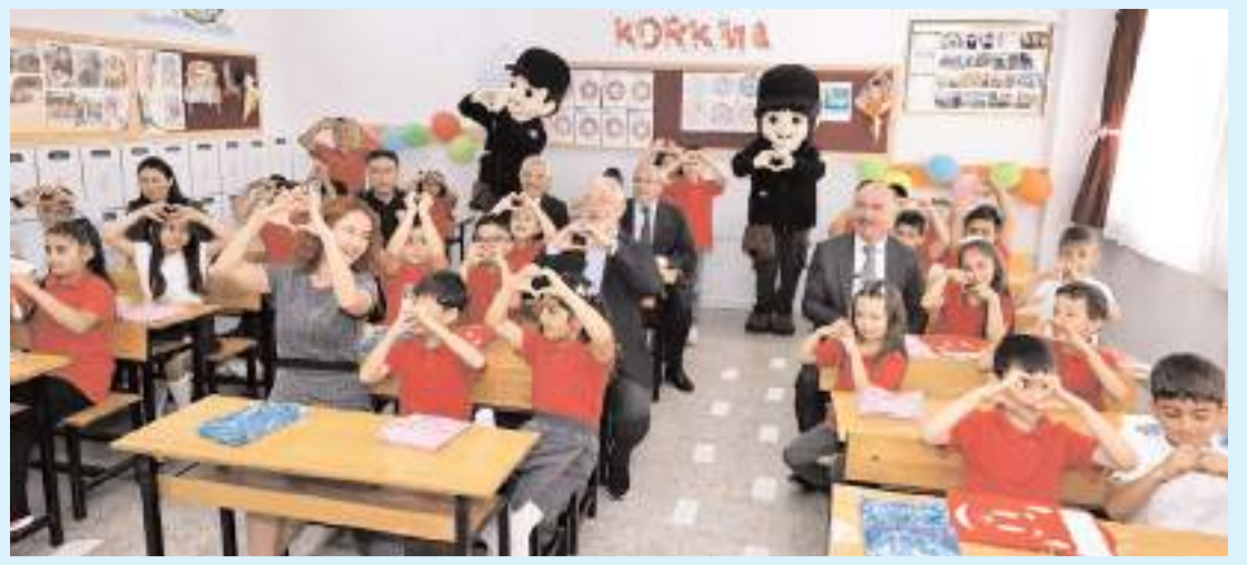
Protokol üyeleri ile öğrenciler hatıra fotoğrafı çekiliyor.

■ AK Parti Genişletilmiş İl Başkanları Toplantısı'nda konuşan Cumhurbaşkanı Recep Tayyip Erdoğan, son dönemde yerel yönetimlerde ve siyasetçiler arasında yayılan "sosyal medya fenomeni" akımına tepki göstererek, "Maalesef kendi arkadaşlarımızın bir kısmı da bu akıntıya kapılıyor. Partimize zarar veren bu şov yaklaşımlarını tasvip etmemiz mümkün değildir" dedi. * HABERİ'3TE