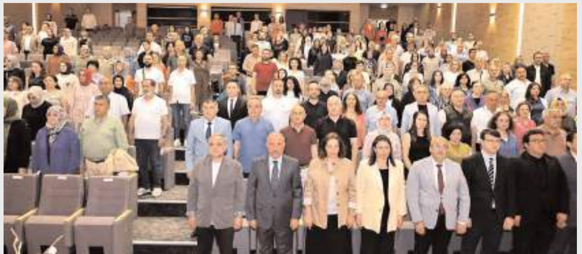
Program TSO Konferans Salonunda yapıldı.

"Bir Başkadır Benim Memleketim" eseri ise geceye anlamlı bir final oldu.