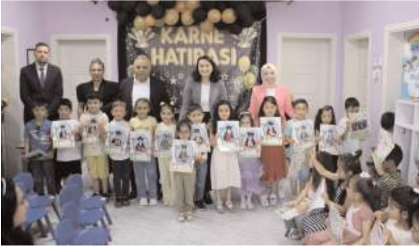
Miniklere karnelerini Kaymakam Gizem Tokur verdi.

Belediyenin eğitim desteklerinin süreceğini anlatan Çetinkaya, öğrencilere sağlıklı, mutlu ve huzurlu tatil geçirmelerini diledi (AA)