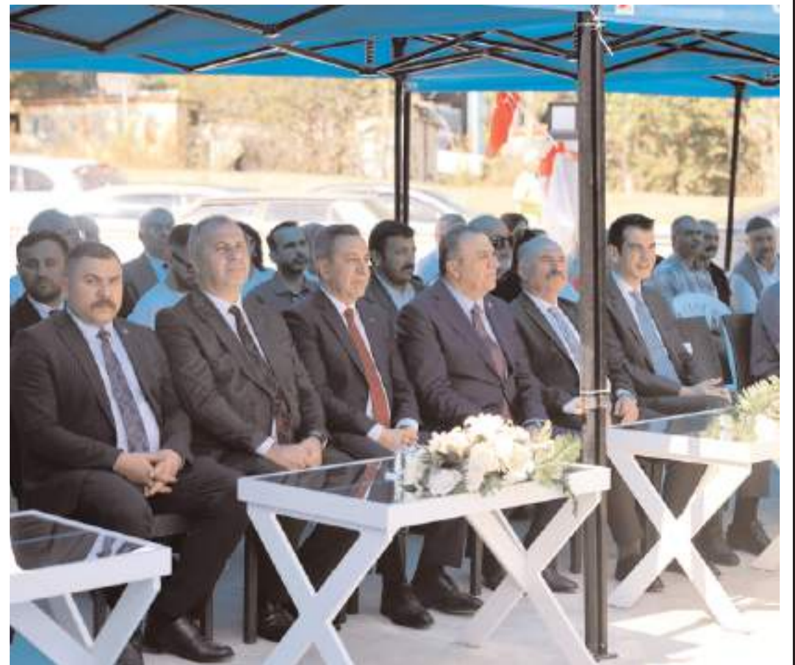
Sungurlu Belediyesi Şehit Süleyman Özmen Halk Ekmek Fabrikası düzenlenen törenle açıldı.