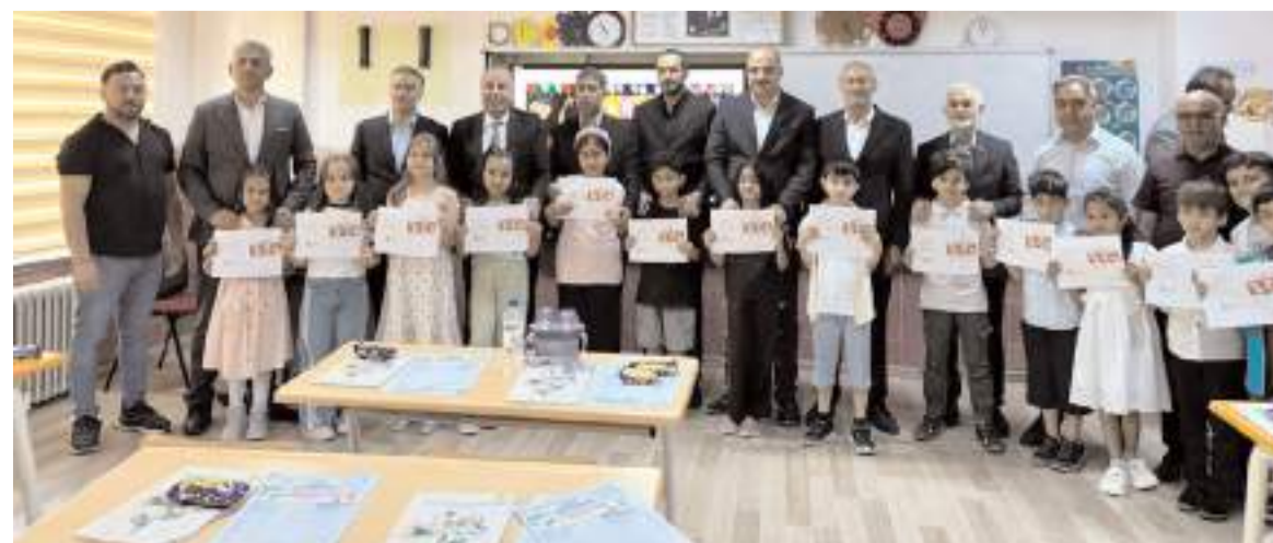
Karne töreninin ardından hatıra fotoğrafı çekildi.

Katılımcılar, sınıfları ziyaret ederek öğrencilere kamelerini dağıttı, yaz tatilini iyi değerlendirmeleri tavsiyesinde bulundu. (AA)