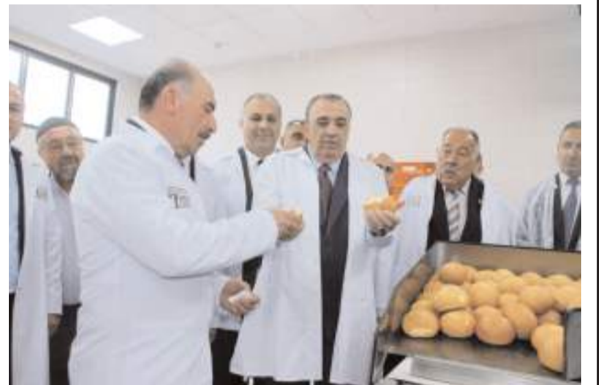
Davetliler fabrikada üretilen ekmekleri tattılar.