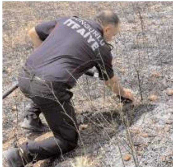
Soğutma çalışmaları sırasında ekipler, yangın alanında bir kaplumbağa buldu.

Kaza, Osmancık Caddesi İkbal ışıklarında meydana geldi. Edinilen bilgiye göre, Barış K. idaresindeki otomobil, aynı yönde kırmızı ışıkta bekleyen Kübra Y. yönetimindeki araca arkadan çarptı. Çarpmanın etkisiyle savrulan otomobil, yol kenarında park halinde bulunan başka bir araca da çarparak durabildi. Kazada iki sürücü de yaralandı. Vatandaşların ihbarı üzerine olay yerine sağlık ve polis ekipleri sevk edildi. Yaralılar, sağlık ekiplerinin ilk müdahalesinin ardından kentteki hastanelere kaldırıldı. Kaza nedeniyle bölgede trafik akışı bir süre kontrollü olarak sağlandı. Hasarlı araçların çekici yardımıyla yoldan kaldırılmasının ardından trafik normale döndü. Polis ekipleri kazayla ilgili inceleme başlattı. (İHA)