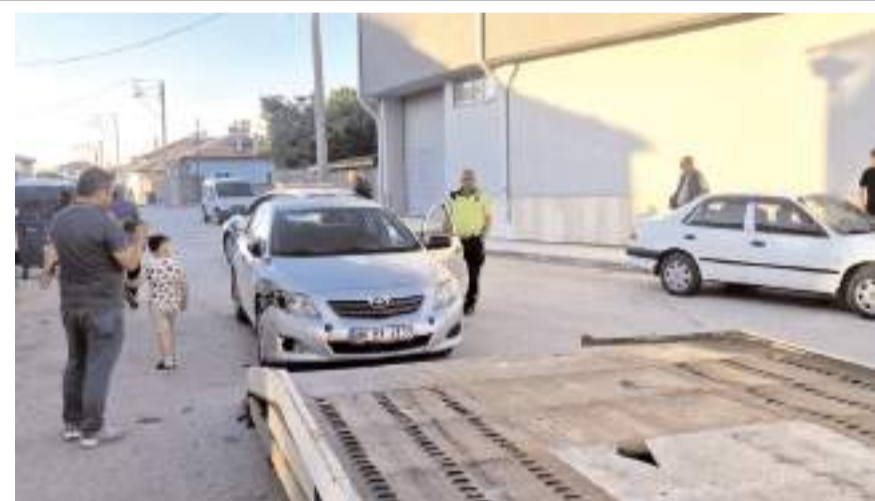
Olay, Alaca ilçesi Vali İsmail Fırat Caddesi'nde meydana geldi.

Olay, Alaca ilçesi Vali İsmail Fırat Caddesi'nde meydana geldi. Edinilen bilgiye göre, M.Ş. idaresindeki otomobil, sürücüsünün direksiyon hakimiyetini kaybetmesi neticesinde yol kenarında park halinde bulunan 4 ayrı araca çarptı. Kazada şans eseri yaralanan olmazken, yapılan ihbar üzerine olay yerine polis