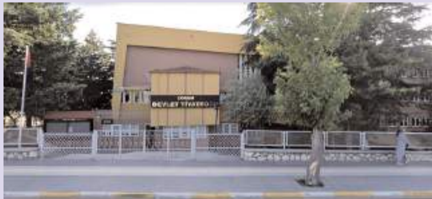
Çorum Devlet Tiyatro Salonu 42 yıl önce inşaa edildi.