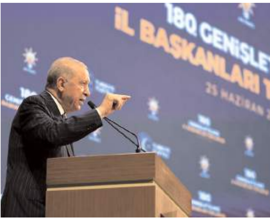
Cumhurbaşkanı Recep Tayyip Erdoğan, AK Parti Genişletilmiş İl Başkanları Toplantısı'nda konuştu.

■ AK Parti Genişletilmiş İl Başkanları Toplantısı'nda konuşan Cumhurbaşkanı Recep Tayyip Erdoğan, son dönemde yerel yönetimlerde ve siyasetçiler arasında yayılan "sosyal medya fenomeni" akımına tepki göstererek, "Maalesef kendi arkadaşlarımızın bir kısmı da bu akıntıya kapılıyor. Partimize zarar veren bu şov yaklaşımlarını tasvip etmemiz mümkün değildir" dedi. * HABERİ'3TE