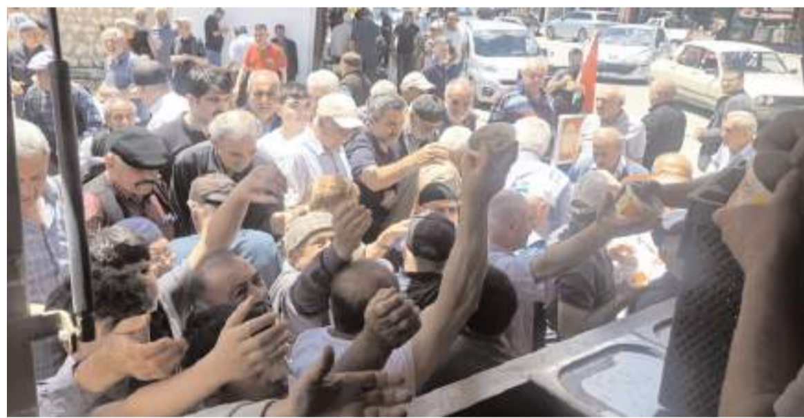
Aşure ikramına ilgi yüksek oldu.