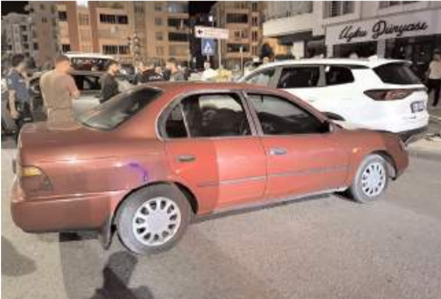
Kazada araçlarda maddi hasar meydana geldi.

Çorum'da 3 aracın karıştığı zincirleme trafik kazasında 2 sürücü yaralandı.