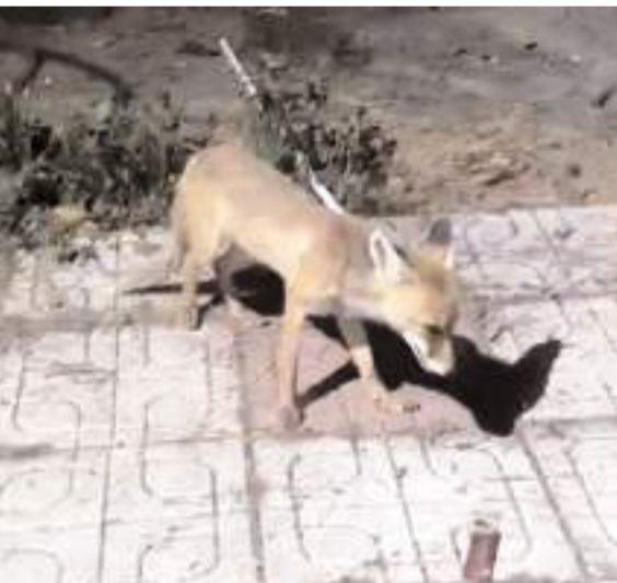
Çorum'da yiyecek arayan bir tilki, bir bağ evinin bahçesine girdi.

Sürücü hakkında adli işlem başlatıldı. (İHA)