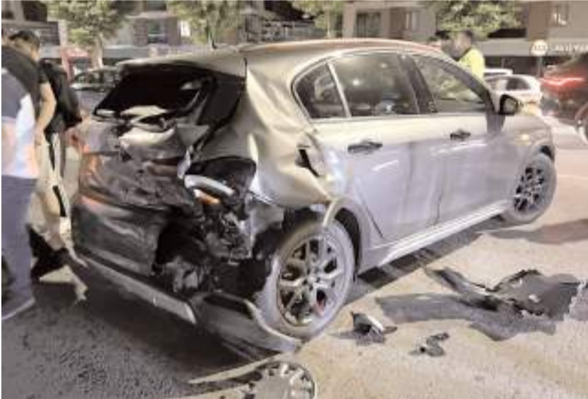
Kaza, Osmancık Caddesi İkbal ışıklarında meydana geldi.