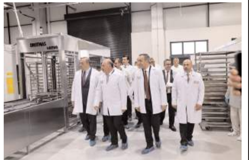
Açılışın ardından protokol üyeleri fabrikayı gezdi.