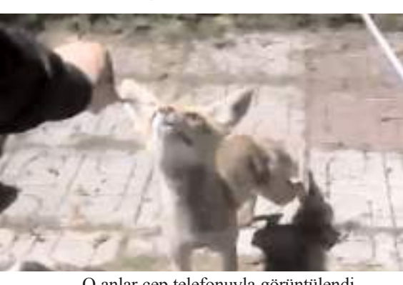
O anlar cep telefonuyla görüntülendi.

Çorum'da yiyecek arayan bir tilki, bir bağ evinin bahçesine girdi. Tilkiyi fark eden vatandaş ise yiyecek uzattı. Vatandaşlardan korkmayan tilki uzatılan yiyecekleri alarak karnını doyurdu. Vatandaşın yaban hayvanını kendi elleriyle beslediği o anlar ise cep telefonu kamerasına yansdı. Görüntülerde tilkinin vatandaşın elinden yiyeceği olarak yediği görülüyor. (İHA)