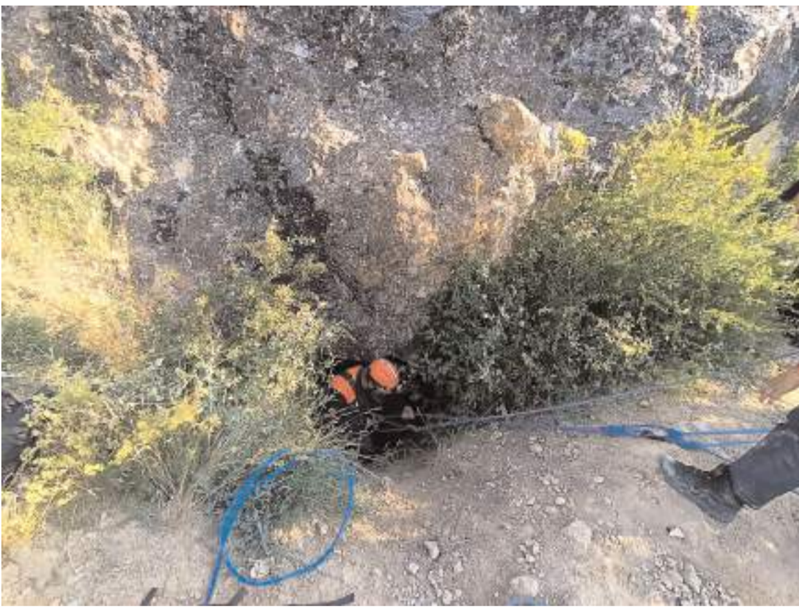
Kurtarma çalışmasını AFAD ekipleri yürütüyor.