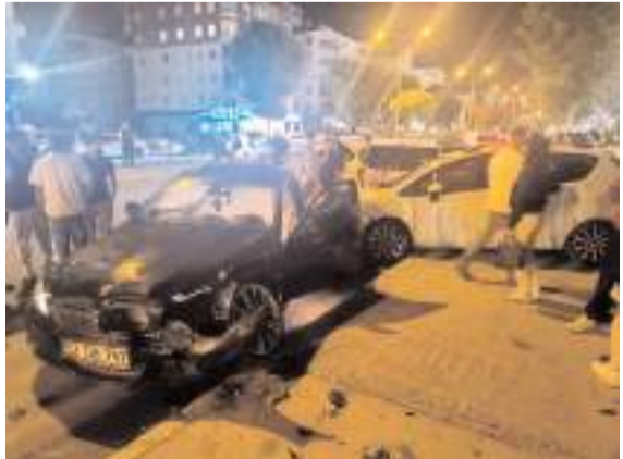
Kazada araçlarda maddi hasar meydana geldi.

■ Çorum Belediyesi, Buharaevler Mahallesi'nde imar planı revizyonu yapılan yaklaşık 96 dönümlük tartışmalı arsa hakkında kamuoyunda yer alan iddialara ilişkin yazılı bir açıklama yayımladı. Belediye, plan değişikliğinin hukuki dayanaklarını ve gerekçelerini sıralarken, kamuoyunda dile getirilen iddiaların gerçeği yansıtmadığını belirtti. * HABERİ 3'TE