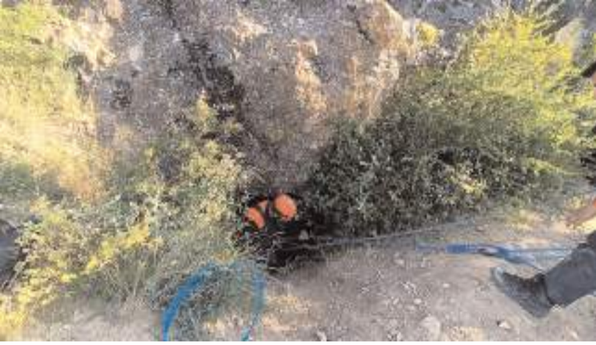
Kurtarma çalışmasını AFAD ekipleri yürütüyor.

■ Çorum'da izinsiz kazı yapmak için arkadaşlarıyla girdiği mağarada mahsur kalan kişiyi kurtarma çalışması başlatıldı. * HABERİ 11'DE