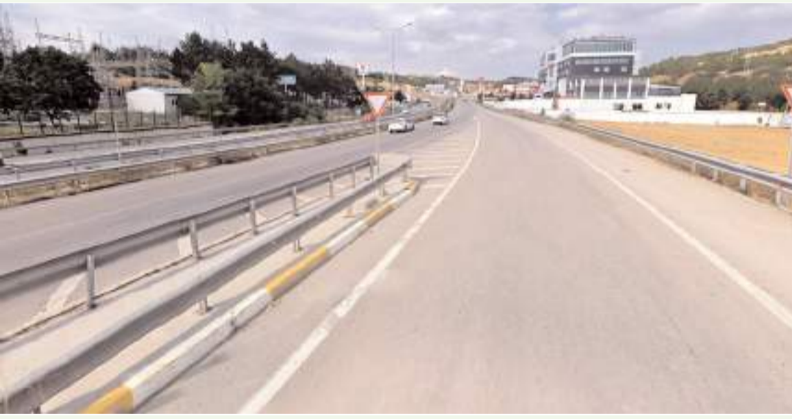
Kısa katılım şeridi nedeniyle sürücüler zor anlar yaşıyor.

■ Çevreyolu'nda Samsun istikametine katılımın sağlandığı kavşakta yaşanan trafik yoğunluğu ve kısa katılım şeridi nedeniyle sürücüler, bölgede kaza riskinin arttığını belirterek yetkililerden düzenleme talebinde bulundu. * HABERİ 5'TE