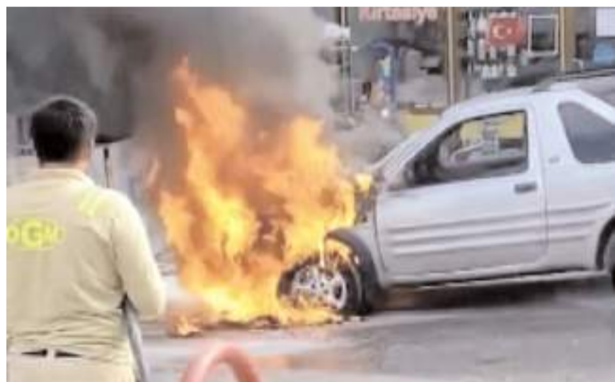
Olay, Kastamonu'nun Tosya ilçesi Tosya Devlet Hastanesi kavşağında meydana geldi.

Aracın kendisine bir oto galeri tarafından eksik parçalarıyla satıldığını id-