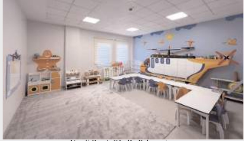
Neşeli Çocuk Gündüz Bakımevine, 37-66 ay aralığındaki çocuklar kabul edilecek.

İlk gündüz bakımevinin açılış hazırlıkları sürerken, ikinci gündüz bakımevinin de Bahçelievler Mahallesi'nde hayata geçirilmesi için çalışmalar devam ediyor. (Haber Merkezi)