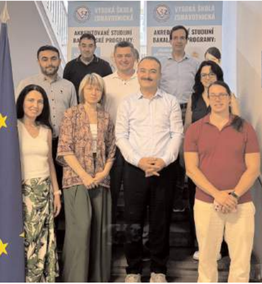
IMAP4U projesinin "Son Ulusötesi Proje Toplantısı", Prag'da gerçekleştirildi.