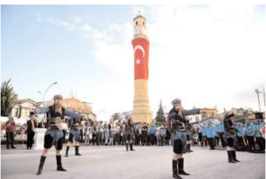
Festivalin açılışı 21 Temmuz Salı günü yapılacak.