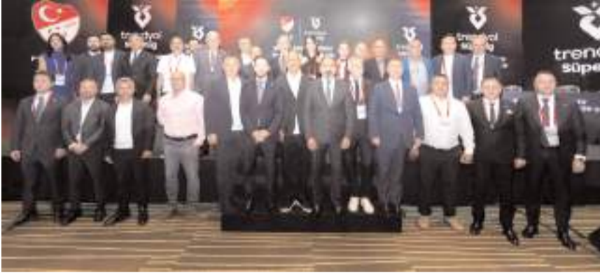
Süper Lig fikstür çekimine katılan kulüp temsilcileri ve Federasyon yetkilileri toplu halde

Tarihinde ilk kez Süper Ligde mücadele edecek olan Arca Çorum FK sezona zorlu bir fikstürle başlayacak. Kırmızı Siyahlı takım ilk hafta geçen yılın şampiyonu Galatasaray ile deplasmanda ikinci haftada Kasımpaşa ile evinde seyircisiz oynayacak üçüncü hafta da Beşiktaş ile deplasmanda karşılaşacak. Kırmızı Siyahlı takım 11. haftada evinde Fenerbahçe ile 14. haftada ise Trabzonspor ile deplasmanda mücadele edecek.