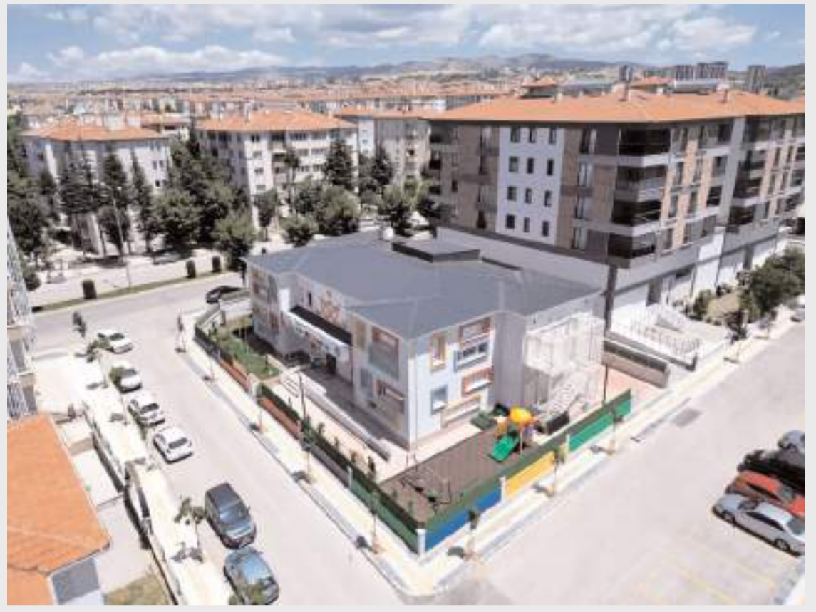
Neşeli Çocuk Gündüz Bakımevi, Dr. Sadık Ahmet Caddesinde bulunuyor.