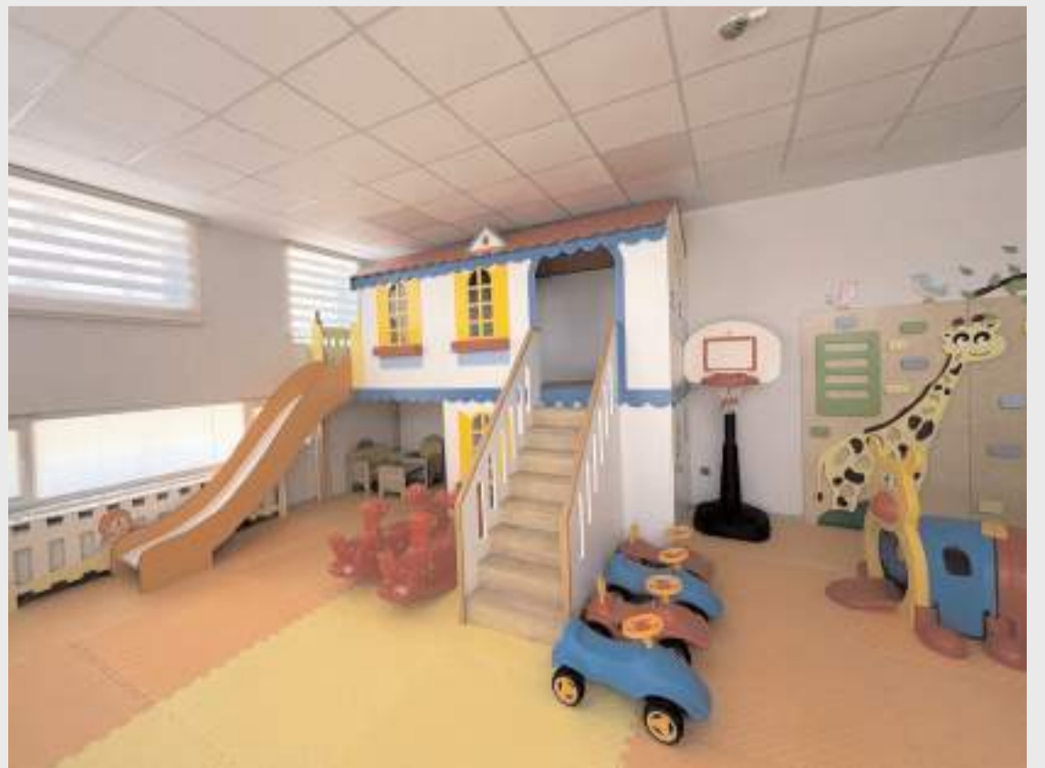
Gündüz bakımevi modern tefrişatı ile dikkat çekiyor.