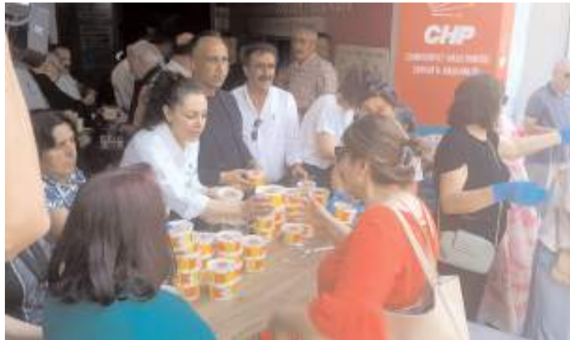
Aşure ikramı CHP İl Başkanlığı önünde yapıldı.

Solmaz'ın konuşmasının ardından aşure, vatandaşlara ikram edildi.