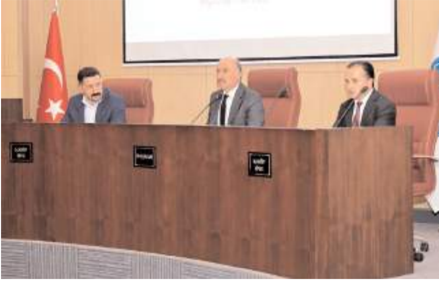
Toplantı Vali Ali Çalgan'ın başkanlığında yapıldı.