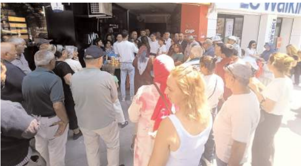
Aşure ikramına ilgi yüksek oldu.