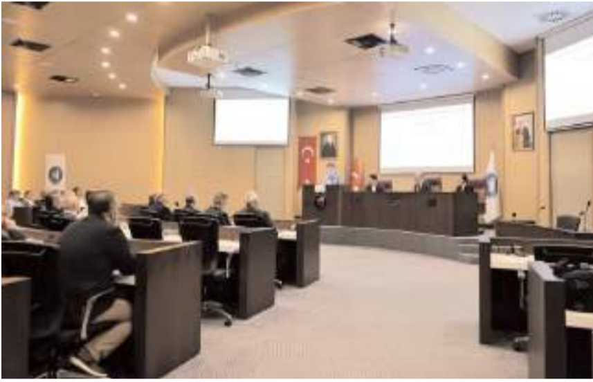
Toplantıda gündem maddeleri görüşülerek karara bağlandı.