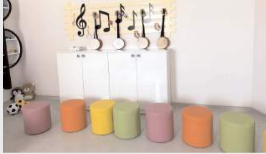
Aylık ücretin 16 bin 770 TL olarak belirlendi.