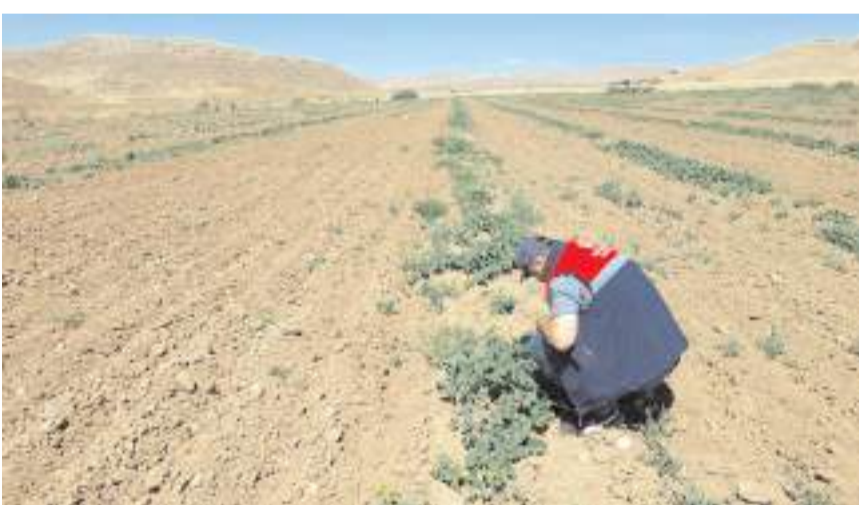
Sungurlu İlçe Tarım ve Orman Müdürlüğü teknik personellerince, ilçede kavun üretimi yapılan alanlarda hastalık ve zararlı kontrolleri gerçekleştirildi.

kontrollerde; kavunda verim ve kalite kaybına neden olabilecek küllleme hastalığı, mildiyö (yalancı mildiyö) ve fusarium solgunluğu gibi hastalıklar ile kavun sineği başta olmak üzere zararlılar yönünden arazi gözlemleri gerçekleştirildi. Teknik personeller tarafından yaprak, sürgün ve gelişmekte olan meyveler kontrol