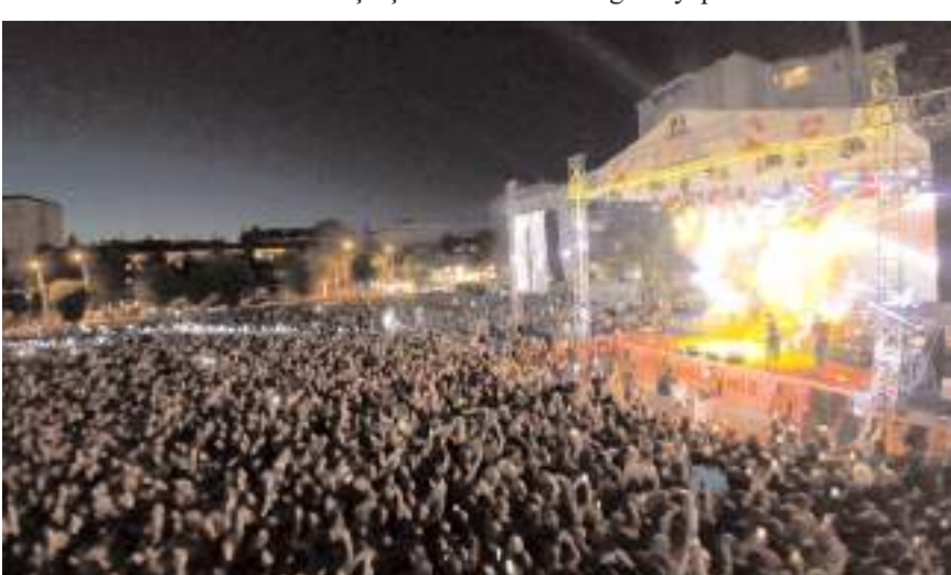
Festivalde konserler düzenlenecek.