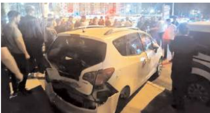
Kaza, gece saatlerinde Dr. İlhan Gürel Caddesi üzerinde meydana geldi.