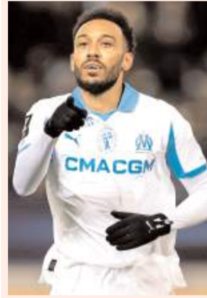
Aubameyang Marsilya forması giyiyor

Tecrübeli futbolcunun bu hafta sonuna kadar İstanbul'da sağlık kontrolünden geçmesinin ardından takımına katılacağı belirtildi. Bu konuda kulüp yönetimi resmi açıklama yapmakla birlikte önümüzdeki günlerde bu transferin netlik kazanması bekleniyor.