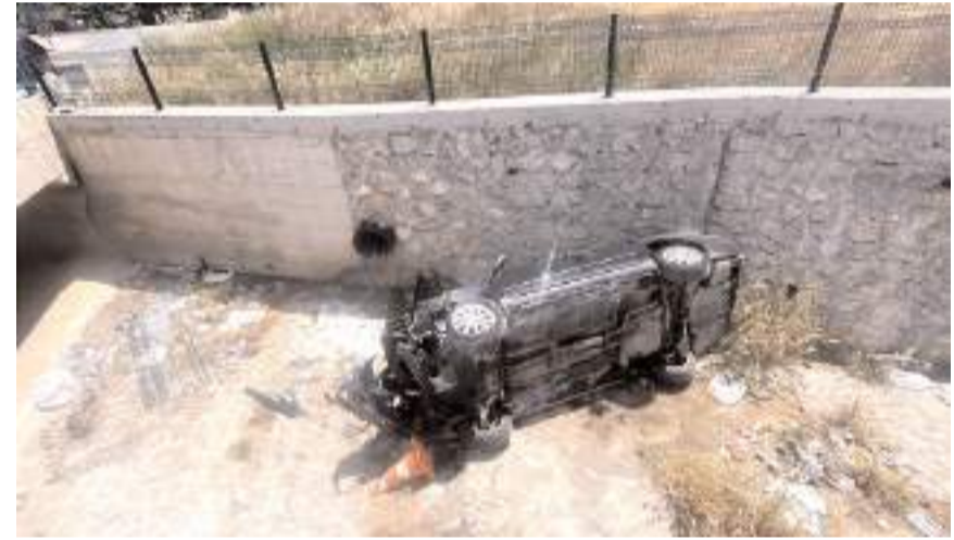
Kaza, Söğütlü Evler Caddesi'nde meydana geldi.

Kaza, Söğütlü Evler Caddesi'nde meydana geldi. Edinilen bilgilere göre, otomobil, sürücüsünün direksiyon hakimiyetini kaybetmesi neticesinde kontrolden çıkarak yaklaşık 2,5 metre yükseklikten dereye uçtu. Kazada otomobilde bulunan K.G. ve S.G. yaralandı. 112 Acil Çağrı Merkezine yapılan ihbar üzerine olay yerine sağlık, polis