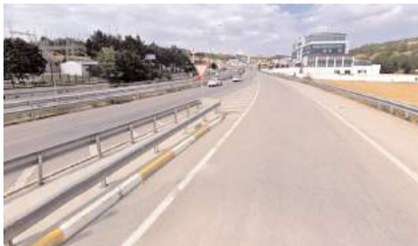
Kısa katılım şeridi nedeniyle sürücüler, bölgede kaza riskinin arttığını belirterek yetkililerden düzenleme talebinde bulundu.