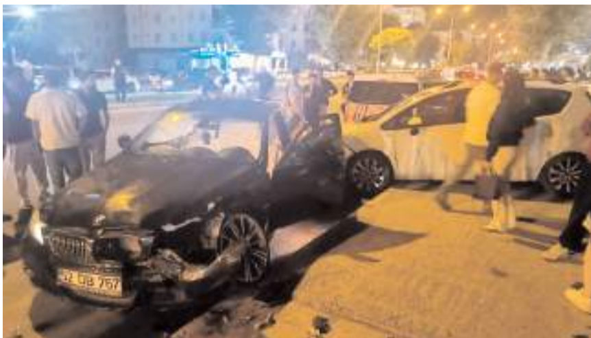
Kazada araçlarda maddi hasar meydana geldi.

Kazayla ilgili inceleme başlatıldı. (İHA)